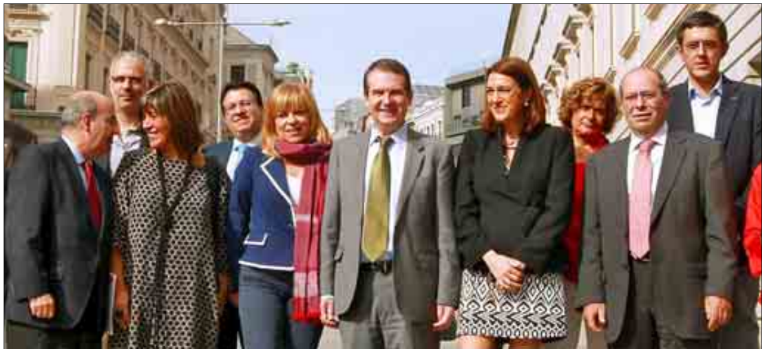
Alcaldes del PSOE, con el de Vigo, Abel Caballero, a la cabeza, junto a otros dirigentes socialistas. / JOSÉ AYMÁ

sivamente contra la reforma por entender que vacía de competencias a los ayuntamientos y pone en peligro la prestación de servicios sociales básicos a los ciudadanos.