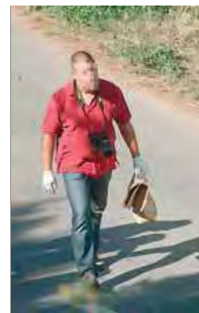
Un mossos porta el crani en una bossa

fan pensar que el crani correspon a Meurer, perquè no tenia dentat i el desaparegut feia molt temps que duia dentadura postissa. Encara que tots els indicis avalin que el cos i el cap corresponen al veí de Pals (la indumentària també lligava), cal fer la