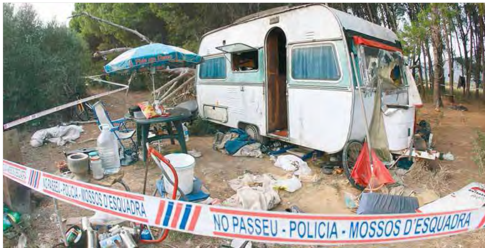
La caravana on van ser trobats els dos cadàvers, envoltada de brutícia i ara precintada pels Mossos, que investiguen les misterioses morts ■ LLUÍS SERRAT