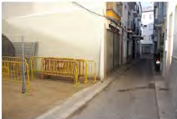
Carrer Sant Isidre de Roses

Els treballs suposaran la reurbanització d'un total de 2.697 m2. Iniciant-los a la cruïlla entre els carrers Joan Badosa i Sant Isidre, per continuar després al llarg de tot el carrer Sant Isidre, el que concentra una major presència de comerços, i seguiran avançant per la resta de carrers inclosos en el projecte, Joan Badosa, St. Pere Alt, Capellans, Porthos, St. Pere Baix i Palmerola.