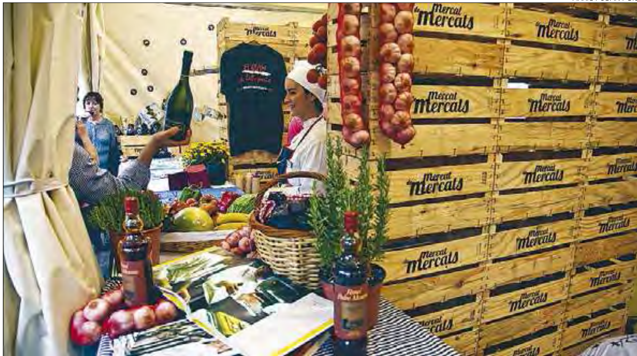
►► Un estand de l'edició de Mercat de Mercats d'octubre del 2012, a la plaça de la Catedral.