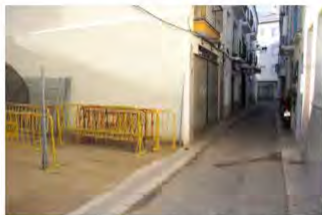
El carrer de Sant Isidre. AR

EMPORDA.INFO Aquesta setmana s'han iniciat a Roses les obres de renovació d'un nou àmbit de carrers del casc antic previstes pel Pla de Barris impulsat al municipi, les quals suposaran la reurbanització d'un total de 2.697 m2. Els treballs s'han iniciat a la cruïlla entre els carrers Joan Badosa i Sant Isidre, continuaran al llarg de tot el carrer Sant Isidre -el que concentra una major presència de comerços-, i seguiran avançant per la resta de carrers inclosos en el projecte (Joan Badosa, St. Pere Alt, Capellans, Porthos, St. Pere Baix i Palmerola).