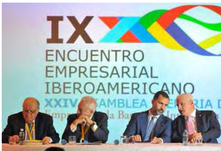
PANAMÁ. Intervención del Príncipe en el IX Encuentro Empresarial Iberoamericano.

En el acto también participó el ex ministro socialista Antoni Asunción, que abogó por la reforma electoral y resaltó que una democracia no es completa si los partidos no son democráticos. “Los partidos políticos son instrumentos de la sociedad y no cortijos ni empresas privadas”, añadió.