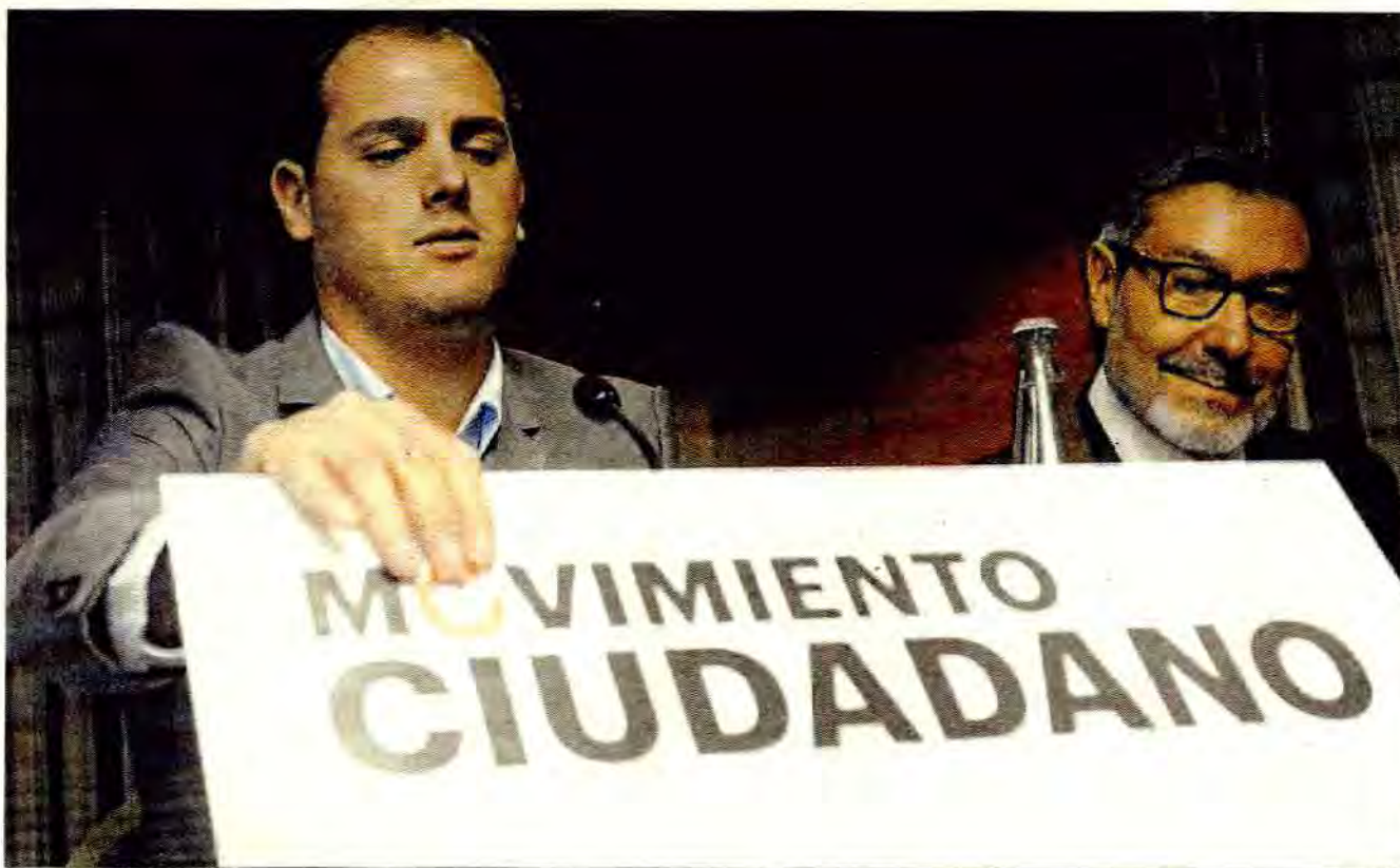
El líder de Ciutadans, Albert Rivera, amb l'exministre socialista Antoni Asunción

Per descomptat: l'eròtica del poder (castellana) i l'eròtica econòmica (catalana) són tòpics que la realitat social desautoritza constantment. Això no obstant, han tingut força influència en la caracterització de les societats respectives. Hauria estat més intel·ligent aliar ambdós caràcters. Barrejar intrepidesa i sentit comercial. Equilibrar gosadia i prudència. Compensar l'afany conqueridor amb l'ideal de l'estalvi. Però per facilitar l'equilibri o l'aliança calia repartir el poder. I aquest repartiment no ha estat possible. L'alta tensió actual respon descarnadament al repartiment del poder a Espanya. El rebesnét dels Esteve vol ser algú al món. I el descendent de Pizarro, marcant una nova línia a la sorra, ha contestat sense immutar-se: amb mi o contra mi.