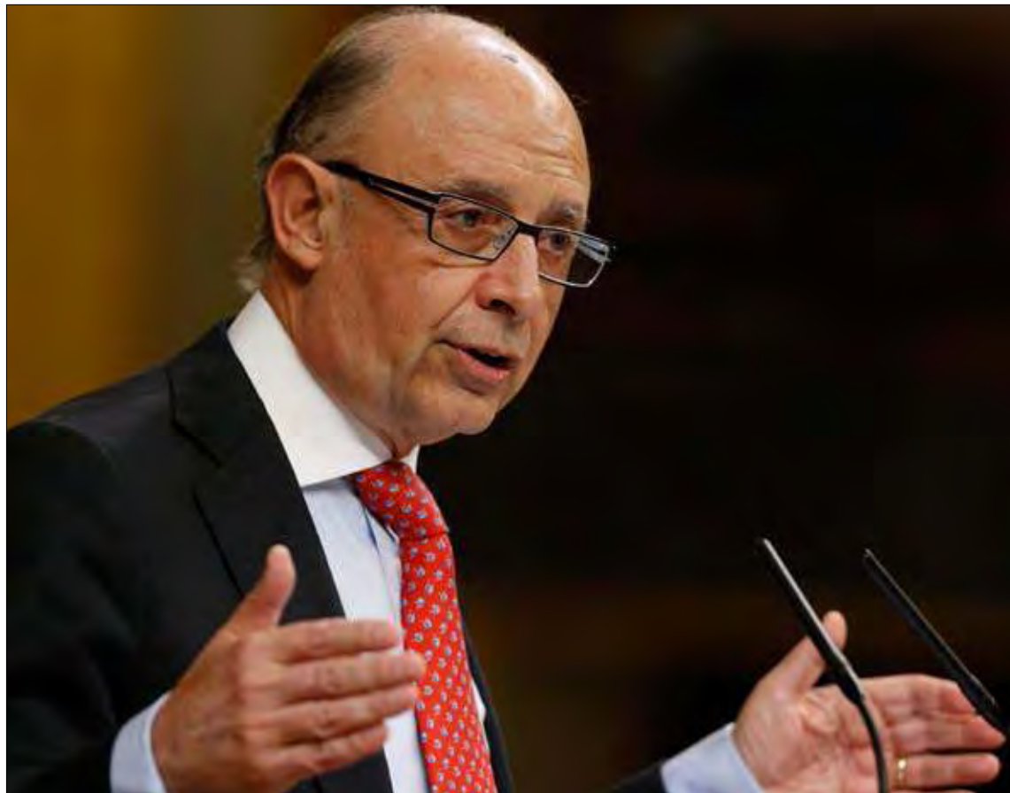
DEBATE. La reforma local prevé ahorrar unos 8.000 millones de euros hasta 2016 y conseguir una gestión local más ágil y eficiente.

Zarrías tachó el proyecto de “inconstitucional, tremendamente torpe y en muchos casos inaplicable” y reiteró la intención de su formación de llevar la reforma al Constitucional y de derogarla en cuanto accedan al Gobierno.