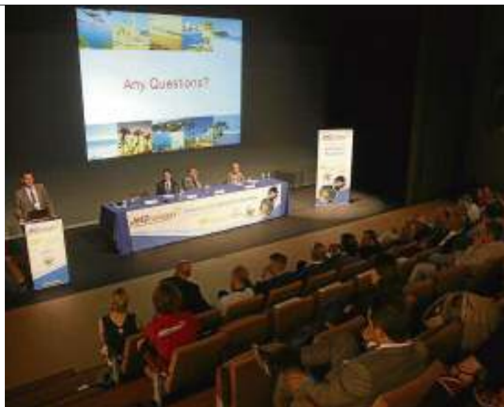
La presentació d'ahir de l'oferta de Jet2Holidays i NT Incoming.

Precisament, aquests dies els hotels d'aquesta població bullen amb les entrades i sortides dels turistes que hi passen les vacances. Un d'a-