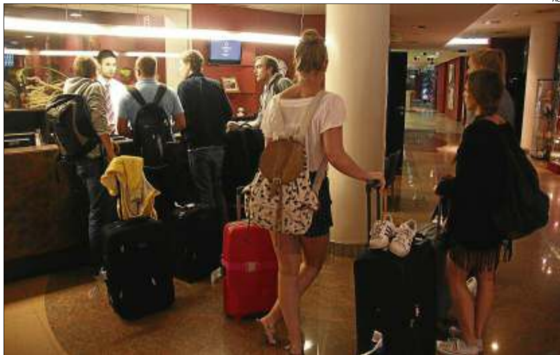
Un grup de turistes en un hotel de Lloret de Mar, per allotjar-s'hi i passar-hi les vacances.