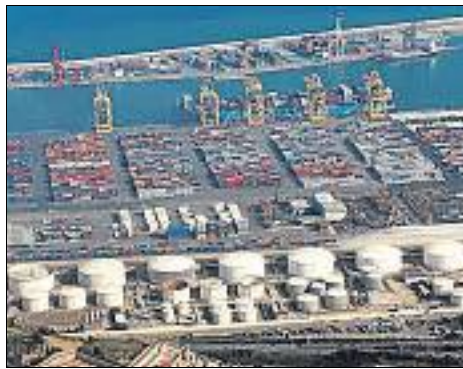
Vista del port de Barcelona

més per la llei– per a les naus de grans proporcions. Així, la instal·lació portuària preveu “captar el gran volum de càrrega que entra al país per via marítima i arribar al mercat d'influència en les millors condicions”, segons explica el president del port, Sixte Cambra. El port barceloní manipula anualment unes 500.000 tones de cereals, que es distribueixen a la indústria del pinso, de transformació i la farinaire, i disposa de