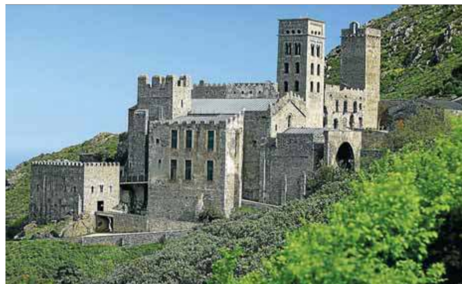
Imatge del conjunt de Sant Pere de Rodes, al Port de la Selva

La nova senyalització, que es presenta en quatre idiomes –català, castellà, anglès i francès–, es planteja en tres nivells. Primer, una senyalització de benvinguda i explicativa de l'oferta patrimonial; també una senyalització interpretativa dels elements més rellevants de cadascun dels tres monuments i del seu excepcional entorn natural, i finalment una senyalització direccional que facilita l'accés al poble de Santa Creu i al castell de Verdera.