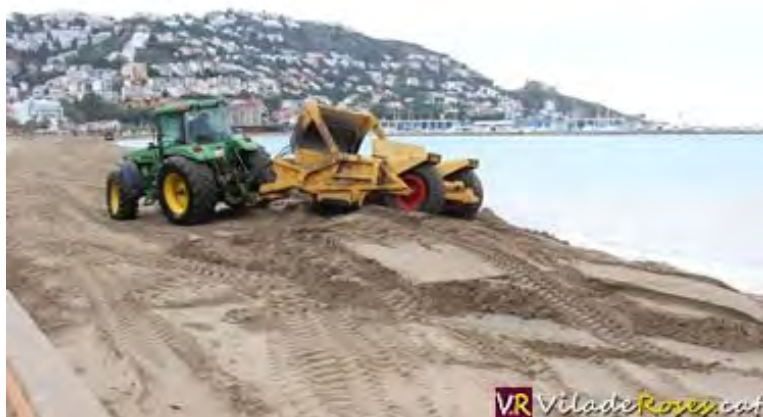
Un tractor amb una pala transportadora regenerant la platja de la Punta de Roses

El temporal de llevant sempre fa malbé les platges del litoral català. I Roses no és una excepció. Fa dues setmanes, per exemple, quan la Vila va patir el darrer, se'n va emportar, com ja és habitual, molta de la sorra en concret uns 25 metres de la platja de la Punta. Així, que l'Ajuntament va decidir, ara, regenerar-la, de sorra, “sí, perquè