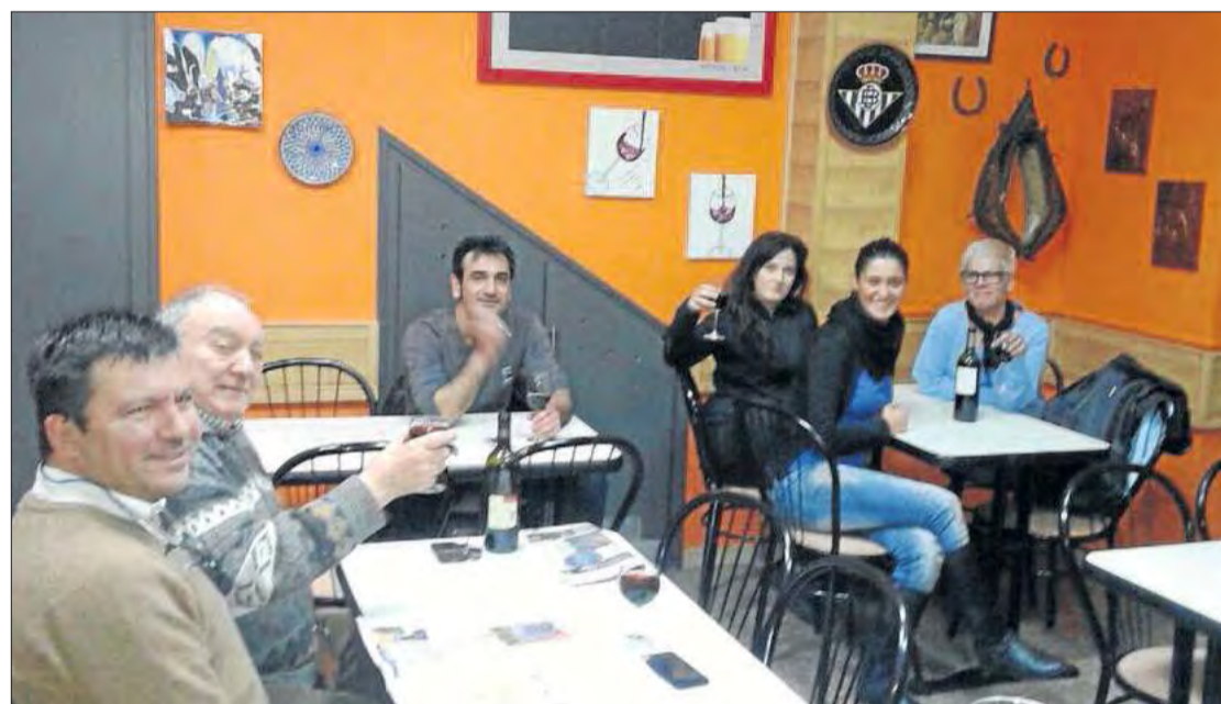
Una part de la zona de menjador de l'establiment.