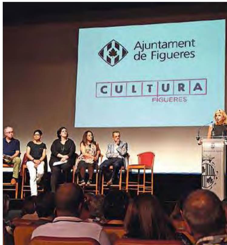
LA CATE. Un centenar de persones van assistir a la presentació cultural