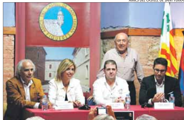
AMICS DEL CASTELL DE SANT FERRAN