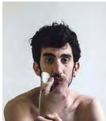
VALVERDE. Mostrant les agressions T.S.

El 5 de juliol passat es va celebrar el judici en el qual en Lluc