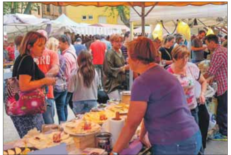
Tant matí com tarda, l'afluència de públic va ser molt gran. BORJA BALSERA

Per primera vegada, la Fira de Lladó incloïa un concurs de formatges, que van guanyar Formatges de Muntanyola (Voll Reserva) en la categoria de cabra; Formatgeria Can Pujol (El Ros) en el d'ovella i Formatgeria Reixagó (Reserva Madurat), en el de vaca. Els premis, otorgats per un jurat de tretze especialistes, ja es van concedir a primera hora, la qual cosa va incrementar l'atenció del públic envers aquests productes. "La gent ho va tenir en