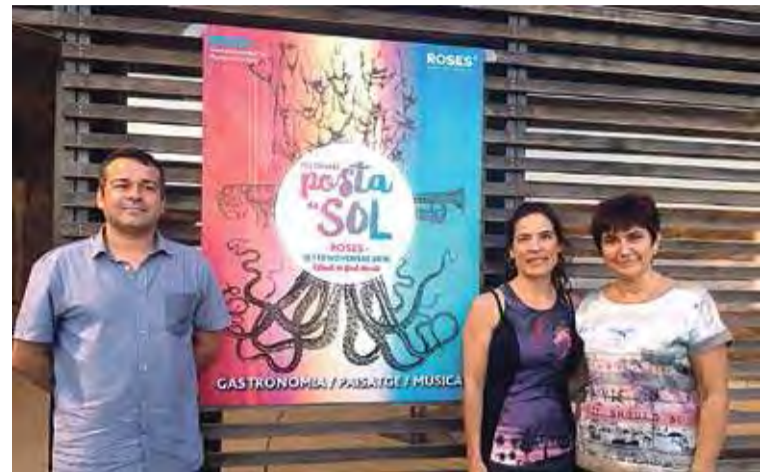
PRESENTACIÓ. El regidor de Promoció i Turisme, la productora i l'alcaldessa de Roses

■ L'Ajuntament de Roses organitza, amb la col·laboració d'Atelier-Esdeveniments, el Festivalet Posta de Sol. Tal com va fer l'any passat amb la promoció de la Ruta de les Tapes, enguany el consistori ha volgut apostar per la tardor, coincidint amb l'Estiu de Sant Martí, per organitzar un festival diürn de música i gastronomia on part del protagonisme serà per al paisatge de la badia. El cap de setmana del 12 i 13 de novembre hi haurà concerts en dos espais diferents durant tot el dia. Els dos escenaris seran a la plaça de les Botxes i la platja de la Perola de