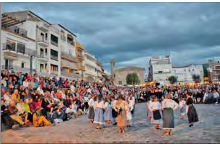
Centenars de persones van seguir les danses. ROBERT CARMONA