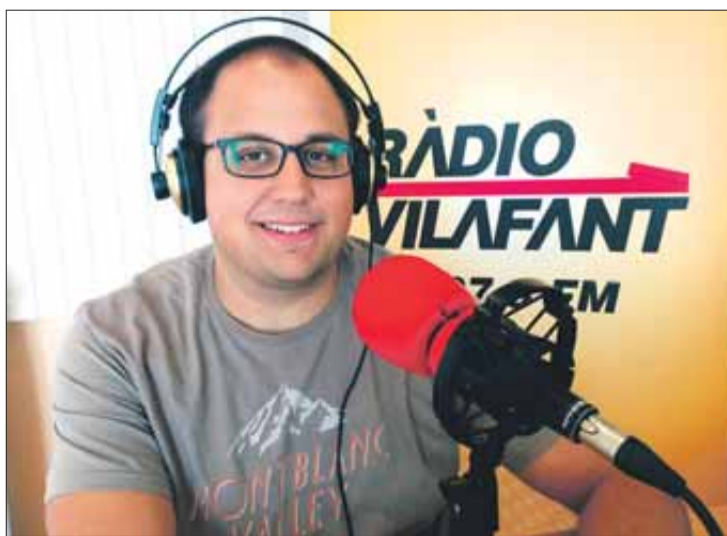
L'equip de professionals que treballa al programa. EMPORDÀ