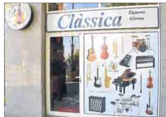
Grup Vivaldi ofereix un ampli assortit de productes musicals. EMPORDÀ