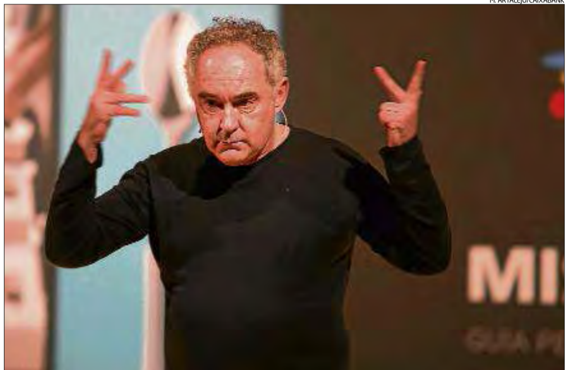
Ferran Adrià en plena acció, ahir, a l'Auditori-Palau de Congressos de Girona.

Vestit de negre rigorós, amb un micròfon sense fils i a dalt d'un escenari d'estètica molt pròpia d'Apple, Adrià, el pare de l'anomenada «gastronomia molecular», la ment incomparable de verb tan dens com veloç, va fer una defensa a ultrança de la innovació: de producte, de processos, d'organització empresarial. Una manera de concebre el negoci –la vida– en la «societat kleenex», la de la dictadura de la immediatesa que imposen les noves tecnologies que Adrià, que acusa Internet de ser «el pitjor enemic de la innovació als res-