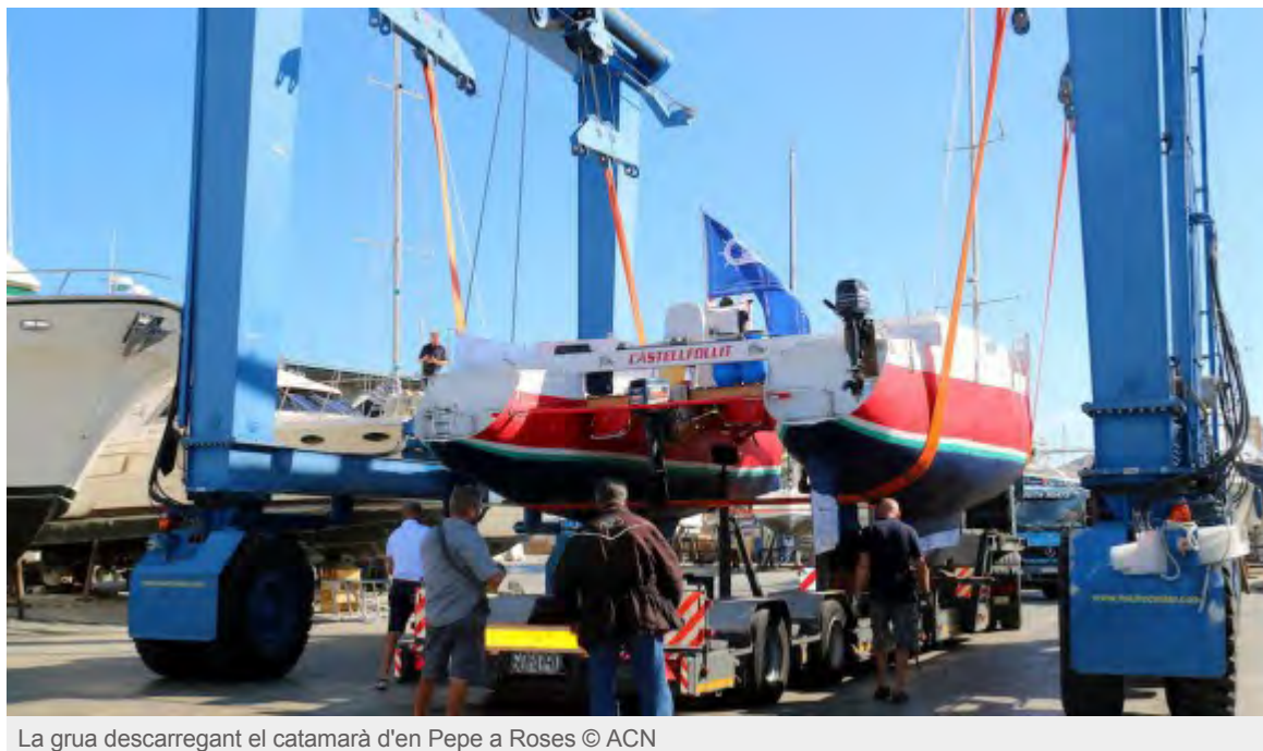
La grua descarregant el catamarà d'en Pepe a Roses

Una grua ha portat l'embarcació, que pesa gairebé quatre tones, fins a Roses