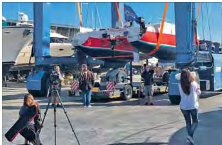
Les maniobres per moure el catamarà un cop a Roses. EMPORDÀ