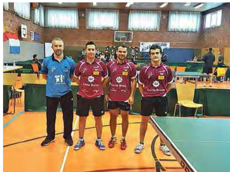
PARTICIPANTS. L'equip del CER no va poder donar la sorpresa a Luxemburg

INICI DE L'ESCOLA. D'altra banda, el club escalenc va iniciar ahir a partir de les cinc de la tarda l'escola per a nens i nenes a partir de sis anys. ■