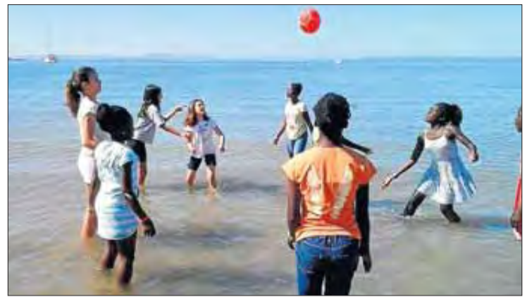
El Cor Safari ha visitat la comarca aquest estiu. SÒNIA FUENTES

Les jornades són gratuïtes i obertes a la ciutadania, per tal de