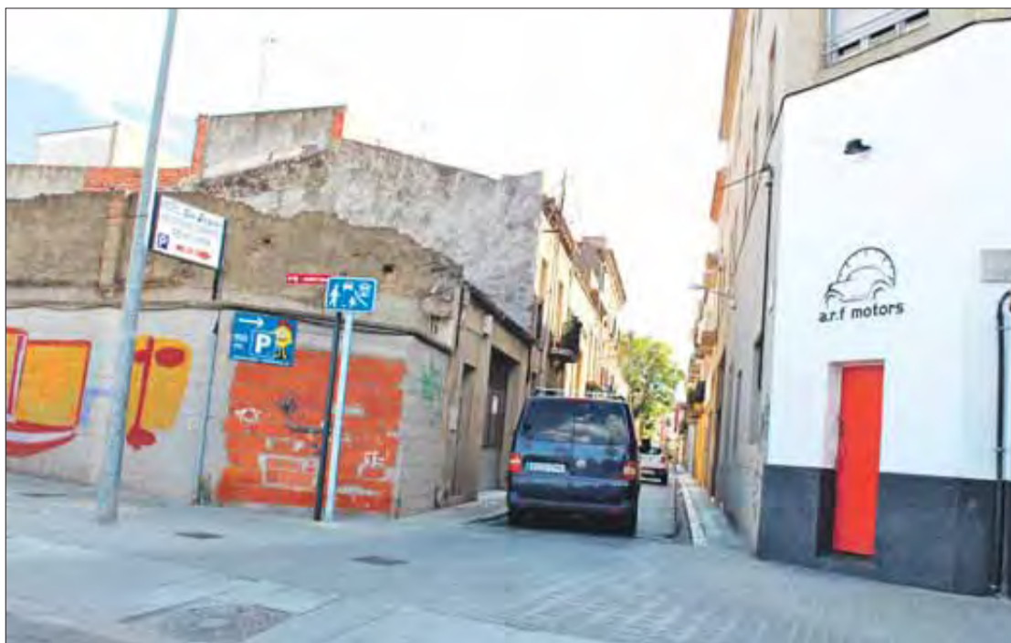
El carrer de La Barceloneta serà objecte d'un important canvi urbanístic. SANTI COLL

Aquest compliment permetrà a l'Ajuntament de Figueres la reactivació, aquest mateix any