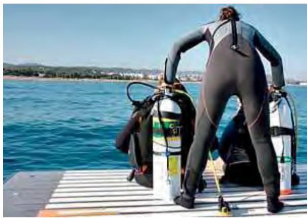
Dues alumnes es preparen per a una immersió ■ E.P.A.

Les bones xifres de les empreses de submarinisme han fet que la Costa Brava sigui capdavantera