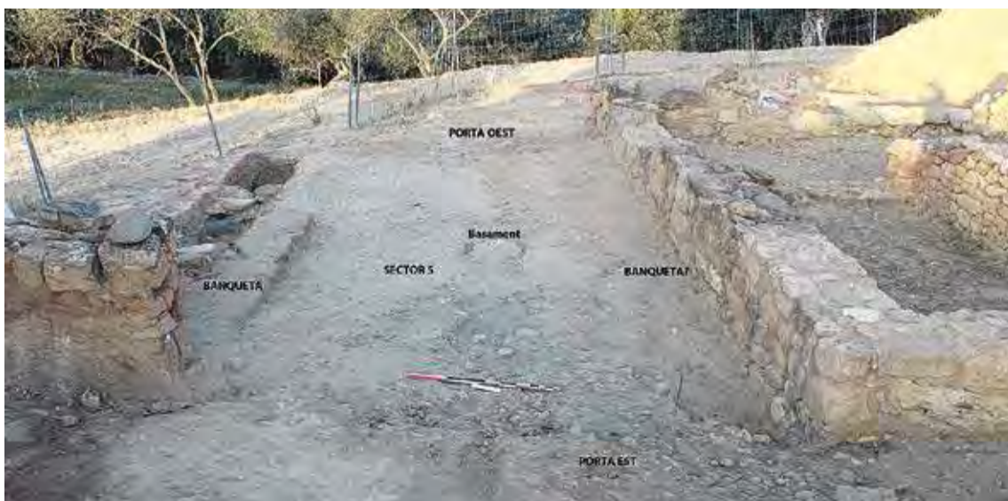
ESPAI PER A HOMES. També van trobar-hi moltes restes culinàries i de fauna, com ovelles i cabres