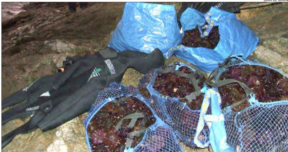
El material comissat al pescador il·legal al Port de la Selva.

► L'infractor, un ciutadà francès que ja té una denúncia per pesca sense llicència, va intentar fugir abandonant el material en una cova