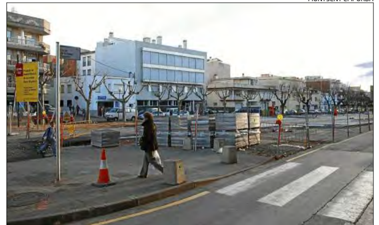
Les obres que s'han portat a terme a la Rambla Ginjolars.

► S'ha finalitzat l'adequació del vial central i començaran avui la segona fase amb la urbanització de voreres