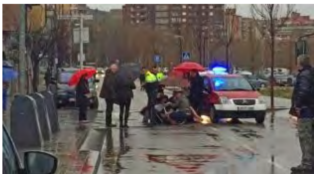
Els serveis d'emergències atenen la víctima el punt on es va produir l'accident

Roses , va ser atropellada ahir al matí per un vehicle en un pas de vianants del carrer Rec Arnau de Figueres. La jove, que inicialment va perdre el coneixement, va ser traslladada conscient a l'hospital, on va ingressar amb pronòstic reservat però on li van donar l'alta ahir mateix. L'accident va mobilitzar una unitat dels Mossos, Guàrdia Urbana i una ambulància del SEM. A la conductora del vehicle se li va practicar la prova d'alcoholèmia, que va donar negatiu. La principal hipòtesi és que la dona frenés però que, a causa de la pluja, el cotxe rellisqués fins a impactar amb la víctima.