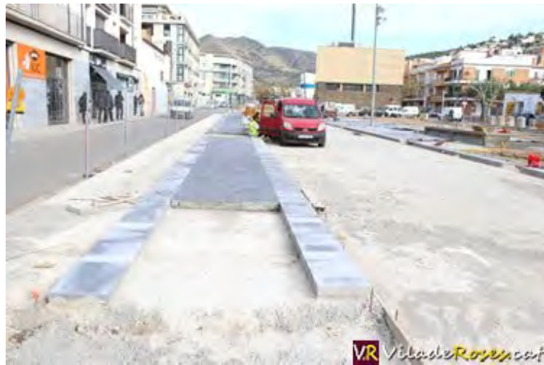
El tram de la Rambla Ginjolars entre els carrers Tarragona i Puigrom quedaran tallats a la circulació

Amb motiu de les obres d'urbanització que s'estan desenvolupant a la Rambla de la Riera Ginjolars de Roses, a partir de demà, dimecres 21 de gener, el trànsit rodat quedarà tallat en diferents punts de la seva àrea de confluència.