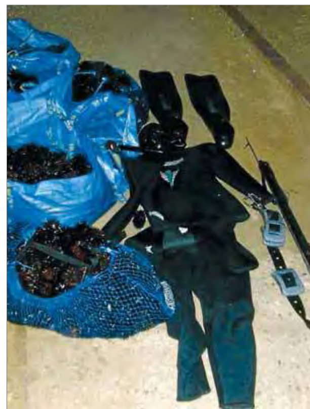
Material decomissat en la inspecció en què van detenir un pescador furtiu de garotes ■ EL PUNT AVUI

El projecte suposarà l'embelliment d'aquest important espai del centre de la població; alhora, comportarà la substitució i nova instal·lació de les diferents xarxes de serveis en aquest sector de la vila de Roses. ■