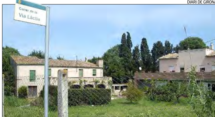
La societat està ubicada al carrer Via Làctia de Figueres.

Ho faran des de l'institut Ramon Muntaner, l'espai des d'on sempre