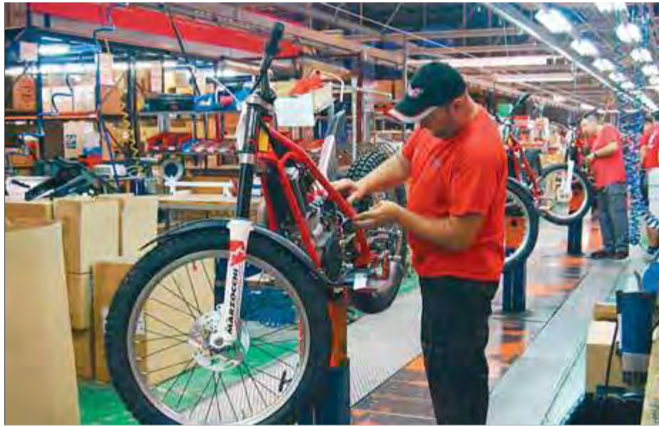
Treballadors de Gas Gas, a les instal·lacions de Salt, en una imatge d'arxiu ■ IMMA BOSCH

L'any passat, Gas Gas es va aliar amb Ossa per compartir instal·lacions, recursos tecnològics (en R+D+I) i xarxa comercial. Les dues marques comparteixen estructura productiva, tot i que de moment funcionen per sepa-