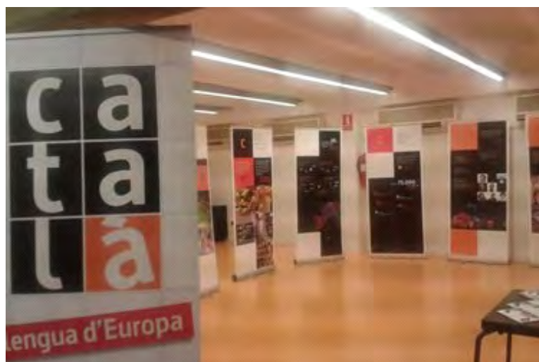
Exposició 'Català, llengua d'Europa' a la Biblioteca de Roses

L'exposició inaugurada ahir a la Biblioteca Municipal Jaume Vicens Vives de Roses mostra el català com a llengua d'Europa, moderna i oberta al món en diàleg amb altres llengües. Una exposició que està adreçada a tothom qui vulgui saber una mica més de la presència i la força del català avui a la nostra societat. Les escoles i grups de català, però, hi estan especialment convidats, atès que els continguts que presenta poden donar lloc a activitats i treballs específics sobre la llengua catalana i la seva situació en el marc europeu.