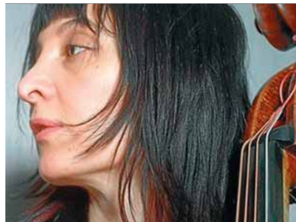
Giulia Valle

Els dies 7, 8 i 9 de juny tindrà lloc al port de la Clota de l'Escala el primer Jazz al Port, organitzat per Octopuss Tapes & Music Club, que ara dirigeix Rosa Galbany. Jazz al Port es presenta com la llavor d'un nou festival de jazz a l'Escala, que comença aquest any tímidament, però amb voluntat de consolidar-se i de buscar un cert reforçament institu-