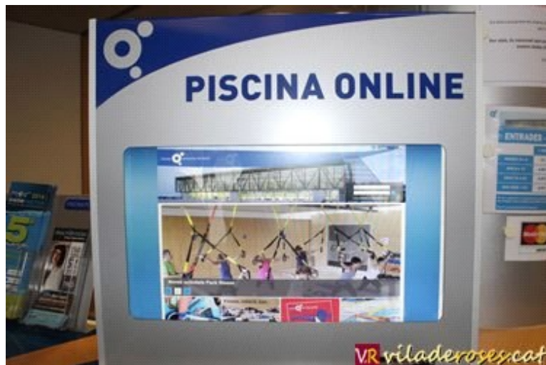
Ordinador tàctil per fer les reserves ubicat a la recepció de la piscina

Des del seu inici, el servei ha gestionat un total de 12.987 reserves online , i l'enquesta realitzada entre els seus usuaris reflexa que un 85% dels enquestats prefereix el nou sistema en línia a l'anterior presencial.