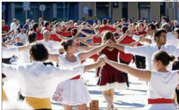
L'activitat sardanística segueix molt present a la demarcació.

El primer concurs de la Final A per a aquestes colles serà el diumenge 13 de setembre, a Tarragona, a les 6 de la tarda. Després hi haurà les cites de la Catedral de Barcelona (20 de setem-