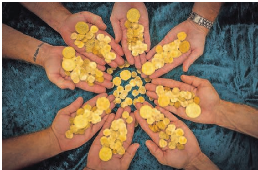
Parte de las monedas de oro hispano recuperadas del Caribe que llevaban 300 años sumergidas.

La firma de cazatesoros tiene identificados ya siete de los once navíos y, según reconocen desde Queens Jewel, todavía hay más riquezas del naufragio bajo las aguas. La importancia del descubrimiento viene dada por lo inédito de algunas de las piezas de oro, concretamente las que hacen alusión al rey. Su valor numismático es enorme, pues cada una puede llegar a tener un precio en el mercado de más de 200.000 euros. En el mundo solo existen poco más de una veintena semejantes. Corresponden a una etapa en la que España estaba en guerra por la Sucesión al trono, enfrentado principalmente entre los valedores de la dinastía borbónica y los de la rama austríaca. Finalmente se impuso Felipe de Anjou, pero el monarca no pudo disfrutar de los beneficios que traía la expedición comandada por La Capítana . El temporal fue tan virulento que en el océano dejaron la vida más de 1.000 hombres que viajaban en la flotilla.