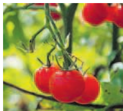
El tomate se une al marisco como dañino para la gota.

Científicos nipones han creado un robot de rescate que detecta el olor humano en zonas de desastre donde pudiera haber personas atrapadas. Los investigadores usaron la habilidad de los mosquitos para distinguir el olor de la sudoración para crear un pequeño sensor en un dron no tripulado o similar. A diferencia de los perros, estos robots podrían permanecer más tiempo en el foco de rescate. AFP