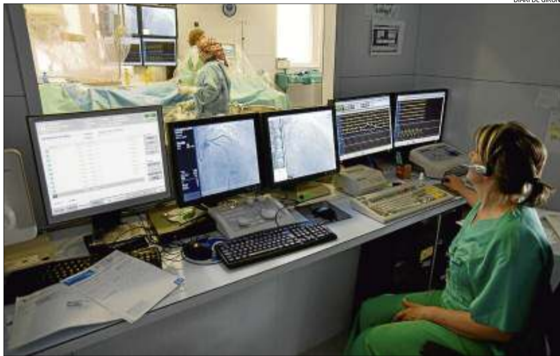
L'equipament d'hemodinàmica actual de l'hospital Trueta va ser adquirit el 2004.

No només serà la imatge l'única millora. També irradiarà menys que l'aparell actual, aspecte que és un clar avantatge tant per als pacients com per als professionals. Un altre guany per a tots els metges de la unitat és la connectivitat d'aquest nou aparell d'hemodinàmica amb altres equipaments de l'hospital gironí, que facilitarà en gran mesura la visualització de les proves d'imatge realitzades per