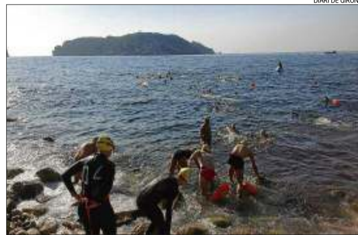
Imatge d'arxiu dels participants del segon Non Stop entrant a l'aigua.

El tret de sortida del Non Stop de demà serà a la Via Brava de Platja d'Aro, a 2/4 de 8 del matí, i es calcula que finalitzarà a Roses al voltant de les 6 de la tarda. La tornada es farà amb autobús a s'Agaró, cap a 2/4 de 8 del vespre. La diferència entre el NonStop d'a-