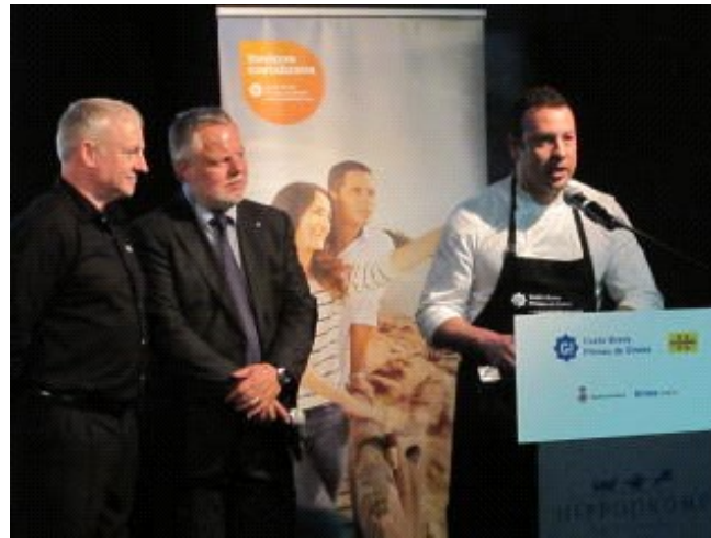
Representants del Patronat a Tolosa PTCBG

Aquest dimarts dia 20 de maig, el Patronat de Turisme Costa Brava Girona va portar a terme a la ciutat francesa de Tolosa de Llenguadoc una doble acció promocional i comercial que es va iniciar amb un workshop entre una trentena d'empresaris gironins, especialment del sector de l'allotjament, de les activitats i del turisme de negocis, i una cinquantena d'agents de viatges i empreses organitzadores d'esdeveniments i viatges d'incentius franceses. A la sessió de reunions i intercanvi entre professionals gironins i francesos, va seguir una presentació de la destinació adreçada als agents de viatges i la premsa francesa que hi van assistir, que va donar pas a un sopar gastronòmic a càrrec del restaurant Les Magnòlies, d'Arbúcies, amb una estrella Michelin.