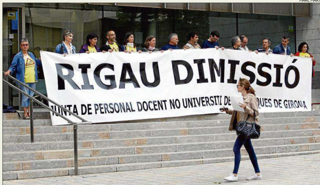
La pancarta que els representants de la Junta de Personal Docent van desplegar ahir a la Generalitat.

Demà divendres, 23 de maig, les dependències de la Diputació de Girona (pujada de Sant Martí, 4-5) romandran tancades.