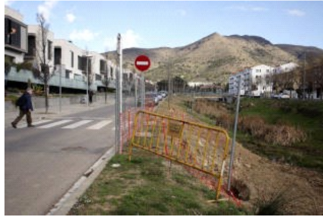
La zona on s'instal·la el pont. MONTSENY

La passera evitarà als veïns de la zona i a als usuaris i escolars dels centres educatius propers, haver de fer un recorregut més llarg per travessar la riera.