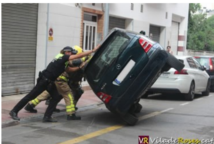
Els Bombers i la Policia Local de Roses posant el cotxe sinistrat sobre les seves quatre rodes

el Mercedes s'enlairés, i anés arrossegant uns 20 metres fins a l'altre extrem de la calçada, on ha topat contra un Peugeot 308.