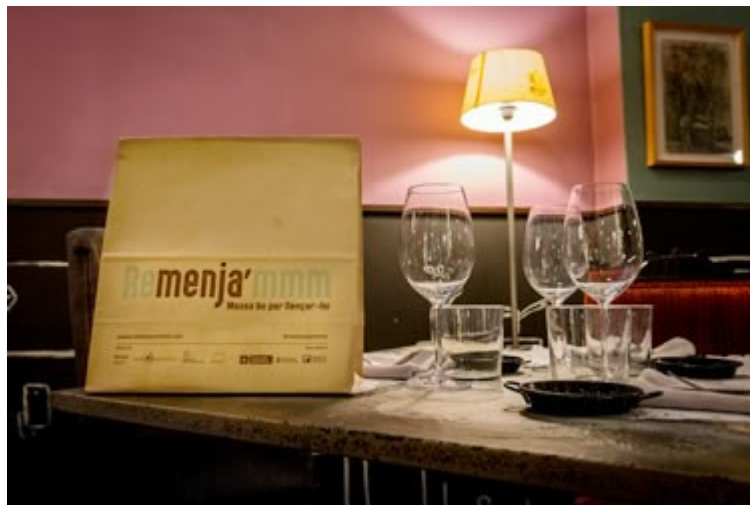
En aquesta taula la bossa que s'oferirà als comensals per emportar-se cap a casa el menjar que els ha sobrat

Entre un 4 i un 10% dels aliments que entren a un restaurant acaben a les escombraries. És a dir, es produeix un malbaratament alimentari. Però, no només es deu als excedents que es poden produir durant l'elaboració dels plats a la cuina, sinó que també, i en una gran part, quan el menjar ja és taula, i els comensals no s'ho mengen tot.