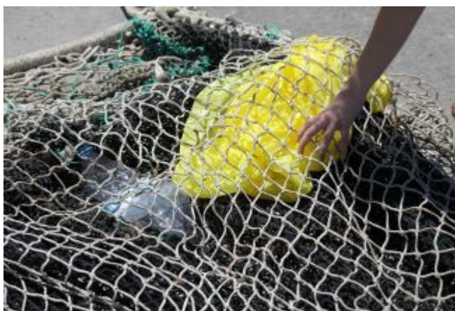
Pescadors de Roses , Llançà i el Port de la Selva contribueixen en el projecte. Gerard Blanché

Fa uns dies els mitjans ens sorprenien amb una preocupant notícia. A l'oceà Pacífic, s'ha creat una illa de plàstics que equival a la superfície de França, Espanya i Alemanya juntes. El gran parc de brossa del Pacífic, tal com es coneix aquesta acumulació de residus, aplega 1,8 milions de peces de plàstic que pesen 80.000 tones. Una situació no només preocupant sinó també difícil de resoldre.