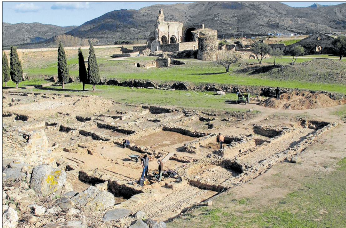
La vila medieval de la Ciutadella de Roses serà el principal escenari del curs d'arqueologia.