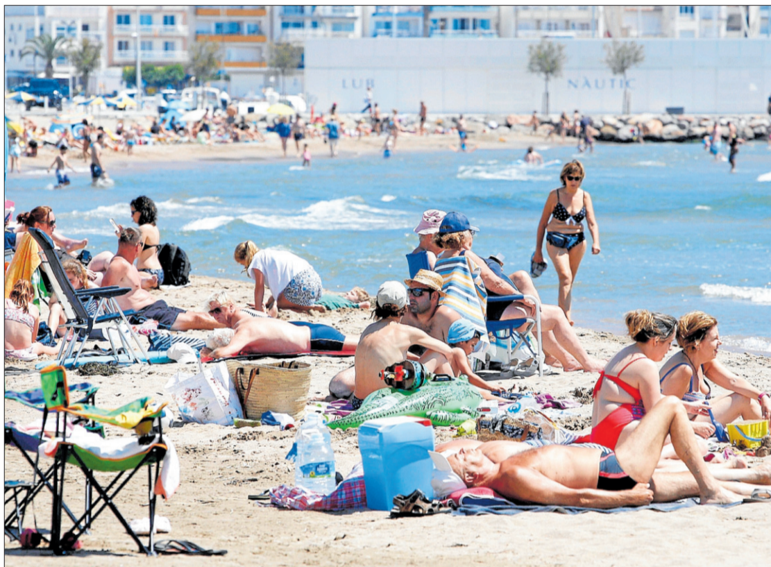
Les platges estan a punt i ja fa dies que estan plenes, com la de l'Estartit. MARC MARTÍ

Les màximes d'ahir registrades a les comarques gironines també es van enfilar de valent. A Girona ciutat per exemple, es van arribar als 32,4 graus i a indrets com Castelló d'Empúries on la nit va ser tropical, el termòmetre va assolir els 32,7 graus. A Cruïlles, el mercuri