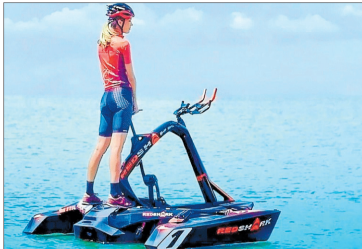
El trimarà aquàtic, una invenció empordanesa. RED SHARK BIKES

Ara hi torna amb l'inèdit trimarà aquàtic. La proposta ha arribat de la mà de l'empresa Red Shark Bikes, que té un centre tècnic de desenvolupament al port esportiu de Roses. A finals de mes de juny, les instal·lacions ja podran mostrar el trimarà, que a dia d'avui ja té més de 200 peticions de compra i s'està preparant el repartiment de les primeres unitats. El trimarà és un vehicle flotant molt estable que està integrat per tres cossos: un casc central, que és el més important i el que permet expulsar l'aigua cap a l'exterior, i dos estabilitzadors laterals que es mouen gràcies a la força de l'esportista.