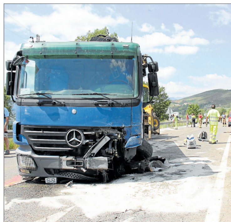
El camió implicat en l'accident mortal a l'N-260 a Isòvol amb efectius d'emergències i de neteja de la via al darrere.

Aquest sinistre viari s'ha produït cinc dies després que una dona perdés la vida en un accident de trànsit a Torroella de Fluvià. En aquest cas, l'accident mortal va ser un xoc frontal entre dos turismes a la C-31. Dues persones més van quedar ferides, una en estat greu, i l'altra menys greu. Des d'inicis d'any han mort 18 persones en accidents de trànsit a les comarques gironines en tot tipus de vies.