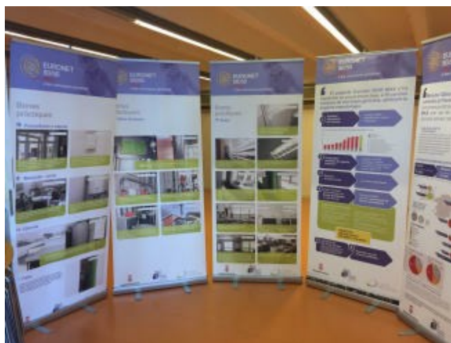
La mostra sobre el projecte 50/50 d'estalvi energètic a les escoles EMPORDA.INFO

Fins al 13 de juliol, l'espai Z de la Biblioteca Municipal de Roses acull l'exposició "Euronet 50/50 MAX a les comarques gironines", una mostra que difon el resultat del projecte que s'està realitzant a 10 escoles gironines per reduir el consum energètic als centres, aplicant bones pràctiques en l'ús i la gestió de l'energia.