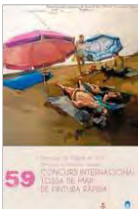
Una imatge del cartell del concurs