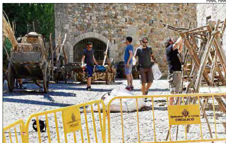
El carrer d'entrada als Banys Àrabs acull elements d'attrezzo.

hi havia tanques impeding el pas i es va retirar mobiliari urbà. En paral·lel, la productora HBO està negociant amb cinc establiments que hauran de tancar alguns dies. ► 3