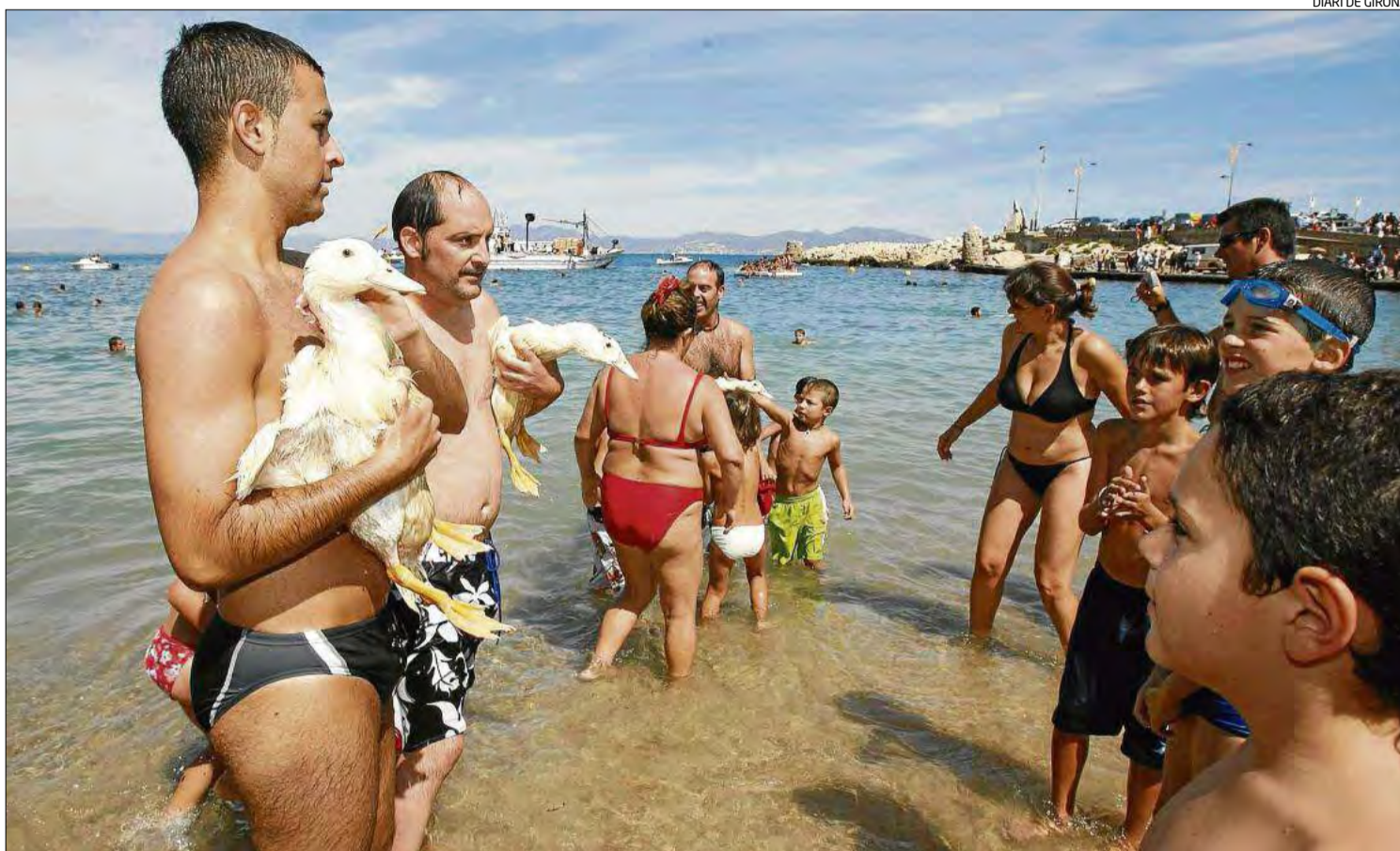
Una de les edicions de la celebració al municipi, en una imatge d'arxiu.