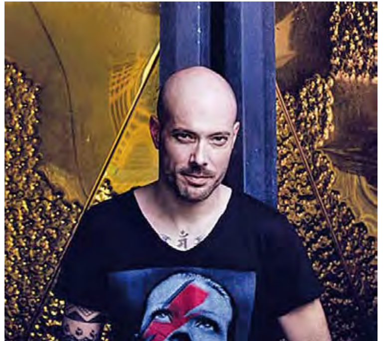
OSCAR AGUILERA. Un dels DJ més reputats de l'escena estatal