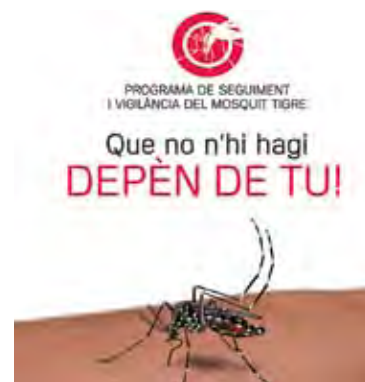
IMATGE. Tríptic informatiu. HORA NOVA

pals zones afectades del municipi. Entre les mesures adoptables es troben eliminar els objectes que puguin acumular aigua; tapar hermèticament els dipòsits d'aigua per regar; posar sota cobert barques, carretons o remolcs, o bé posar-los cap per avall o tapar-los; eliminar els pneumàtics vells; posar peixos vermells a les basses ornamentals i fonts del jardí perquè es mengin les larves dels mosquits; netejar de fulles les canaleres de teulats i terrasses; i, finalment, buidar l'aigua embornals i de-