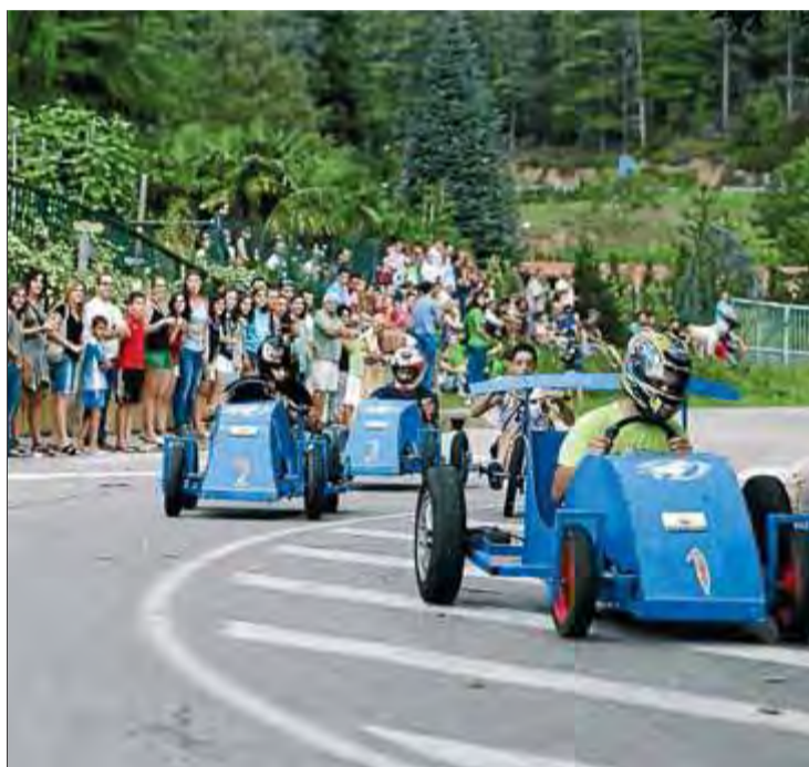
Una imatge de la baixada de carretons de la festa major de Sant Hilari de l'any passat. L'acte es repetirà dissabte a la tarda

Sense animals, la festa de Sant Hilari comença dijous. El Cor Lutiana, participant en el programa Oh happy day , de TV3, serà l'encarregat de fer el pregó, dijous a la tarda (a 2/4 de 7), a la plaça de l'Església. A banda del pregó, les Lutianes tancaran diumenge a la nit (a les 10) la festa major amb un