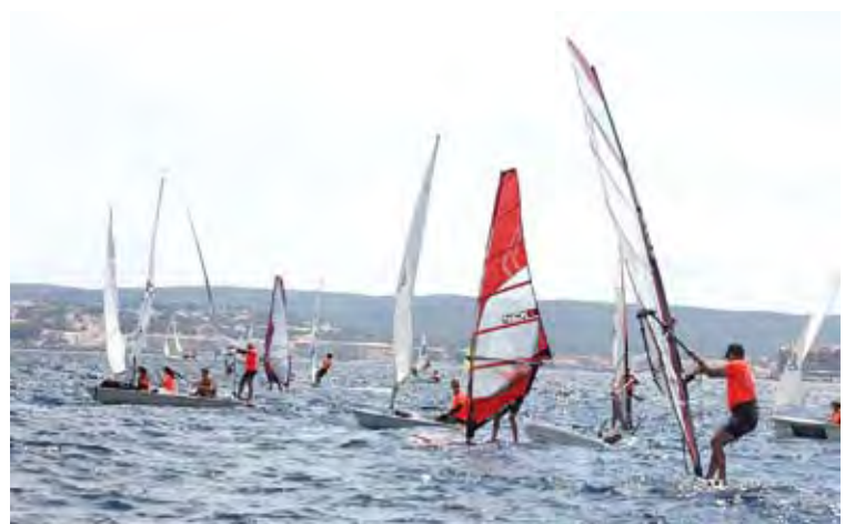
BONA PARTICIPACIÓ. La travessia va aplegar gairebé 200 navegants