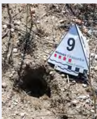
FORATS. Les proves del delictes.

ciutadana va localitzar un vehicle estacionat prop d'un camí de sorra que porta al jaciment arqueològic. Els agents van identificar els detinguts que carregaven dos detectors de metalls, pics, lots de miner i monedes, fíbules i objectes metàl·lics. Els policies van poder comprovar que els objectes eren d'època iber i medieval i s'havien extret del subsòl de les ruïnes. La parella va ser detinguda per un delictes contra el patrimoni històric i un altre de furt. ■