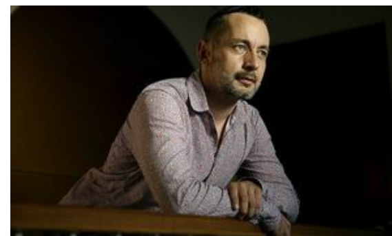
L.F. Gais i bisexuals a la recerca d'espai