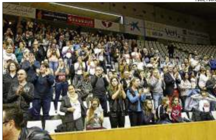
L'afició de Fontajau aplaudint les jugadores de l'Spar Citylift Girona.

Per al partit d'aquest cap de setmana l'Spar Citylift també convidarà els abonats dels clubs que, com l'Uni, formen part del projecte ADN Gironí (Girona FC, Girona CH, CEB Girona i CPA Girona). Només caldrà mostrar a la taquilla el PasSport que entrega cada entitat als seus associats i que cal activar al web d'ADN gironí per accedir a una localitat gratuïta. A falta de quatre partits pel final de la primera volta (Añares Rioja,