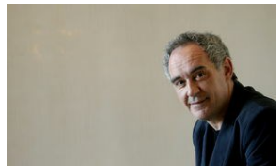
Ferran Adrià: "La cuina és un ofici duríssim"