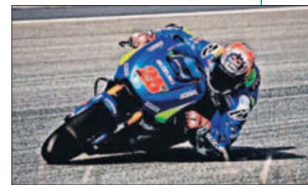
Maverick, en Sepang.

Las grandes novedades en la GSX-RR fueron la electrónica unificada que montarán