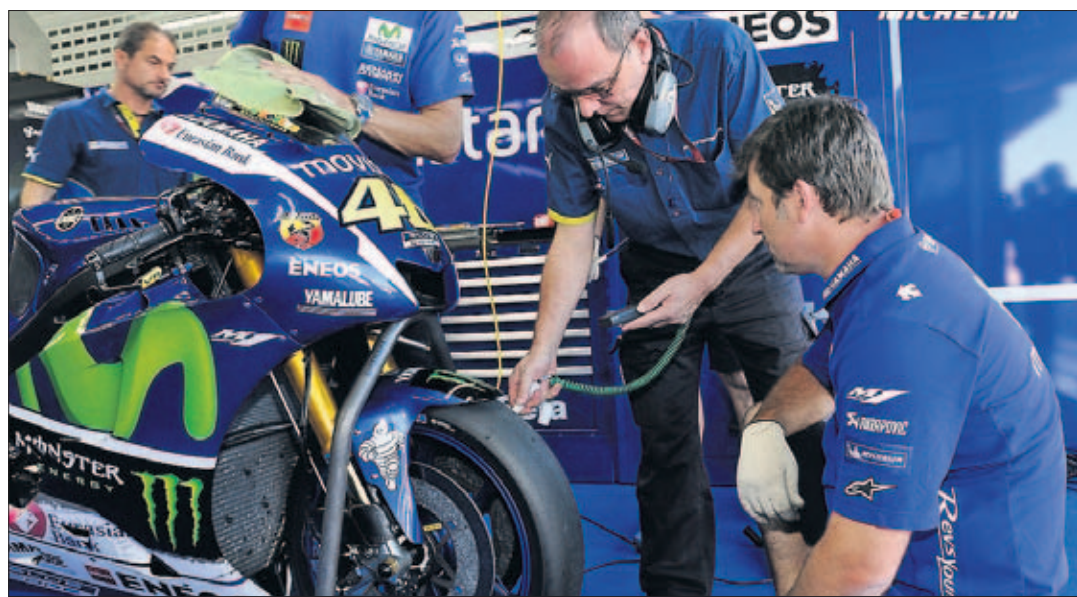
EN PRUEBAS. Los pilotos de MotoGP tratan de acostumbrarse a los nuevos Michelin para 2016.

Trasero "Nos centraremos en adaptarlo a las distintas condiciones"