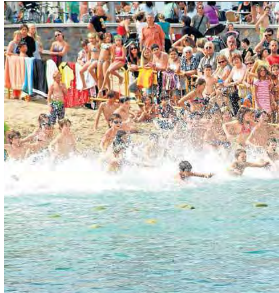
El Festival Nàutic és un clàssic que atrau a desenes de participants cada any.

Aquesta prova és el colofó del Festival Nàutic, integrat per diverses activitats a l'aigua per a nens i joves de diferents edats. El Festival es farà el dimecres 2 de setembre, a la Platja, on els participants es podran inscriure. Prèviament, tindrà lloc, també a la Platja, un dels actes més di-