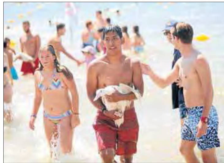
Participants a l'empaitada d'ànecs d'aquest any. ROSANA VIDAL

El Consell d'Europa estableix que els ànecs no han de ser utilitzats en espectacles, atès que el soroll, la proximitat a l'ésser humà, el fet que el seu medi na-