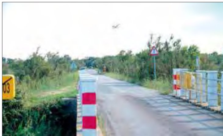
La carretera de la discòrdia que travessa els Aiguamolls. BORJA BALSERA

En primer lloc, la Iaedn assenyala que l'ampliació de la carretera no està justificada perquè en el projecte es parla "d'elevada sinistralitat i accidentalitat" sense donar cap xifra concreta al respecte ni s'estudien alternatives viables, més enllà de l'ampliació, per reduir la sinistralitat. Al mateix temps, des de l'associació asseguren que en el document presentat per la Diputació de Girona es mostra com la intensitat