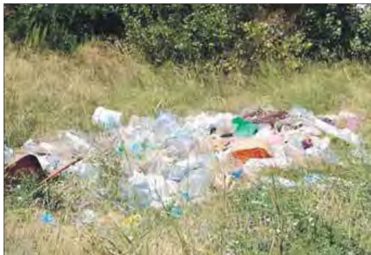
La brossa acumulada al solar on hi ha la plaga de mosquits. EMPORDÀ

Els veïns del carrer han fet arribar un escrit a l'alcaldia de Figueres i també al Síndic de Greu-