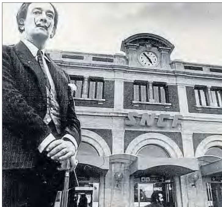
Dalí davant la vella estació de trens batejada per ell mateix com el Centre del Món; a la dreta el monòlit.

da el viatge festiu i simbòlic entre Ceret i Perpinyà que Dalí va protagonitzar, acompanyat del teòric de l'antigravitació Marcel Pagès. El monòlit, fet amb planxa cortex, inclou una placa amb el text següent del periodista Josep Playà: "va ser un happening surrealista des del bressol del cubisme, desenvolupat per Picasso i Braque, fins a l'estació de Perpinyà, que aquell mateix any Dalí havia batejat com el centre del món". La inauguració d'aquesta obra no serà l'única aportació dels Amics, ja que també han cedit els gegants de Dalí i Gala per-