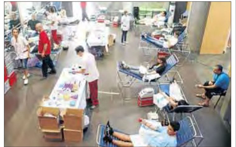
Imatge de la marató que es va fer a Roses l'any passat.

L'any passat, a Figueres ja es va fer una marató de donants. Els resultats van ser una mica més fluixos dels que s'esperava reco-