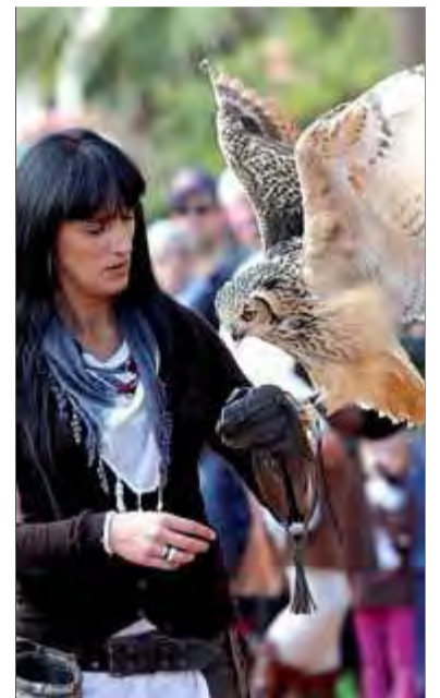
Una au de la fira a Lloret