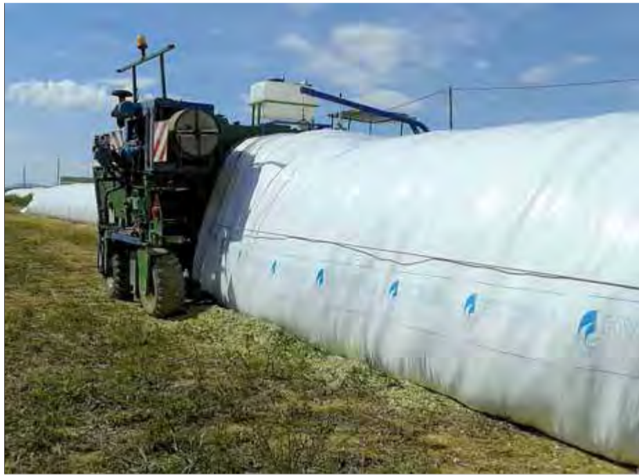
La màquina d'empaquetar pinso permet treure els vells pneumàtics dels camps ■ EL PUNT AVUI

Els pneumàtics, recorden des del servei, són una font idònia de propagació del mosquit tigre, ja que l'aigua del reg o la pluja s'hi diposita i les larves hi troben un bon hàbitat per desenvolupar-se amb absoluta tranquil·litat. Amb el nou sistema, en canvi, el pinso per alimentar el bestiar durant l'hivern s'introdueix dins d'un gran paquet de plàstic continu