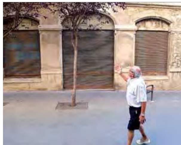
L'edifici de la sala Edison, al carrer Sant Pau de Figueres, en una imatge recent

Actualment aquest edifici fa 31 anys que està tancat i la situació cada vegada és més greu a causa del seu deteriorament pro-