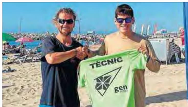
Els dos nous monitors del GEN Roses. EMPORDÀ

i, fins i tot, els pot produir estats de pànic, tenint en compte que els ànecs domèstics han conservat un gran nombre de respostes davant dels depredadors, com la immobilitat, els crits d'alarma, les temptatives de vol o de fugida ràpida del perill i el fet de debatre violentament si se'ls atrapa.