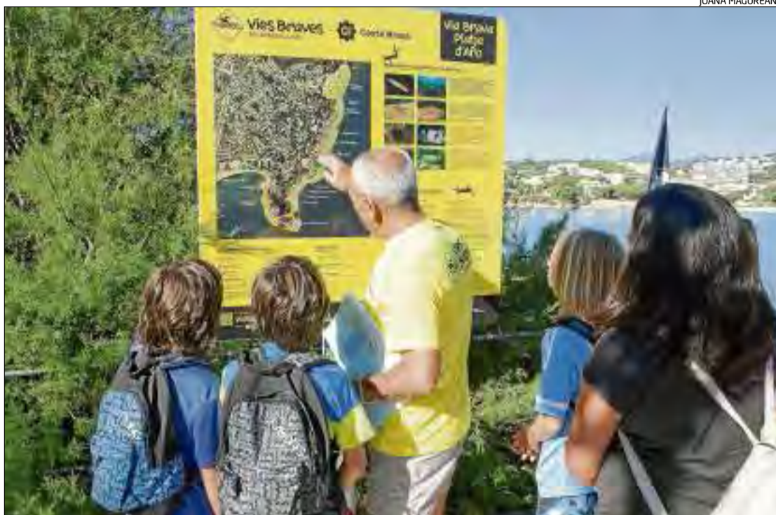
Un cartell de les Vies Braves a la zona del camí de ronda de Sant Pol a sa Conca.

tiva publicoprivada pionera que promou el territori com a destí turístic per a la pràctica de la natació d'aigües obertes i la immer-