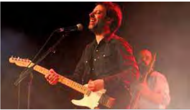
Mazoni actuarà en el gran aparador musical de Figueres ■