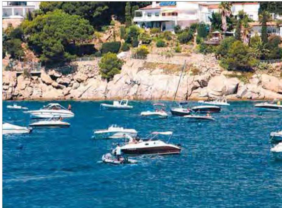
L'embarcació que controla el fondeig a les cales del municipi de Roses aquest estiu, en una imatge d'ahir

regulat els punts de fondeig que els navegants poden usar pagant un lloguer. En total s'han instal·lat 187 boies repartides en set camps de boies a Canyelles Petites, Bonifaci, l'Almadrava, Montjoi, Calitjàs, Pelosa i Jóncols, la major part de les quals, a les tres cales urbanes. A cada lloc, els espais de fondeig s'han adaptat i s'han dimensionat en funció de