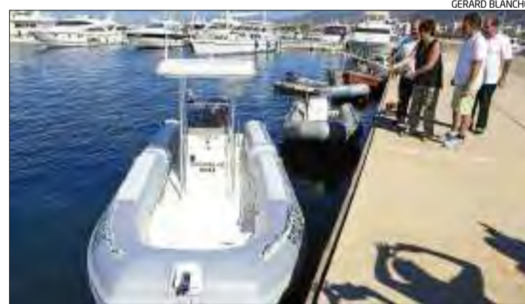
L'alcalde fent el «bateig» de la barca de control.

■ El port de Roses va fer ahir al matí el «bateig» de l'embarcació que ha adquirit per fer el control i seguiment de nou sistema de fondeig implantat a finals de juny al municipi. L'Ajuntament de Roses ha inclòs al Pla d'Usos de Platges l'establiment dels anomenats campes de boies , amb els qual s'han regulat els punts de fondeig que cada espai posa a disposició dels navegants, que en poden fer ús a través del lloguer. En tota, s'han instal·lat 187 boies repartides en set