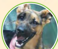
· Yaqui ·