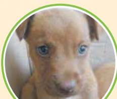
· Un ·