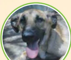
· Nesky ·