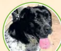
· Runa ·