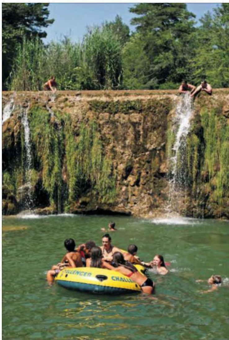
Bañistas en la riera de Merlès (Berguedà).