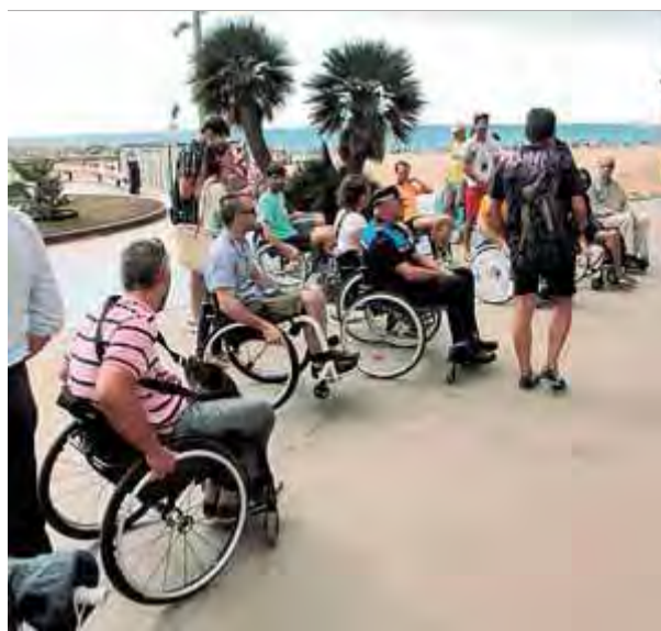
L'expedició en cadires de rodes d'ahir a Sant Antoni ■ E.A.

Durant el recorregut, el seguici en cadires de rodes va passar pels jocs infantils adaptats al passeig marítim o els punts d'informació al visitant llegibles en braille , igual que la guia turística editada en el mandat anterior. Carbonell i els responsables de Mifas van fer notar que hi ha assignatures pendents en molts establiments privats, sovint amb esglaons per accedir-hi o sense lavabos adaptats. En aquest sentit, van proposar incentivar fiscalment