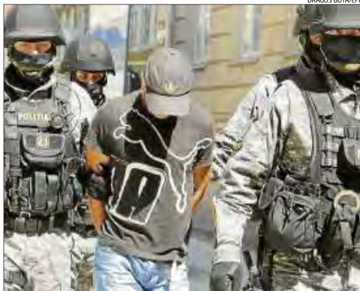
Morate anant cap al jutjat en una de les compareixences

pitós serà traslladat a Espanya durant els següents deu dies.