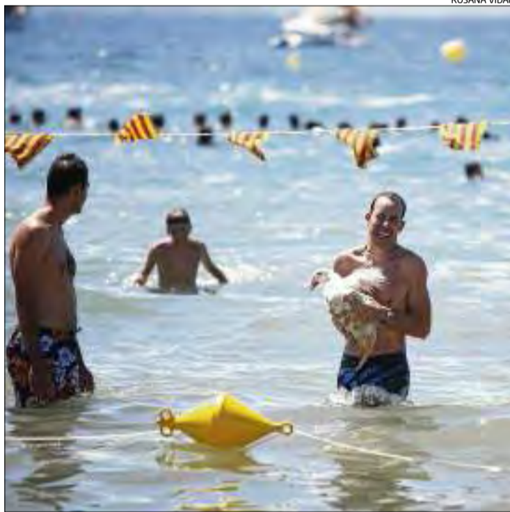
L'empaitada d'ànecs de Roses d'aquest any.

L'ONG va presentar la denúncia administrativa aquest dimecres en què demanava l'obertura d'una investigació per identificar l'autora de l'agressió també que s'obri un expedient sancionador a «tots els que resultin responsables de la infracció, per acció i omissió, inclosa la persona agressora, l'entitat organitzadora -l'Associació Amics de les Festes i Tradicions de Roses- i, si s'escau, a l'Ajuntament de Roses». Consi-