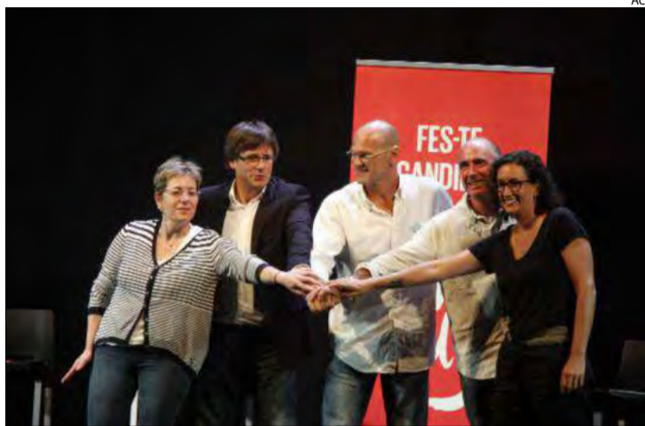
Acte de la candidatura de Junts pel Sí a Puigcerdà.

La llista unitària s'ha proposat aconseguir 100.000 suports un cop superat els dos primers reptes que s'havia fixat. D'entrada aconseguir-ne 13.500, 100 per cadascun dels 135 diputats que hi ha al Parlament de Catalunya. Aquesta xifra es va aconseguir de seguida, i la candidatura es va proposar arribar als 40.930, que era el número de voluntaris que es van mobilitzar per fer possible la consulta del 9-N passat.