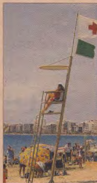
Una platja de Roses