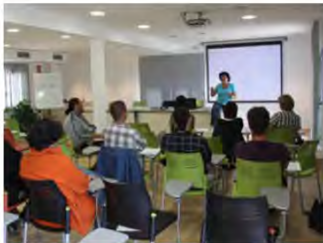
Curs de l'Àrea de Promoció Econòmica de Roses

Enguany, la programació inclou cursos de francès (nivells inicials), d'alfabetització digital, d'emprenedoria i creació d'empreses, i de gestió i innovació en el comerç. Les inscripcions s'obriran a partir del setembre (diferents dates en funció del curs), al Servei d'Atenció al Ciutadà de l'Ajuntament.