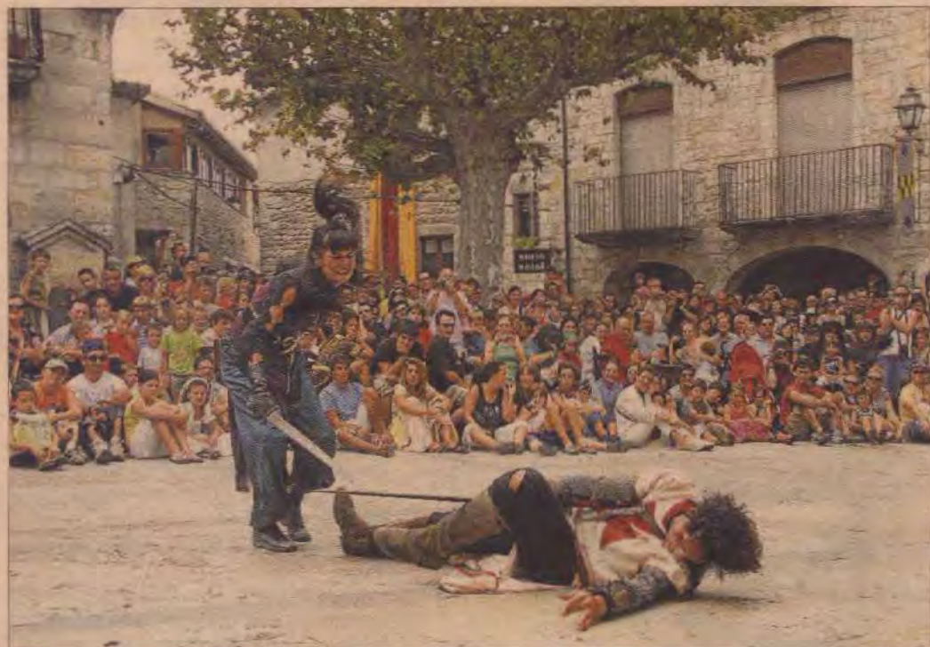
Una de les activitats organitzades per a la festa medieval de Besalú

El centre històric de Besalú es transforma i transporta el visitant mil anys enrere