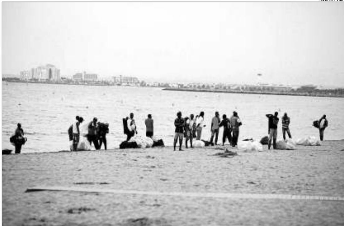
Policies i Mossos d'Esquadra tracten d'identificar els venedors del «top manta» que van saltar a l'aigua.