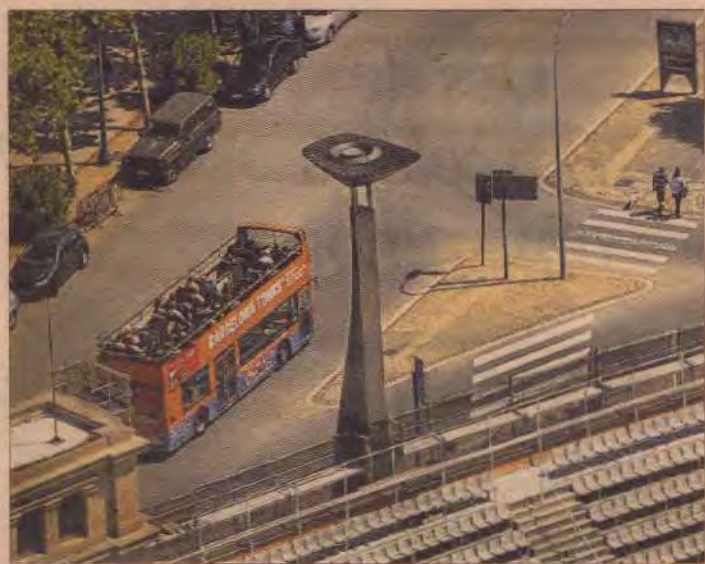
A la imatge, l'avinguda de l'Estadi