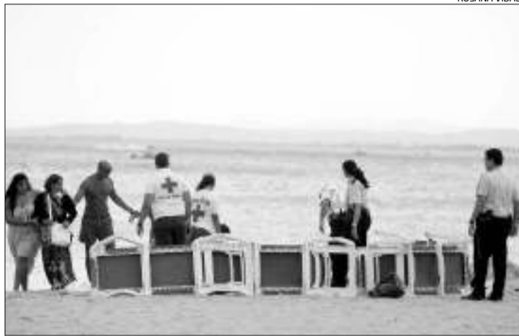
Els serveis d'emergència no van poder fer res per salvar-li la vida.