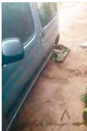
El suport de ferro que els lladres van deixar al lloc de les rodes

da davant del taller mecànic de Can Puet. La furgoneta era d'un client del taller, l'amo d'un restaurant del poble, que l'havia d'anar a recollir ahir al matí perquè el mecànic ja li havia deixat llesta. Per treure les rodes sense que