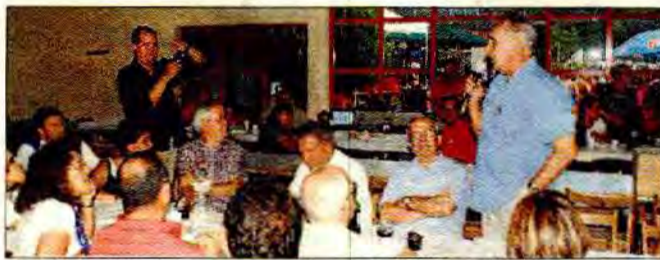
L'edició del llibre ha comptat amb el suport de la UFEC i la FC de Natació

El llibre, segons va comentar l'autor, recull de la forma més detallada possible els inicis realment difícils de la natació, quan només es coneixia com a lleure, gràcies a una entitat també pionera com era el CN Barcelona, que va anar introduint la seva pràctica des de la mar, a l'interior i fins a la muntanya, fets que es remunten a principis del segle XX, la qual cosa té un significat re-