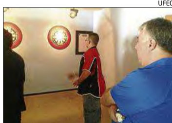
La lluita va ser oberta fins al final.

els equips vinguts de Palafrugell, Reus, Tarragona, Esplugues i l'equip de Puig-Reig. Les primeres rondes van començar descartant l'Esplugues CD per al títol final. El Palafrugell i el Reus van iniciar la lluita per al títol molt igualats, seguits de ben a prop per La Xarxa i el Tiffany's, tots ells amb opcions a tot després de la tercera ronda. La lluita per al títol i les quatre primeres posicions van estar molt obertes fins a l'última ronda, on es van decidir els quatre primers i el guanyador final.