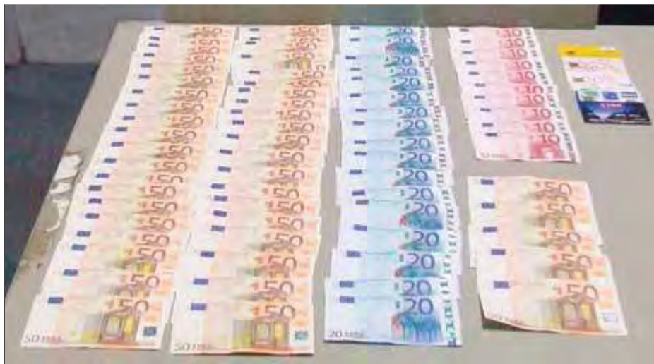
Els diners i les targetes que els Mossos van comissar als detinguts ■ MOSSOS D'ESQUADRA

El modus operandi d'aquests lladres es basava en la seva loquacitat i la distracció de la víctima, ja que els Mossos no van detectar en cap ocasió que introduïssin cap giny, com per exemple en el llaç libanès, per retenir la targeta dins del caixer. Els lladres, que actuaven sempre els caps de setmana, quan no hi ha empleats als bancs, triaven les seves víctimes entre els turistes francesos, amb qui els era més fàcil guanyar confiança per la qüestió de la llengua. Entraven als caixers dar-