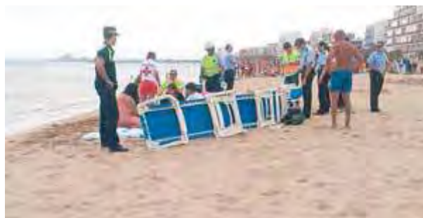
Els equips de rescat intenten reanimar la víctima a la platja de Santa Margarida i el Salatar

Un banyista francès de 46 anys va morir ahir a la tarda a la platja de Santa Margarida i el Salatar de Roses després que, segons tots els indicis, va tenir un atac de cor just quan entrava a l'aigua. L'home es va indisposar quan l'aigua encara no el cobria, i entre la seva dona i els socorristes el van dur fins a la sorra i allà