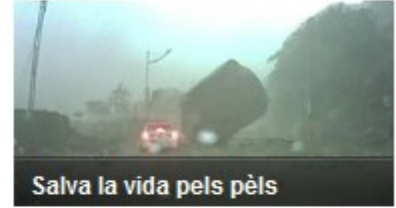
Salva la vida pels pèls