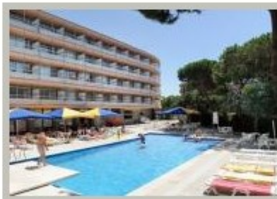
Hotel Hilton Monterrey de Roses, Alt Empordà

El balanç del període major de la temporada turística estival és bo a la província de Girona, del qual la Federació de l'Hostaleria ha comunicat el 30 d'agost unes xifres eloqüents. Els hotels de la zona han conegut una taxa de freqüentació d'un 70% al mes d'agost, de la qual 95% a la Costa Brava, un percentatge superior a les esperances formulades a la primavera pels professionals. Però la reserva d'habitacions ha resultat més modesta a l'interior de les terres, sobretot a Girona-ciutat, on la taxa ha representat un 65%, o a la comarca muntanyenca de la Garrotxa, al voltant de la ciutat d'Olot, amb un 55%, per a només un 50% a Ripoll. En tots els sectors, la primera quinzena del mes ha estat la més generosa i les estades han suposat una mitjana de tres a quatre dies per persona.