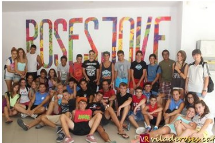
Monitors i joves participants a l'Estiu Jove 2013

El CAR Jove és un espai municipal creat per l'Àrea de Joventut de l'Ajuntament de Roses, pensat per donar resposta a les necessitats i als interessos del jovent de de la Vila. A més a més, és un punt de trobada de joves on s'organitzen tota mena d'activitats, cursos i tallers.