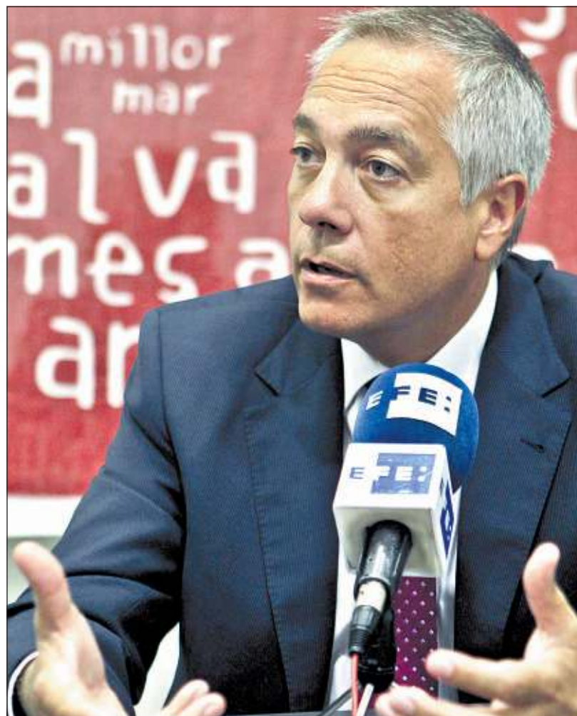
El primer secretario del PSC, Pere Navarro, ayer en una entrevista

bién se celebra en septiembre y en la que estará presente el líder del PSOE, Alfredo Pérez-Rubalcaba, para reivindicar junto al conjunto del PSC "la vía federal" que defienden como alternativa a la secesión. "En