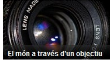
El món a través d'un objectiu