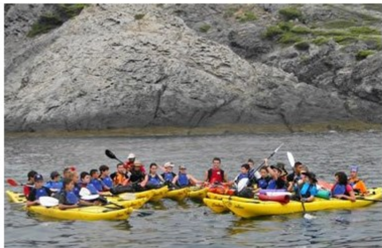
Excursió en caiaç a l'Estiu Jove

cabanes, agafarem un bocata de casa i ens anarem a excursió al PIC de l'Aigu, per exemple. I ara fem això per donar a conèixer als joves el seu entorn i les possibilitats que ofereix Roses sense gastar un euro”.