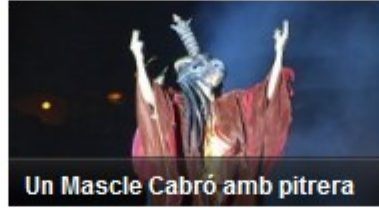
Un Mascle Cabró amb pitrera