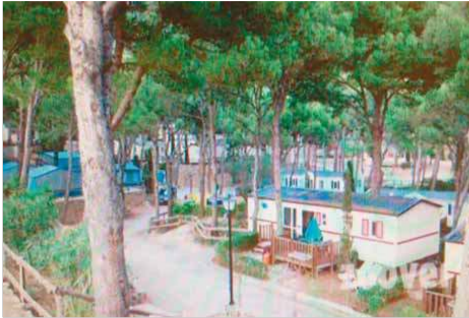
El càmping Castell Mongrí va ser l'escenari de la baralla que va acabar amb un home mort.

A un quart de dues de la matinada de divendres, el vigilant nocturn del càmping va alertar la policia local de Torroella de Montgrí perquè acudissin al càmping i avisessin l'ambulància per fer front a un incident amb ferits. Quan els agents municipals i els serveis mèdics hi van arribar, l'home estava estès a terra, inconscient i amb un bassal de sang al costat. L'ambulància el va traslladar fins a l'hospital de Girona. Paral·lelament, la Policia Municipal va dete-