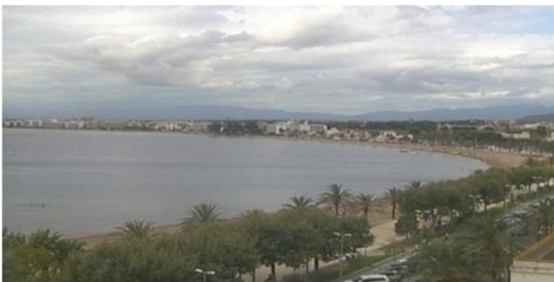
Imatge d'arxiu del golf de Roses.

Un home de 46 anys i nacionalitat francesa ha mort aquest dijous en patir un atac de cor mentre es banyava a la platja de Santa Margarida i el Salatar de Roses, a l'Alt Empordà.