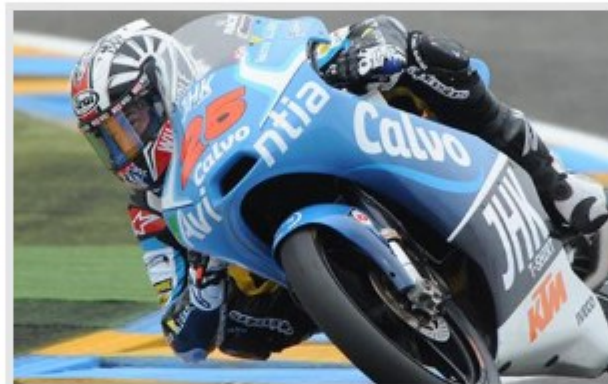
Maverick Viñales fue el más rápido en Moto3 | Foto: AFP