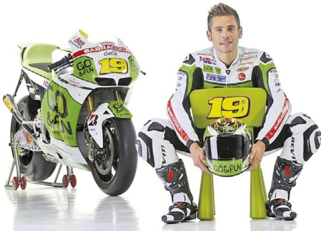
Álvaro Bautista posa delante de su moto en una temporada de gran progresión // MOTOGP

El piloto de Gresini pelea por ser el mejor de entre los que persiguen al trío invencible que forman Márquez, Lorenzo y Pedrosa. Y en las últimas carreras lo está consiguiendo