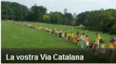
La vostra Via Catalana