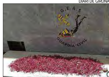
El corall sostret del fons marí.

Els fets es remunten a la una del migdia de dimarts, quan agents del Grup Especial d'Activitats Subaquàtiques de la Guàrdia Civil mentre feien un servei de vigilància i protecció de flora i fauna submarina van veure una embarcació sospitosa amb un ocupant. Els policies van decidir seguir-la i durant el trajecte van veure que recollia un bussejador a la zona de la cala Culip de Cadaqués.