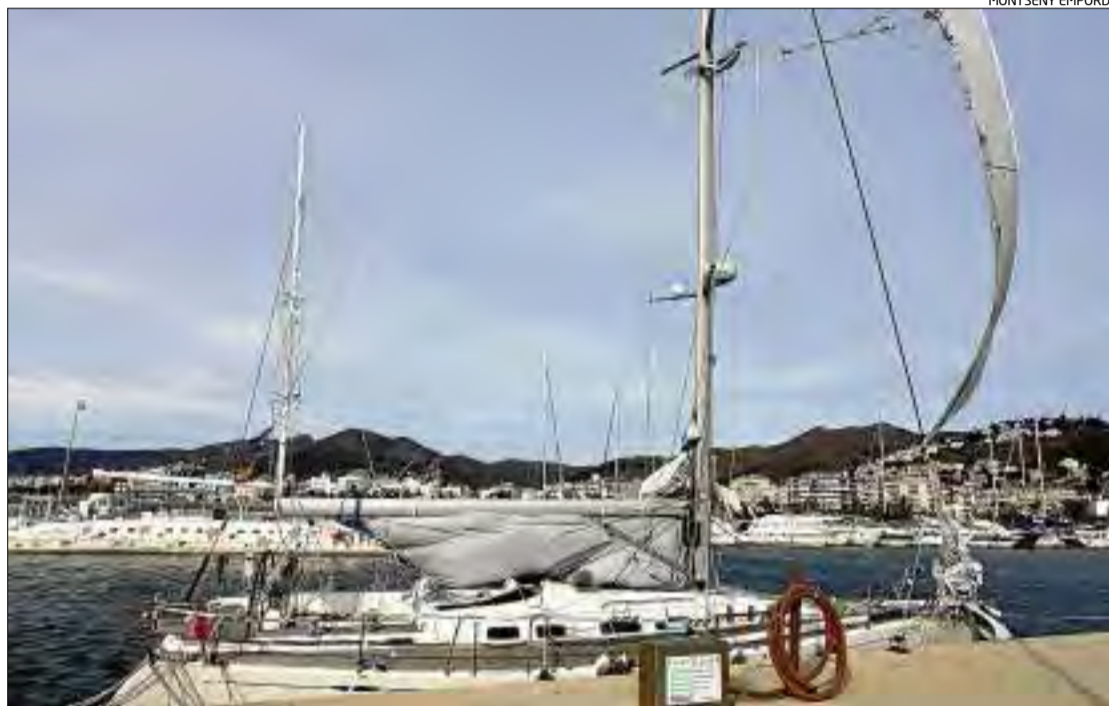
El veler fa uns 13 metres d'eslora i ahir estava precintat al port de Roses.

Els efectius d'emergències van rebre l'alerta a la seva seu cap a la una de la matinada. I un cop van establir el contacte amb els tripulants els van informar que tenien problemes amb el veler i que estaven a prop del Cap de Creus. Mentrestant però i per evitar que el veler s'enfonsés i la tripulació patís danys, des de Salvament van demanar que un vaixell mercant que