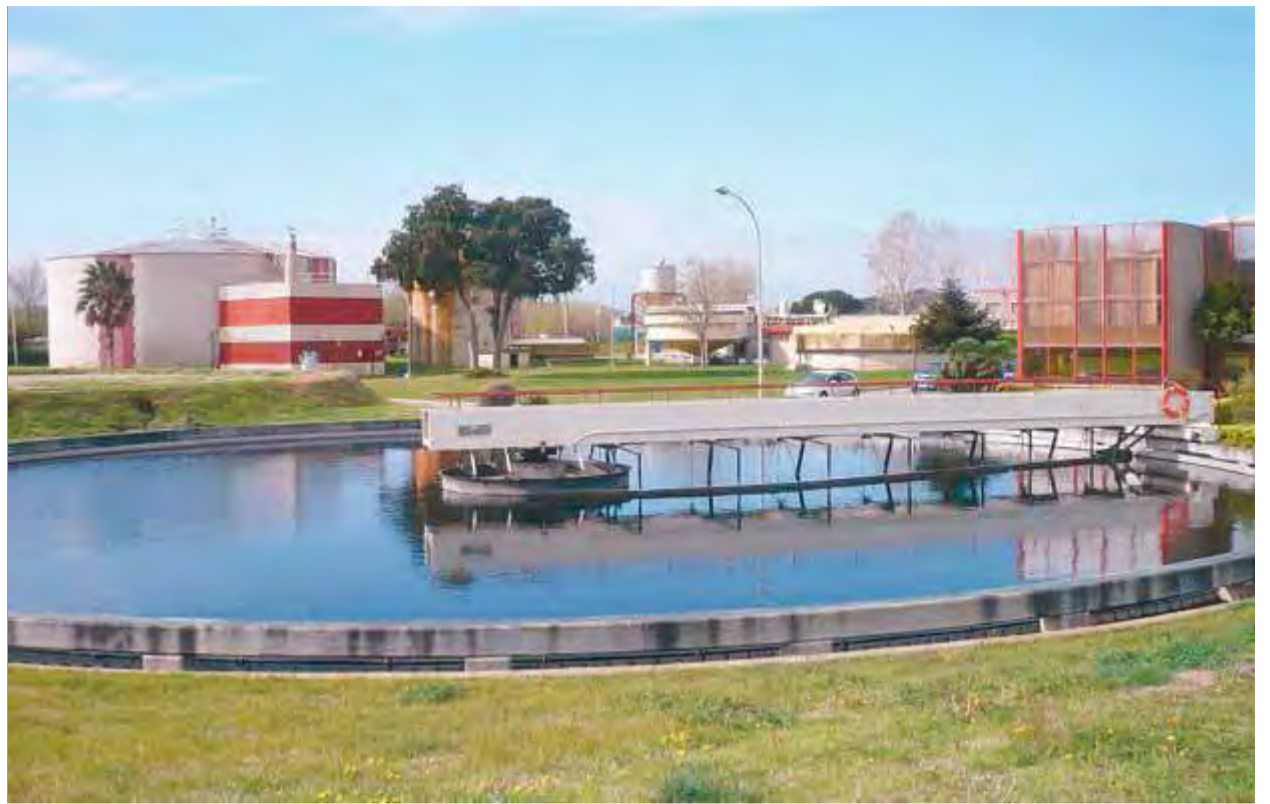
La depuradora de Palamós, que també cobreix Mont-ras, Calonge, Palamós i Vall-llobrega i que es va inaugurar el 1985 ■ A.V.