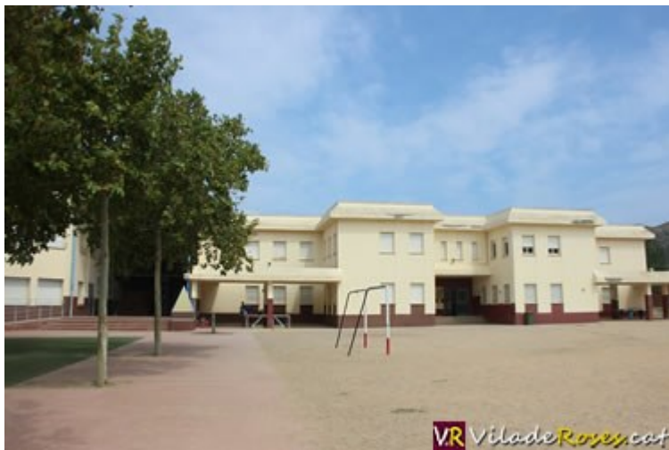
L'Escola Municipal Jaume Vicens Vives de Roses ha estat objecte de millores durant l'estiu

Arranjaments de patis, treballs de pintura i substitució de tanques, són alguns de les actuacions que porta a terme l'Ajuntament de Roses aquest estiu a les escoles municipals de la Vila, aprofitant l'aturada escolar pel període de les vacances estivals.