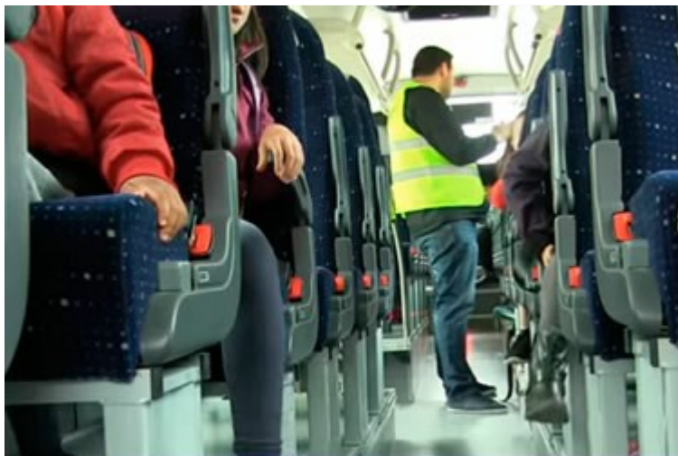
Els acompanyants del servei de transport escolar rebran una jornada de formació al Consell Comarcal de l'Alt Empordà

El Consell Comarcal de l'Alt Empordà reunirà, el proper 4 de setembre a partir de les 9 del matí i a la seu de la institució, una jornada de formació per a tots els acompanyants del transport escolar. En total, es preveu l'assistència d'una seixantena de persones que seran les encarregades de prestar aquest servei coincidint amb l'inici del curs, el proper 12 de setembre.