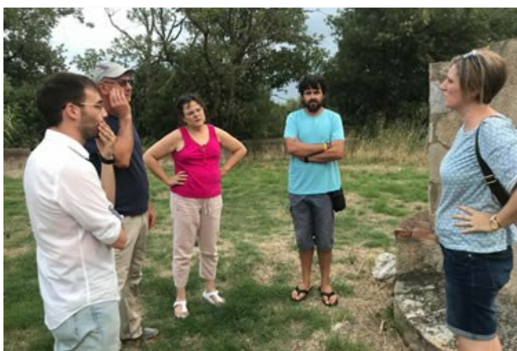
Els regidors d'ERC Roses van copsar l'opinió del veïns de l'urbanització Mas Boscà

Aquesta setmana la secció local d'ERC ha visitat la urbanització del Mas Boscà de Roses , on viuen uns 400 habitants i que està situat als afores el municipi i separat de la trama urbana del centre de la vila. Amb aquesta vista, els republicans han volgut contrastar i registrar sobre el terreny problemàtiques