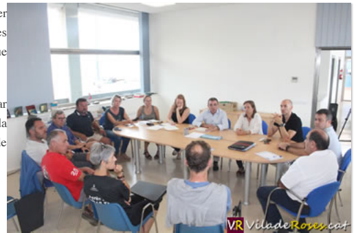
Tots els sectors turístics de Roses van estar representats a la reunió