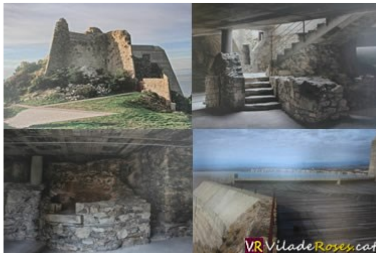
4 de les 10 imatges inèdites que hi ha actualment exposades a l'Oficina de Turisme de Roses

Segurament ens resultaran conegudes, que les hem vist més d'una vegada, però les 10 imatges del Castell de la Trinitat que componen la nova exposició a l'Oficina de Turisme no han estat mai publicades.