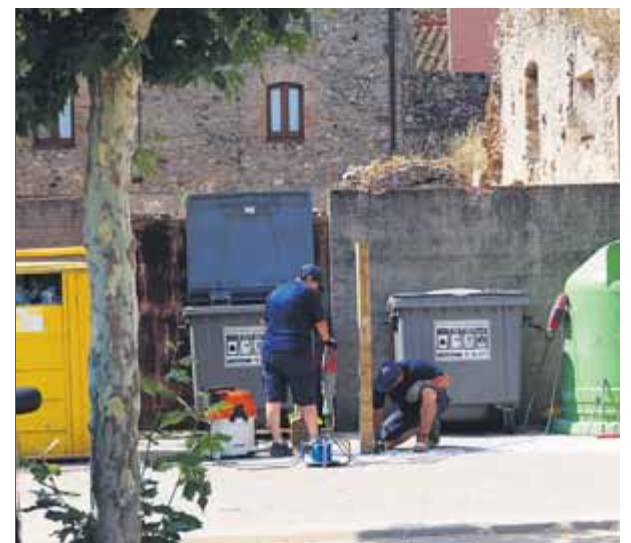
Dos operaris preparant l'inici de les obres

locitat excessiva, afectat pel consum d'estupefaents i amb una conducció desatenta", exposa. L'advocat sosté que hi ha indicis suficients per continuar la causa per un delictes d'imprudència greu amb resultat de mort i portar el conductor a judici. ■