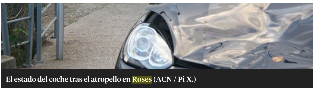
El estado del coche tras el atropello en Roses

Después del siniestro, la Policía Local de Roses abrió una investigación para esclarecer las circunstancias del accidente. El conductor, un francés de 38 años, daba respuestas contradictorias e incoherentes. Por eso, los agentes le realizaron las pruebas de detección de alcohol y drogas y dio positivo en consumo de cocaína.