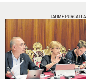
El ple d'ahir.