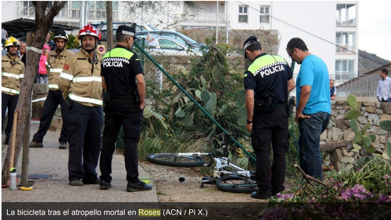
La bicicleta tras el atropello mortal en Roses

La acusación popular espera que la Audiencia de Girona ordene reabrir la investigación para ir a juicio