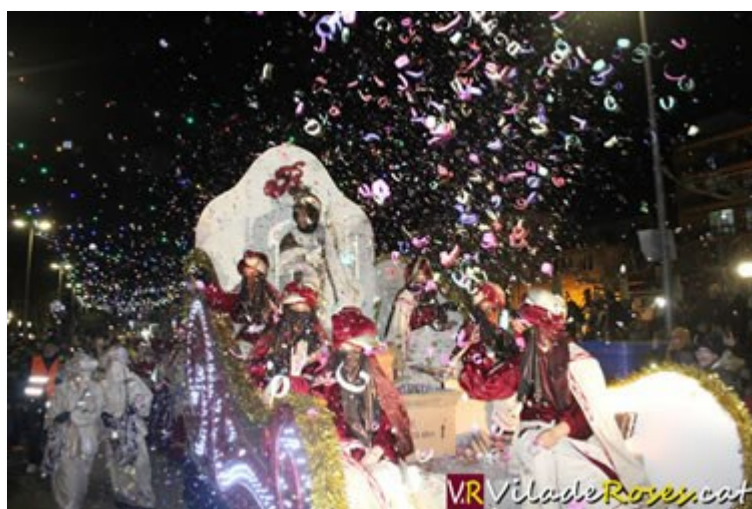
Roses va tornar a viure una nit màgica multitudinària i espectacular amb els Reis Mags

papallones gegants, bebès de dinosaure, malabaristes, xanquers, foc, música i, com no, carbó per aquells nens i nenes, però també pels adults que no s'han portat bé durant l'any 2018. Ni la tramuntana, que va fer acte de presència, va fer deslluir la cavalcada, tret de les pobres papallones, que no podien desplegar a voluntat les seves ales.