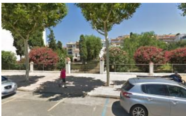
Façana del Mas de les Figueres de Roses. GM

Roses crearà un jardí públic davant de mar en una part de la finca del Mas de les Figueres, del segle XVI, que el propietari ha cedit. L'espai estarà creuat per un camí de passeig i s'hi podran fer activitats a l'aire lliure. La proposta s'ha adjudicat a la baixa per 209.209,00 euros. En un futur s'hi ubicarà un equipament cultural. Mentrestant s'hi realitzaran activitats a l'aire lliure.