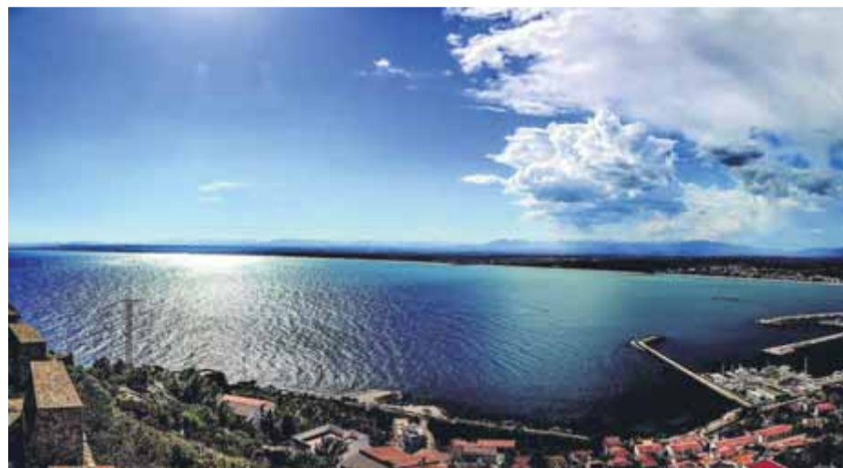
El puig Rom, en una de les espectaculars panoràmiques que exposa aquests dies Manel Casanovas a Ca l'Anita de Roses ■ M.C.

Amb una llarga trajectòria en el món de la imatge, Manel Casanovas s'ha especialitzat a fotografiar el patrimoni monumental i arqueològic. ■