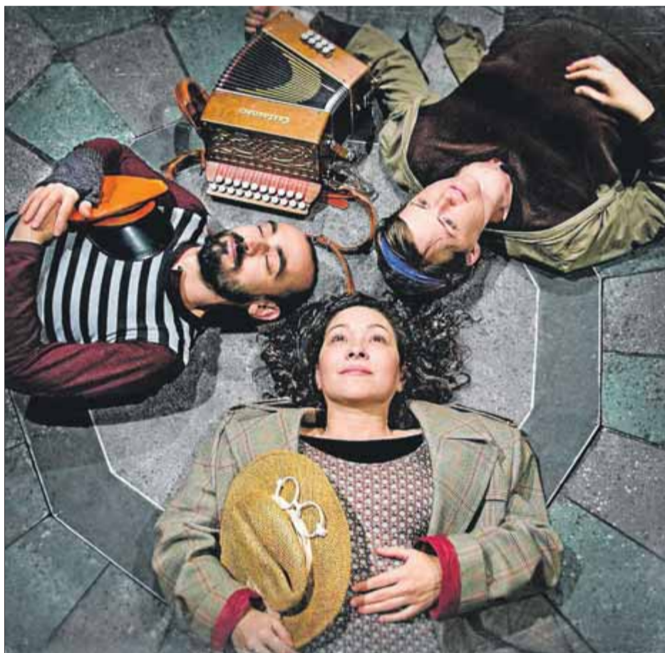
‘Momo’, de la Companyia Anna Roca; ‘Quo no vadis’, de La Pera Llimonera, i ‘Nàufrags’, de La Industrial Teatrera, tres dels espectacles del cicle ■ E.A.E.

L'any passat, L'Empordanet a Escena es va posar en marxa amb 10 funcions d'altres tants espectacles en aquests 10 pobles, i l'èxit de la proposta