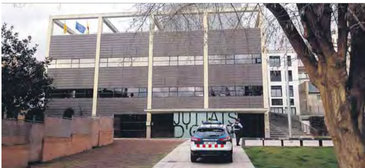
Una imatge d'una patrulla dels Mossos d'Esquadra que vigila els accessos als jutjats de la capital garrotxina ■ J.C.