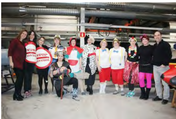
Celebrar el Carnaval a Zodiac Roses és ja tota una tradició

El talent humà és el capital més important de qualsevol organització, és la peça fonamental per implementar l'estratègia de negoci i, a la vegada, per arribar a assolir les metes proposades per la direcció de la companyia.