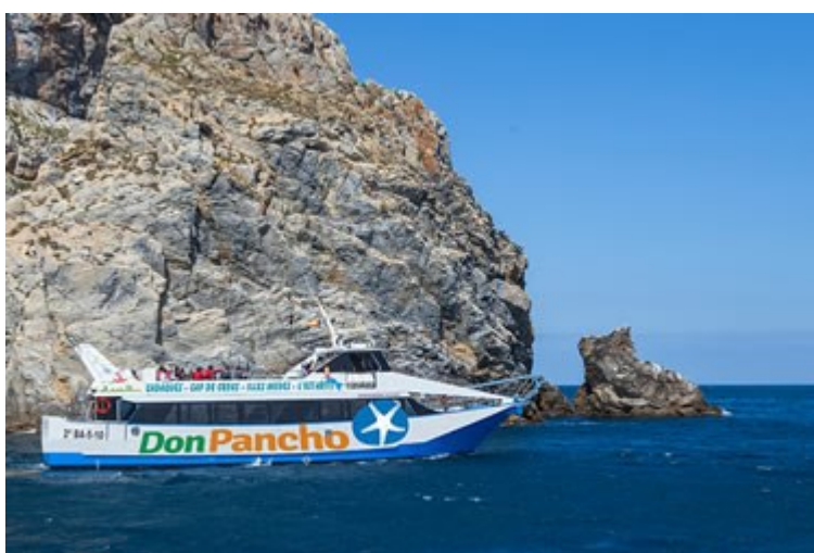
El vaixell Don Pancho de 'Roses Serveis Marítims', una de les empreses que continuarà oferint el servei de transport marítim de passatgers per la badia de Roses

Un cop tramitat el concurs i valorades les ofertes presentades pels licitadors, les autoritzacions per a la instal·lació de punts d'amarrament d'embarcacions de transport turístic de passatgers i de les guinguetes de venda de tiquets corresponent, han recaigut sobre les empreses Roses Serveis Marítims , Màgic Catamarans , Nautilus Submarino i Navegació i Turisme d'Empuriabrava .