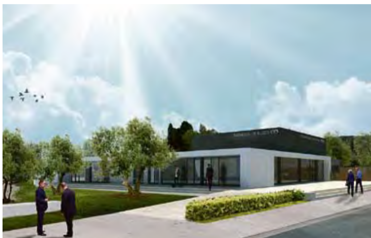
EL PROJECTE. Vista exterior virtual de l'edifici de serveis funeraris