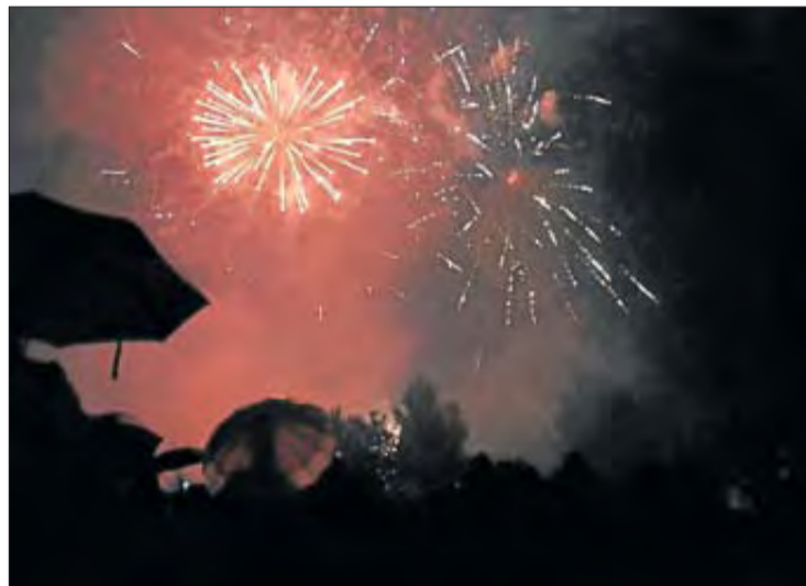
El piromusical de clausura al Parc de les Aigües. CONXI MOLONS

Felip destaca també el gran nombre d'activitats de la programació d'enguany que han comptat amb un «calendari encertat» per la coincidència dels festius 1 i 3 de maig entre setmana, la qual cosa ha donat «continuitat i cohesió a l'ambient festiu». A més, l'Embaraca't, segons l'alcaldessa, també s'ha desenvolupat sense