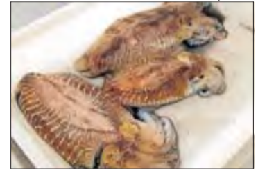
Les sèpies comissades

Donat que els productes pesquers no tenien cap documentació que acredités la seva correcta traçabilitat, la policia va comissar el peix i va denunciar al pescador i el titular del restaurant per incomplir la llei de pesca i acció marítima.