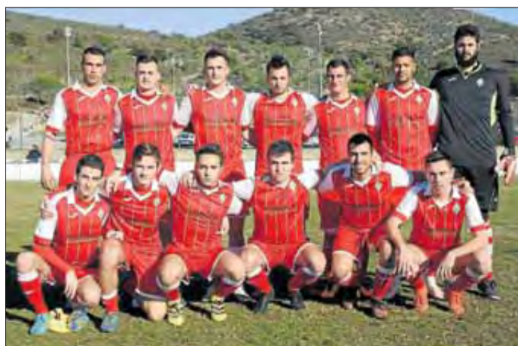
A l'anada, el Portbou va guanyar amb contundència a Navata (0-3).