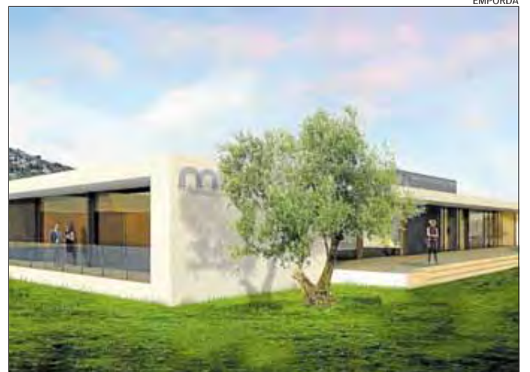
Una representació virtual de l'exterior de l'equipament.

Les reaccions a aquesta moció crec que han estat ben indicatives de la realitat que envolta aquesta malaltia. Per una banda, alegria i satisfacció per part de moltíssimes persones afectades de la nostra vila, que agraeixen i necessiten totes les iniciatives que ajudin a visibilitzar la seva situació. Per l'altra, comentaris de persones que, segurament sense mala intenció, qüestionaven la necessitat de presentar aquesta moció, ja que creuen que la fibromiàlgia és, sobretot, una excusa que certa gent utilitza per eludir responsabilitats o obligacions en l'àmbit laboral. Les dues coses, certament, demostraven la necessitat de presentar-la. El suport polític que ha obtingut al ple de Roses ha estat rotund: aprovada per unanimitat. Això és una gran notícia, perquè demostra la sensibilitat i la conscienciació del conjunt del consistori amb aquesta causa, i garanteix que l'Ajuntament estarà al costat dels malalts i treballarà per ajudar-los. És evident que des d'una modesta institució local com la nostra no es podrà solucionar el problema, ni es podrà canviar aquesta dolorosa realitat. Però tota ajuda serà útil, i el poc que puguem fer, tenim la responsabilitat de fer-ho. La causa s'ho val.