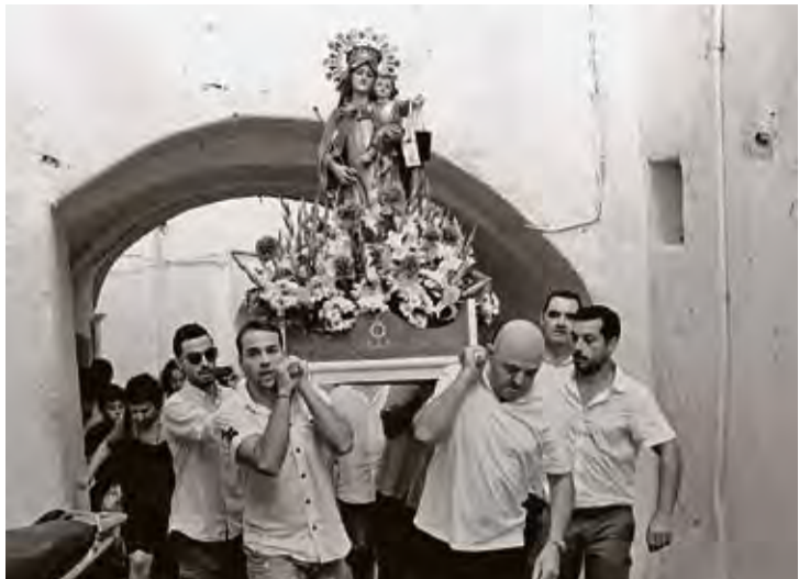
TRADICIONS. Els portadors de la marededeu del Carme