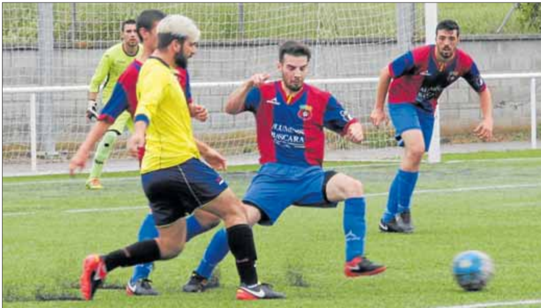
Una jugada del Bàscara-Base Roses, on els rosincs perdien 2-0 al minut 20 i van obtenir la igualada en el '90.