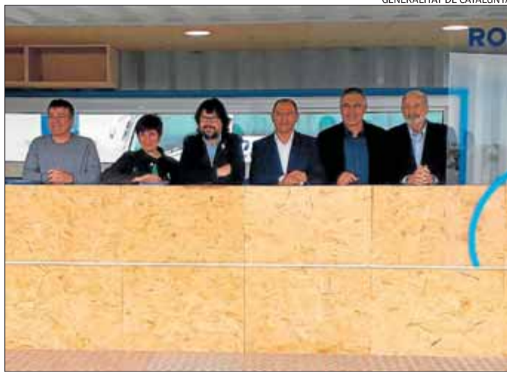
Les autoritats, presentant el nou mòdul d'informació.

Com a novetat de la temporada, l'administració portuària ha