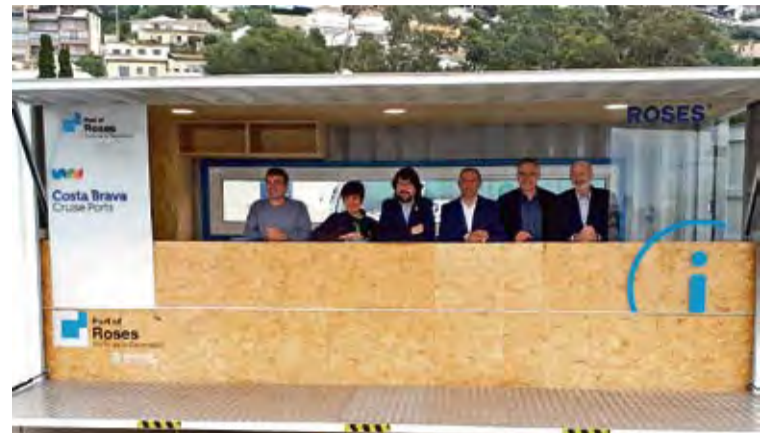
PUNT D'INFORMACIÓ TURÍSTICA. Dissenyat dins un contenidor de mercaderies PORTS