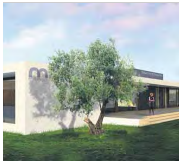
Imatge virtual del projecte de Mémora ■ AJ. ROSES

neraris SL. El consistori va formalitzar aquest pas en l'últim ple celebrat aquest dimecres passat. Tres empreses del sector havien participat en el concurs per fer-se càrrec d'aquest equipament i Mémora ha estat la que ha presentat la millor oferta econòmica: un cànon fix a favor de l'Ajuntament de 240.000 euros (el mínim requerit en les bases del concurs era de 180.000 euros), i un cànon variable de 60% dels ingressos bruts variables (el mínim requerit era del 7%). Les altres empreses proposaven un cànon fix