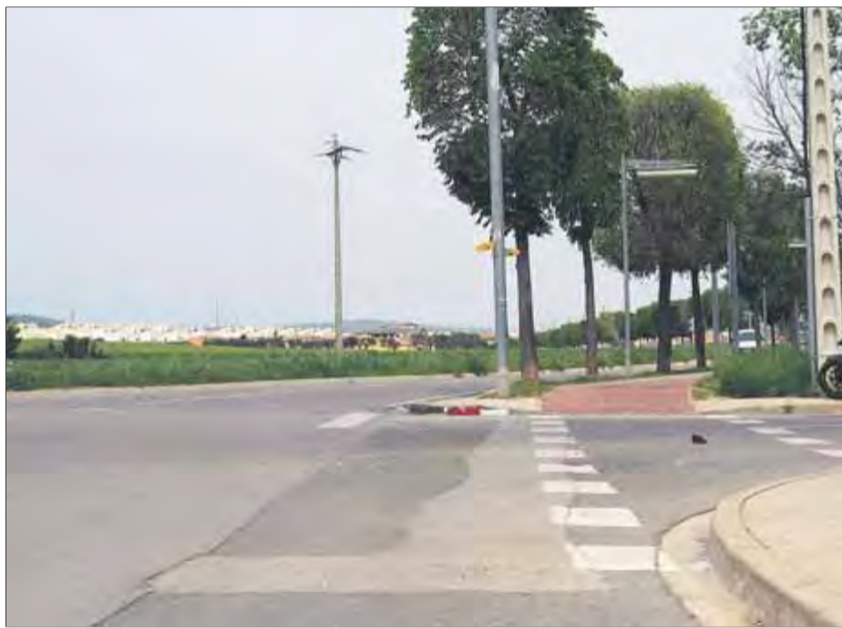
El punt exacte on es connectaran el carril bici existent i el nou ■ JOAN PUNTÍ

En els altres quatre trams, les obres consistiran en l'ampliació i modificació de les actuals voreres per fer lloc al carril bici. També caldrà preveure el trasllat de pilons a la línia