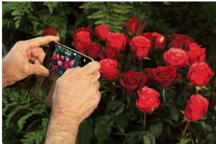
FLORS. Hi haurà un recorregut pel poble, seguint la decoració floral

R oses celebrarà per setè any consecutiu la Fira de la Rosa durant el cap de setmana 2 i 3 de juny. Tant dissabte om diumenge es programaran espectacles gratuïts al carrer: concerts, circ, teatre, pallassos o màgia, que es veuran a la Riera Ginjolers. Per altra banda la decoració floral serà present en diversos espais de la vila i es tornarà a organitzar l'exposició ja clàssica de rosers, l'entrega de Premis dels Jocs Florals, un mercat artesanal i un concurs d'instagramers. Pel que fa a la gastronomia, es repetiran els Tastets de Roses, en què una selecció de restaurants locals oferiran degustacions a preus populars. Així mateix, amb la campanya «1.000 Ro-