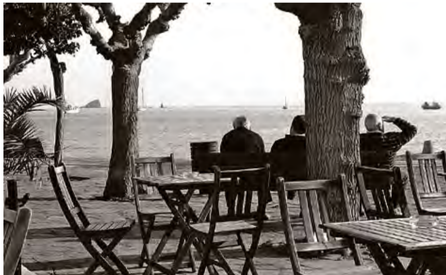
ARRAN DE MAR. Tres amics parant la fresca en un banc de Portdoguer