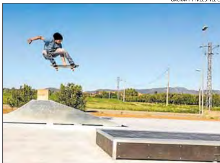
UNGRAVITY FREESTYLE CO

► El diumenge 6 de maig, nou pobles del Cap de Creus van fer la sisena edició de la pujada a peu al monestir de Sant Pere de Rodes. La trobada va ser organitzada per Via Pirena, i hi van participar Vilajuïga, Llançà, la Vall de la Santa Creu, la Selva de Mar, el Port de la Selva, Cadaqués, Roses, Palau i Pau.