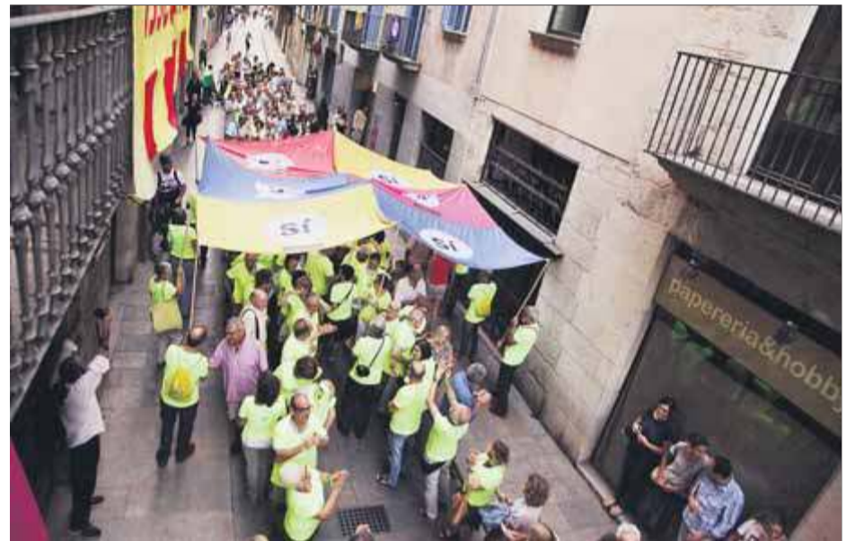
L'assaig de la Diada ahir al carrer Ciutadans de Girona ■ JOAN SABATER