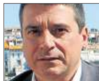
Jordi Matas ► Catedràtic de ciència política a la Universitat de Barcelona