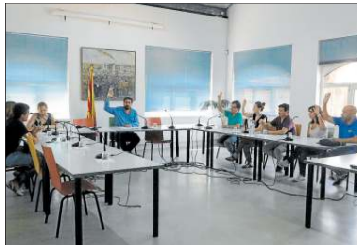
Ple extraordinari de Celrà per ratificar ahir el decret de suport a l'1-O.