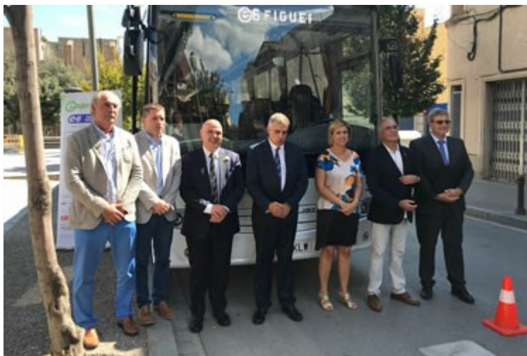
Moment de la presentació de la nova línia del bus exprés.cat

Concretament es posaran en servei 7 noves expedicions per sentit, entre les 7 hores i les 20.00 hores, amb sortides cada hora. Cinc d'aquestes expedicions per sentit s'oferiran tots els dies de l'any, de dilluns a diumenge. Els feiners, de dilluns a divendres, s'incorporarà una altra sortida per sentit, a primera hora del matí, i els dissabtes, diumenges i festius, una altra sortida per sentit a mig matí.