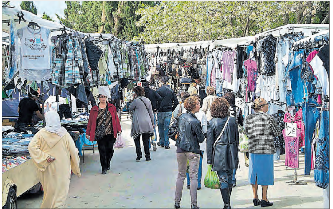
El mercat de roba de Figueres se celebra setmanalment els dijous al passeig Nou (arxiu). CONXÍ MOLONS

«No estem d'acord amb aquest canvi perquè creiem que tornarem a tenir el mercat dividit i ens perjudicarà», insisteix Vergés. El representant dels marxants considera que s'haurien de concentrar més parades al passeig Nou i om-