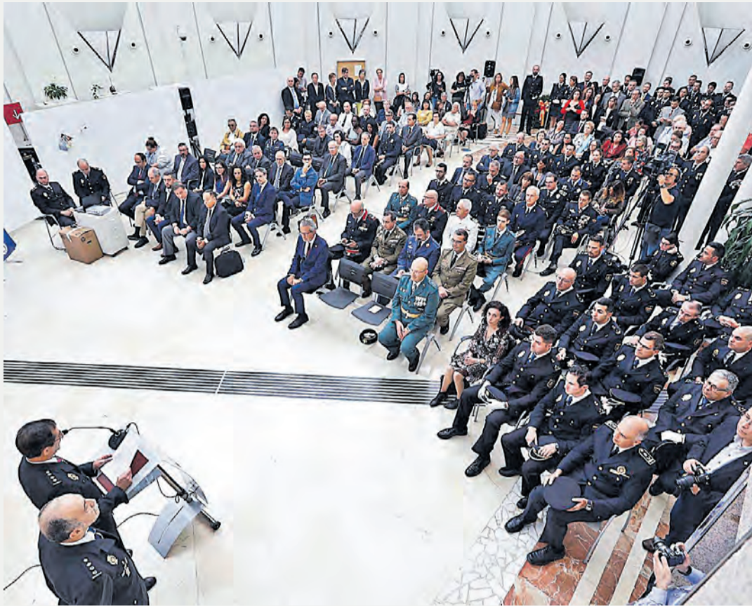
La sala de la Subdelegació del Govern, plena de gom a gom per la festa patronal del CNP.