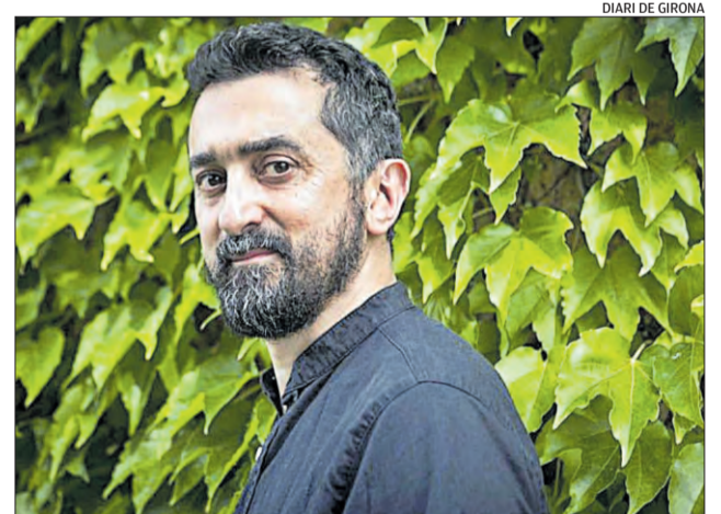
DIARI DE GIRONA

■ Teatre de Blanes D Diumenge 13 H 17.30 h P 7 € ■ La companyia Sgratta presenta aquest diumenge a Blanes l'espectacle familiar La princesa en texans . Al país del Poble Sec fa temps que no hi plou, i per acabar-ho d'arreglar, un terrorífic drac es beu la poca aigua que raja de la Font Dolça. Aconseguirà la princesa Maribel fer fora el drac? Ho aconseguirà el cavaller? Arribarà finalment l'aigua al poble? Una proposta divertida per a tota la família.