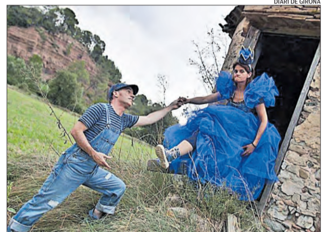
DIARI DE GIRONA

■ Plaça del Mil·lenari (Platja d'Aro) D Divendres 11, dissabte 12 i diumenge 13 H Tot el dia. W http://ciutada.platjadaro.com ■ Fins diumenge, Platja d'Aro acull la 32a edició de la Fira de la Cervesa. Un esdeveniment en el qual es poden tastar fins a 30 varietats de cervesa internacional, i descobrir-hi algunes de les produccions artesanals així com gaudir de les varietats gastronòmiques més tradicionals i de la música en directe.