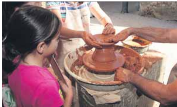
La Fira de l'Olla ofereix activitats atractives relacionades amb el món de la ceràmica i la terrissa

Ceramistes i terrissaires tant de Breda com d'altres indrets mostraran els seus millors productes a la vuitena Fira de l'Olla, en què també hi participen els comerciants locals. La mostra d'aquest cap de setmana vol donar a conèixer el sector ceramista i terrisser local, puntal durant generacions en el desenvolupament econòmic de la vila de Breda. Però amb activitats properes i atractives per al públic, combinant propostes d'oci i un fort component divulgatiu amb demostracions d'elaboració de ceràmica, exposicions, conferències i un fort component gastronòmic. Propostes populars i esperades són una cursa