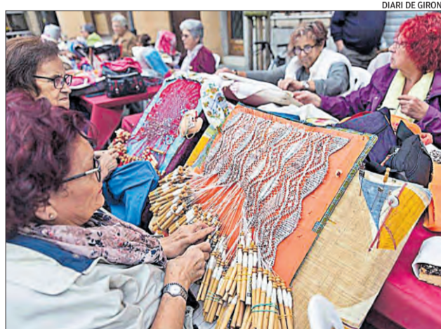
DIARI DE GIRONA

■ Illa d'Ítaca (davant dels cinemes de Roses). D Del divendres 11 al diumenge 13 H Tot el dia. P Gratuïta W http://www.labisbal.cat ■ Roses celebra aquest cap de setmana la segona edició de la Fira de la Cervesa Artesana, un esdeveniment amb ànim de consolidar-se i que aposta per oferir una àmplia carta de cerveses de fabricació artesana, oferint als visitants activitats paral·leles com la gastronomia o la música en directe per a tots els públics.