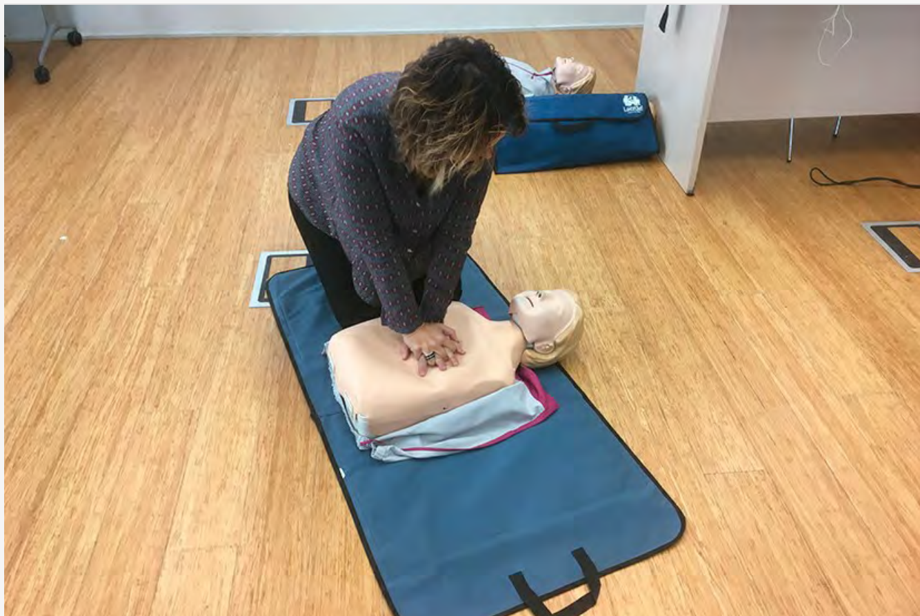
Un moment de la formació sobre el funcionament dels desfibril·ladors externs automàtics (DEA)

Durant una sessió impartida per Dipsalut el personal docent de les escoles de Primària de Roses ha sabut fer funcionar els desfibril·ladors externs automàtics (DEA), així com les pautes bàsiques i protocol a seguir en cas de fer-los servir