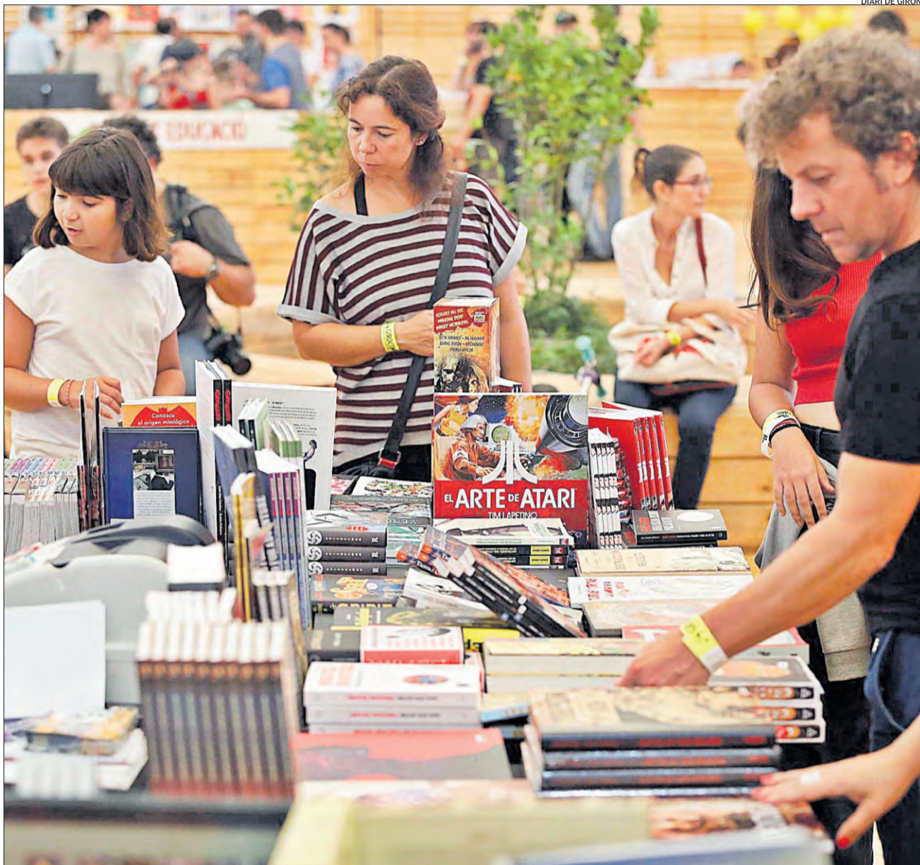
DIARI DE GIRONA

CONSULTA LES NOSTRES PROPOSTES A www.diaridegirona.cat