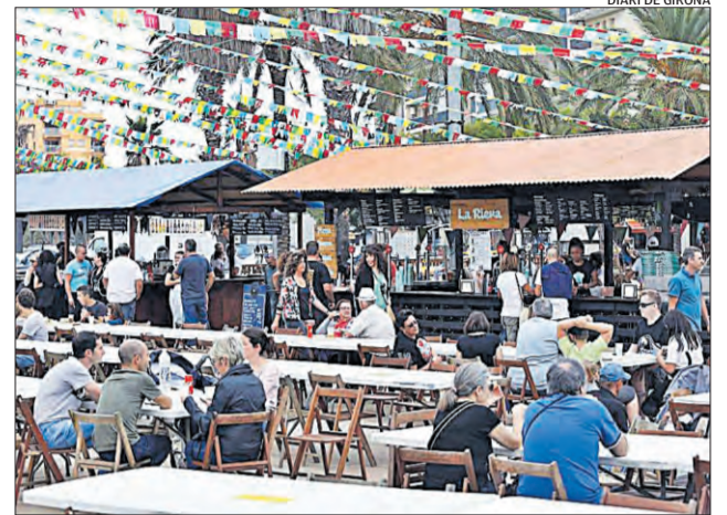
DIARI DE GIRONA

■ Diversos espais (Sant Hilari Sacalm). D Dissabte 12 i diumenge 13 H Tot el dia P Gratuït W https://www.santhilari.cat ■ Dissabte i diumenge, Sant Hilari Sacalm celebra una nova edició de Fira Guillerries. La música en directe, un gran mercat de productes d'artesanania, zona infantil, artistes, autocaravanistes, puntaires, bolets, trenet turístic i una destacada oferta gastronòmica destaquen en el programa d'enguany.