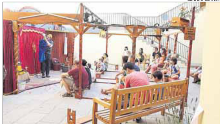
Diversió amb els espectacles infantils per al públic familiar.