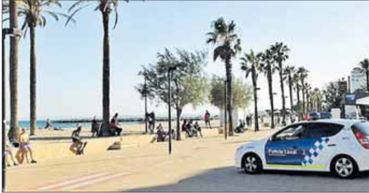
El nen s'estava banyant a la platja de Santa Margarida.