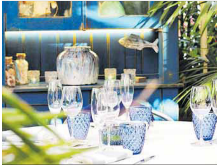
Els Pescadors es troba al carrer Castellar de Llançà i la seva proposta gastronòmica, espectacular.

En un ambient reservat, al nord de la Costa Brava, l'establiment aposta per la convivència de les arrels gastronòmiques, la recerca i la creativitat, per oferir una cuina refinada i cosmopolita, basada en