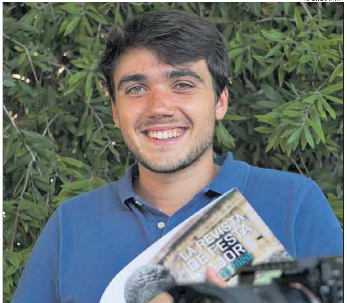
El jove fotògraf amb la revista de la Festa Major de Roses 2020.

■ És el primer any que participo en la creació de la revista, òbvia-