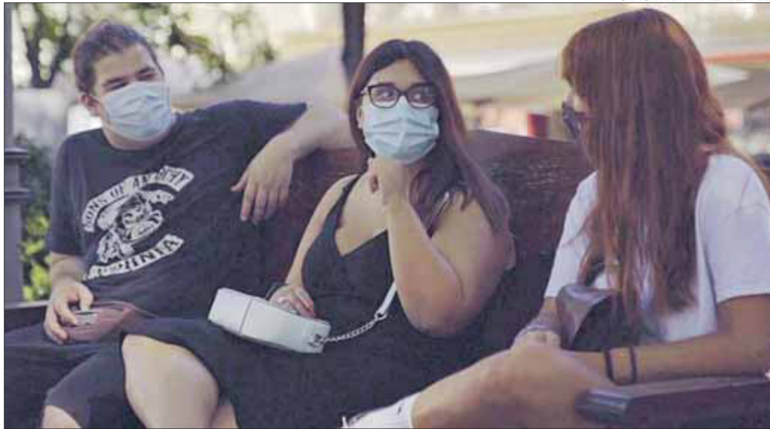
Els tres protagonistes de Figueres del vídeo «Els joves de l'Alt Empordà ho fem bé, i tu?».