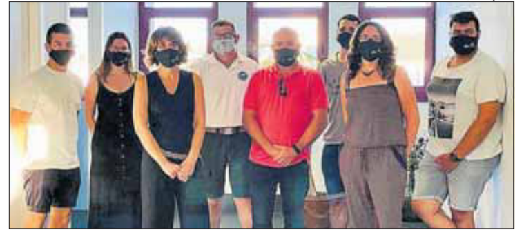
La composició del nou equip de govern de Cadaqués.