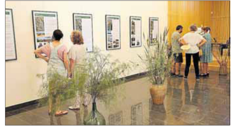
Castelló d'Empúries ha inaugurat diferents exposicions per la festa.