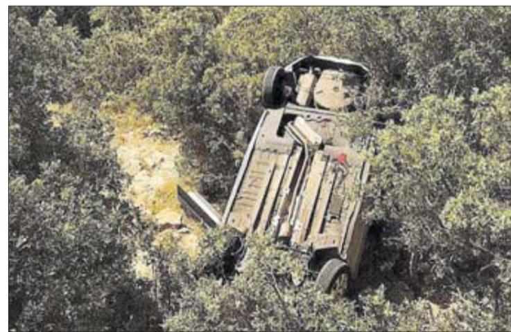
El vehicle que es va precipitar d'uns quinze metres. BOMBERS

Els Bombers van rescatar el conductor amb helicòpter, ja que és una àrea de difícil accés.