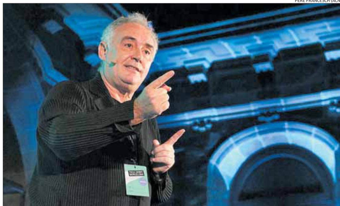
PERE FRANCESC (ACN)

El restaurant compta amb una pàgina web on els clients poden trobar tota la informació necessària: http://www.restaurantelspecadors.com . També són molt actius a les xarxes socials, el seu usuari a Facebook i Instagram és @elspecadorsllanca, mentre que a Twitter és @Tapadors. Per a qualsevol qüestió, reserva o dubte, el telèfon de contacte és el 972 380 125. L'horari és d'1/4 de 2 a 1/4 de 4 del migdia i de 2/4 de 9 a 1/4 d'11 de la nit.