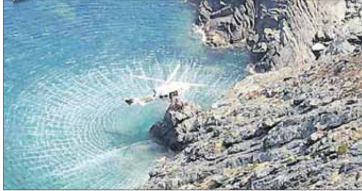
Moment del rescat de l'home que va caure.