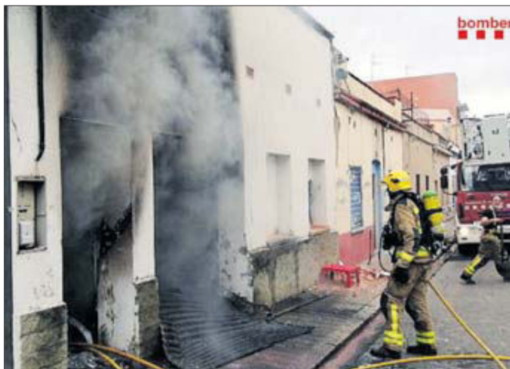
Els Bombers treballant en l'extinció del foc de l'habitatge. BOMBERS