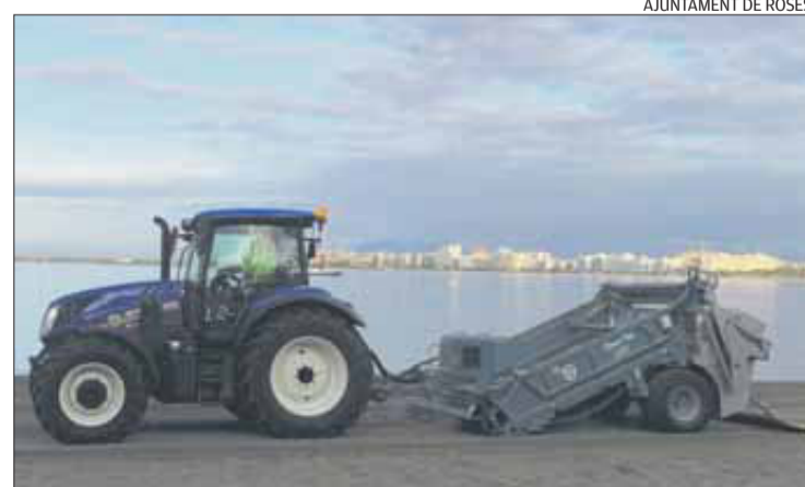
Una de les màquines que s'han incorporat a la neteja de platges.

presentaven una problemàtica més gran, com ara les burilles de cigarreta. El nou sistema possibilita també l'entrada d'un flux de sorra més important, que pot ser controlat des de cabina seleccionant la posició necessària segons les característiques de cada espai de platja, millorant així la neteja de les platges que tenien problemes pel gruix reduït de sorra.