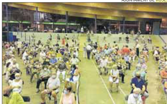
AJUNTAMENT DE ROSES

Els espectacles infantils són un clàssic de la festa que no falten enguany a la programació.