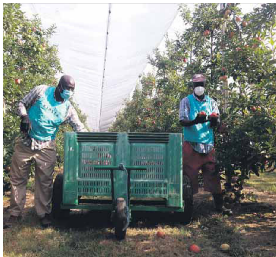
Dos treballadors recollint fruita en una finca de l'Armentera

El pla ha estat elaborat pels departaments de Salut, Treball, Afers Socials i Famílies i Agricultura, Ramaderia, Pesca i Alimentació de la Generalitat, juntament amb els empresaris i cooperatives de la poma, els consells comar-