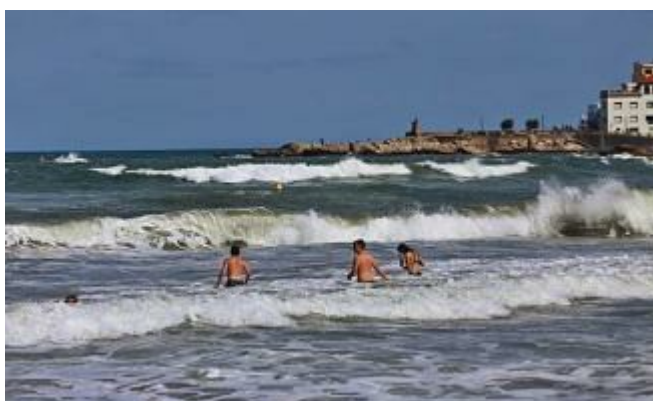
L'episodi de vent i pluja deixa arbres caiguts i onades de dos metres girona

L'episodi de pluja que es va encetar aquest dilluns a Catalunya i a les comarques gironines, on ahir s'hi va afegir el vent, va provocar durant la matinada d'ahir una allau d'incidències concentrades sobretot al litoral de l'Alt Empordà i de la Selva. Els Bombers van registrar durant el dia d'ahir una quarantena d'avisos a la província relacionats amb la pluja i el vent, la majoria (24) dels quals van efectuar-se durant el matí. El fort temporal va provocar onades que en alguns punts de la Costa Brava com l'Escala, Blanes i Tossa de Mar van superar els dos metres i a la Costa Daurada els 2,5, i van deixar platges sense sorra al Maresme.