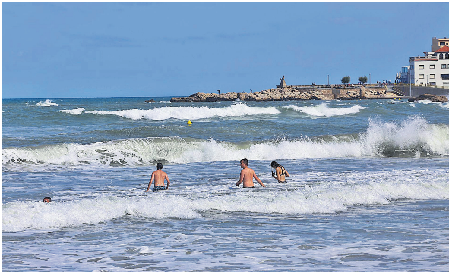
A dalt: Banyistes desafiant les onades a l'Escala, ahir. A l'esquerra: Temporal a la platja de Blanes, ahir. A la dreta: Branca caiguda a l'avinguda Lluís Pericot, ahir a Girona.