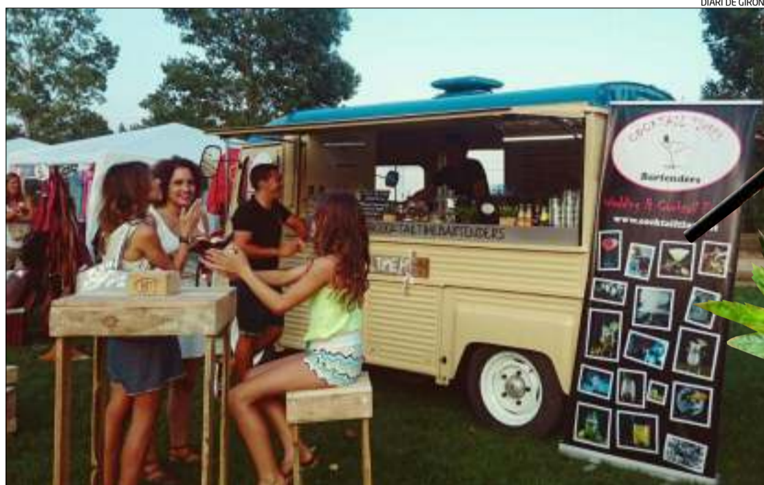
La furgoneta «vintage» del CocktailTruck en la seva primera parada, al Chic&Cheap de Girona.

El CocktailTruck fa parades tant a noces, markets , aniversaris, inauguracions i tot tipus de celebracions amb un toc vintage . La pròxima parada del CocktailTruck serà l'Acústica de Figueres els dies 27, 28 i 29 d'agost.