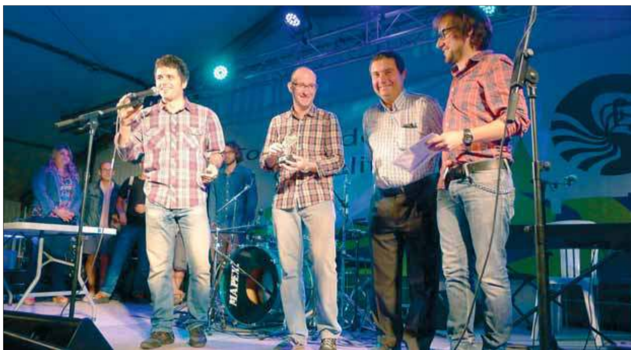
Parellop, guanyadors del premi popular de l'edició del 2014 ■ NURI FORNS

Els guanyadors es donaran a conèixer al final del concurs. Enguany els premis són de 800 euros per al primer classificat, 400 per al segon i 200 per al tercer. També hi ha un premi popular –que escullen diferents persones triades a l'atzar entre el públic assistent– de 100 euros i un lot de productes del Mas Bes de Salitja. Els finalistes d'aquest any