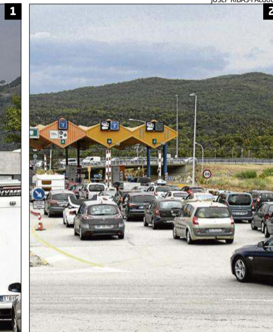
LLARGUES CUES A LA JONQUERA 1 Les llargues cues es van intensificar a la N-II a partir del migdia i van arribar a ser de 12 quilòmetres de longitud. 2 Les retencions també es van fer als peatges de l'AP-7 per anar cap a França.

entre nou i 12 quilòmetres de cues. El punt més àlgid va ser al voltant de les set del vespre quan encara continuaven les retencions a l'autopista en direcció França i a més, hi havia 6,5 quilòmetres de retencions per enllaçar amb la N-II al seu pas per la Jonquera. Però és