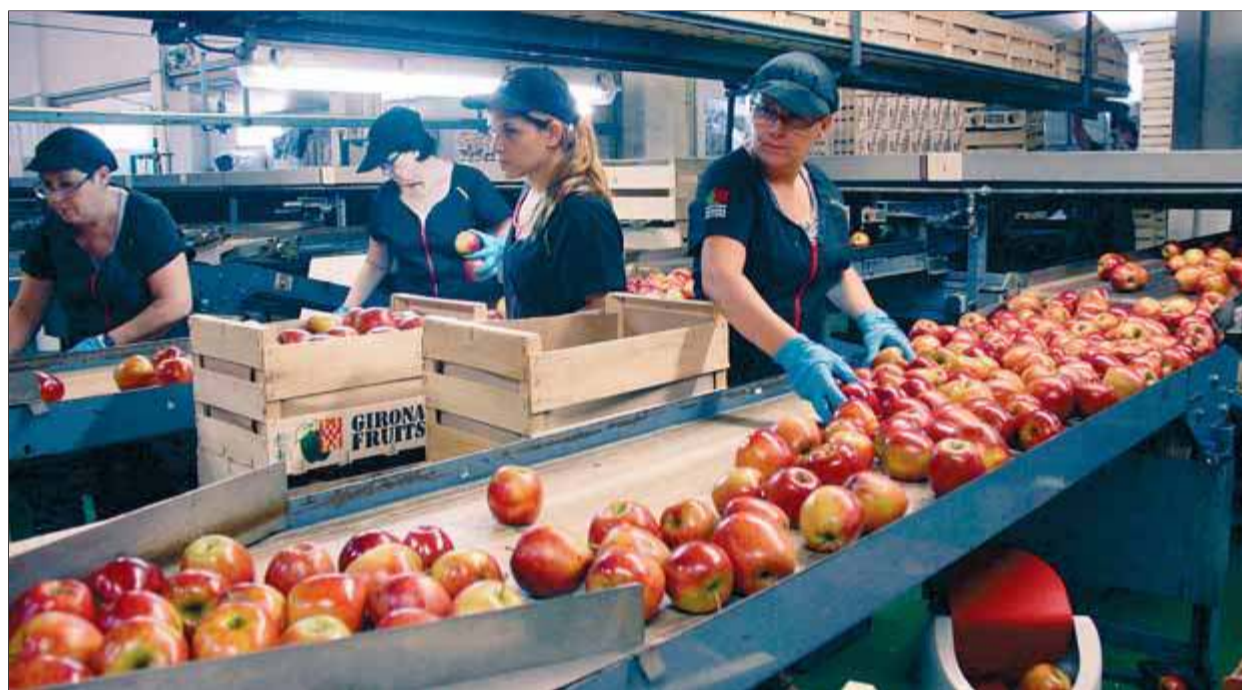
Treballadores de la cooperativa Girona Fruits, seguint el procés de tria i encaixat de la fruita

La cooperativa Girona Fruits va néixer el 1966. Sota el seu paraigua s'agrupen 25 productors i 610,11 hectàrees d'arbres fruiters, la majoria dels quals es troben a la comarca del Baix Empordà. Durant els últims anys, els seus agricultors s'han centrat exclusivament en el cultiu de pomes. De fet, la