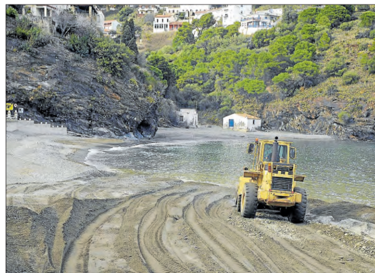
Les màquines, posant a lloc la platja de Portbou.

A l'Escala les platges més afectades són les d'Empúries, i hi ha