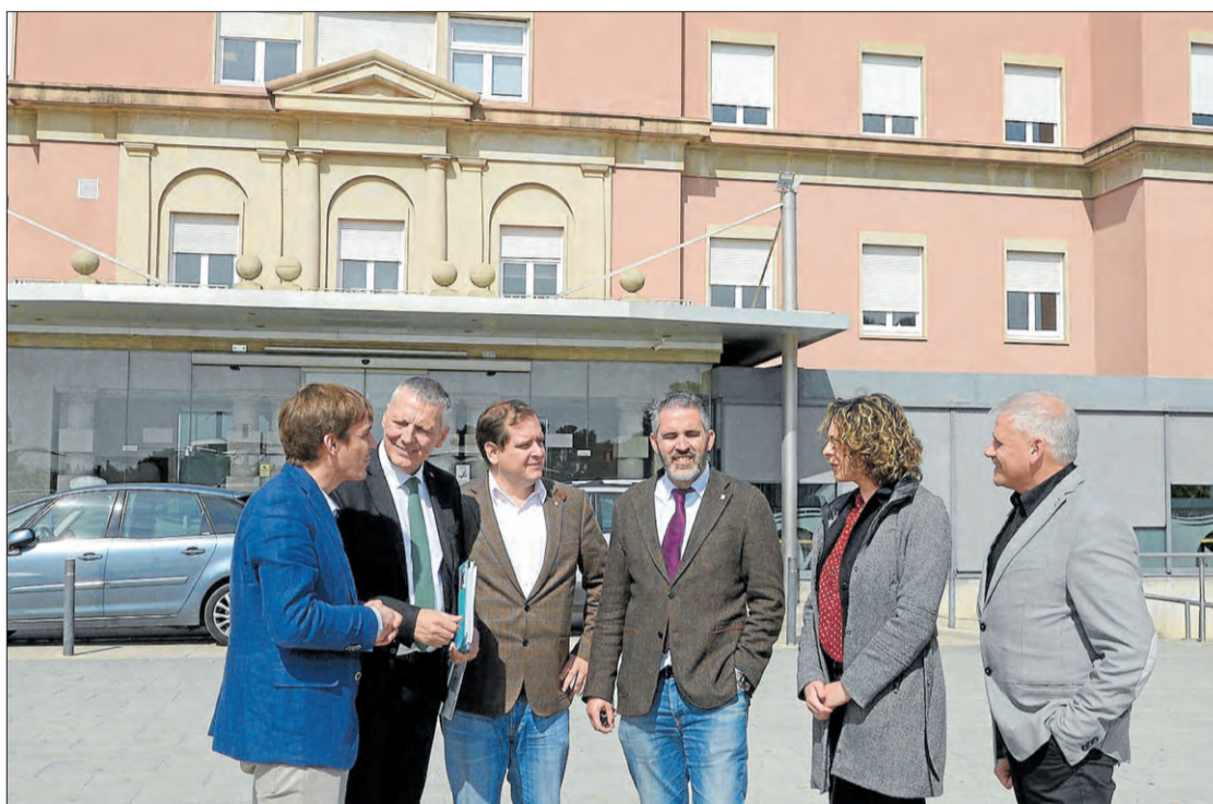
Els diputats de Cs que ahir van visitar l'Hospital de Figueres.

Fapoc més d'un any i mig des que es va fer l'última reforma a l'hospital però «encara hi ha millores per fer». Modernitzar punts concrets de l'hospital seria el següent pas i se'n desprèn la necessitat d'una ampliació que es fa «difícil».