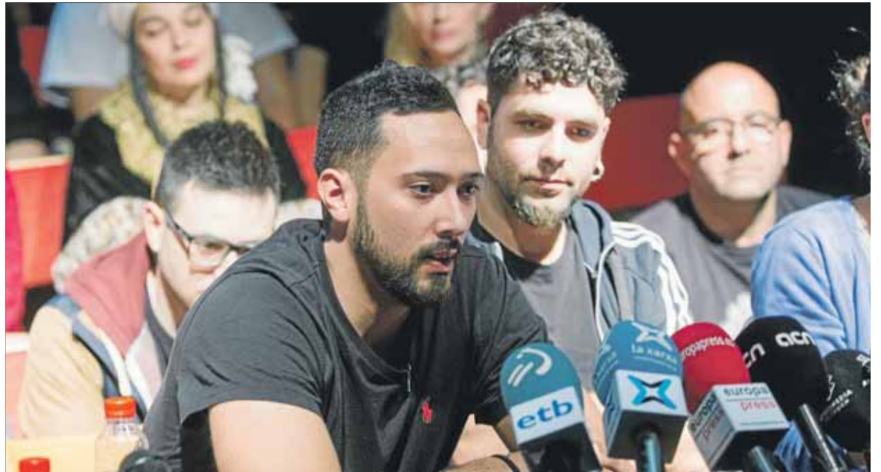
El cantant de rap mallorquí Valtonyc envoltat dels seus companys ahir a l'Antic Teatre del barri de Sant Pere