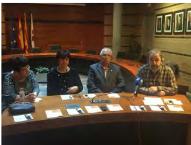
La presentació de la setena edició dels Jocs Florals. Ajuntament de Roses

Cada participant podrà concursar a les categories que desitgi, amb un màxim d'una obra per categoria, tot i que només podrà obtenir un premi. Les obres han de ser originals, inèdites i no poden haver estat premiades en altres concursos. L'extensió ha de ser d'entre 14 i 40 versos i l'estructura mètrica és lliure. Cada poema ha de tenir un títol i ha d'estar signat amb un pseudònim.