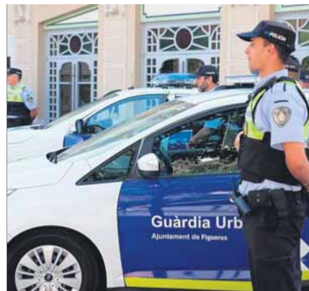
Els nous cotxes substituiran els més antics

■ S'incorporen cinc nous vehicles a la Guàrdia Urbana i un de Protecció Civil