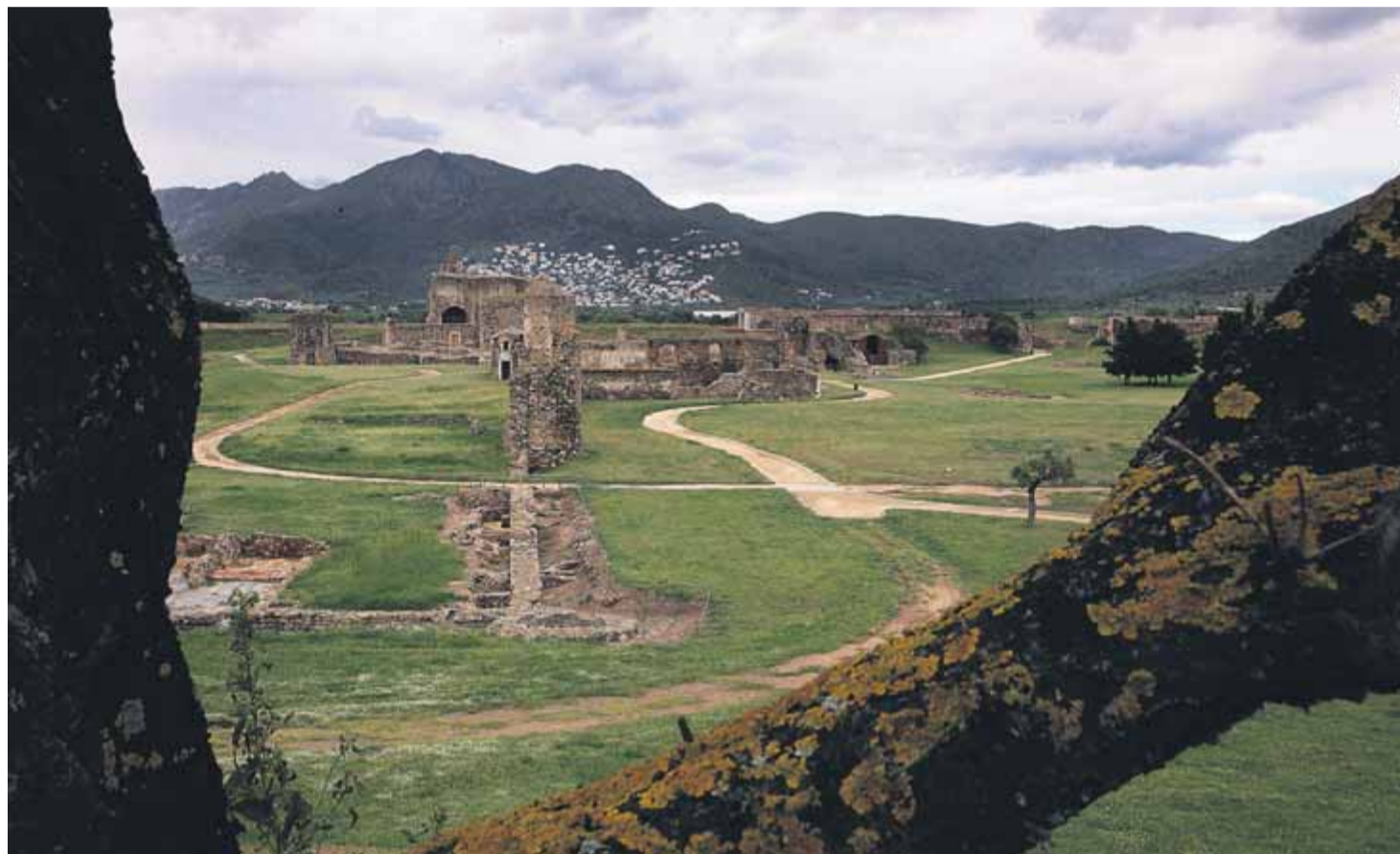
Les restes de la Ciutadella, escenari del setge del 1808 ■ MANEL LLADÓ

En aquell moment, Roses va quedar desolada i sense població; però els habitants que van aconseguir sobreviure encara estaven condemnats a suportar una nova tortura, amb els mateixos atacants però en el marc d'un nou conflicte, l'anomenada guerra del Francès. A principis del mes de novembre del 1808, quan va tenir lloc aquell darrer setge, la guarnició de Roses disposava d'un destacament de poc més de 3.000 defensors; en bona part integrat per miquelets i voluntaris. Els francesos, per la seva banda, es van presentar a la vila amb 13.600 infants, 1.328 genets, 458 artillers i 211 sapadors. El desequilibri de forces era, doncs, notable, i les expectatives de resistir, molt baixes, malgrat el suport del navili Excellent i de dues bombardes de l'armada anglesa des de la badia i el control del fort estratègic de la Trinitat, defen-