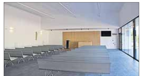
Els espais del nou tanatori mantenen unes línies planes i amb llum natural.