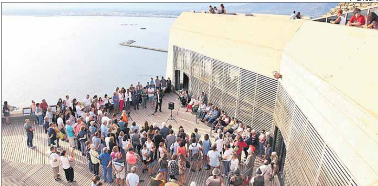
La terrassa principal del castell, amb una espectacular vista, va ser l'escollida per dur a terme els parlaments oficials d'inauguració.