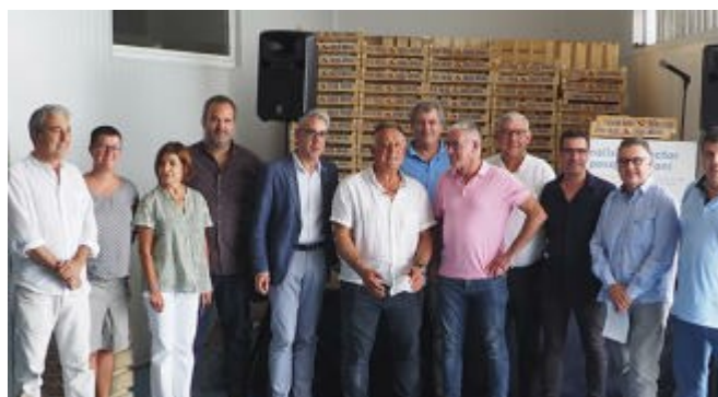
Els pescadors gironins valoren positivament el nou model de gestió

Els pescadors gironins es mostren satisfets del nou model de gestió pesquer un any després de la implantació del Decret de governança de la pesca professional a Catalunya. En una jornada d'anàlisi del sector pesquer gironí que es va fer dissabte a Sant Feliu de Guíxols, el president de la Federació Territorial de Confraries de Pescadors de Girona va ressaltar que la seva implementació havia permès «per primera vegada seure a la mateixa taula de presa de decisions que l'administració, la societat científica i la societat civil amb el mateix poder de decisió». Abad també va ressaltar el «compromís» de l'administració per desenvolupar polítiques conjuntes per millorar l'activitat de la pesca extractiva de la Costa Brava.