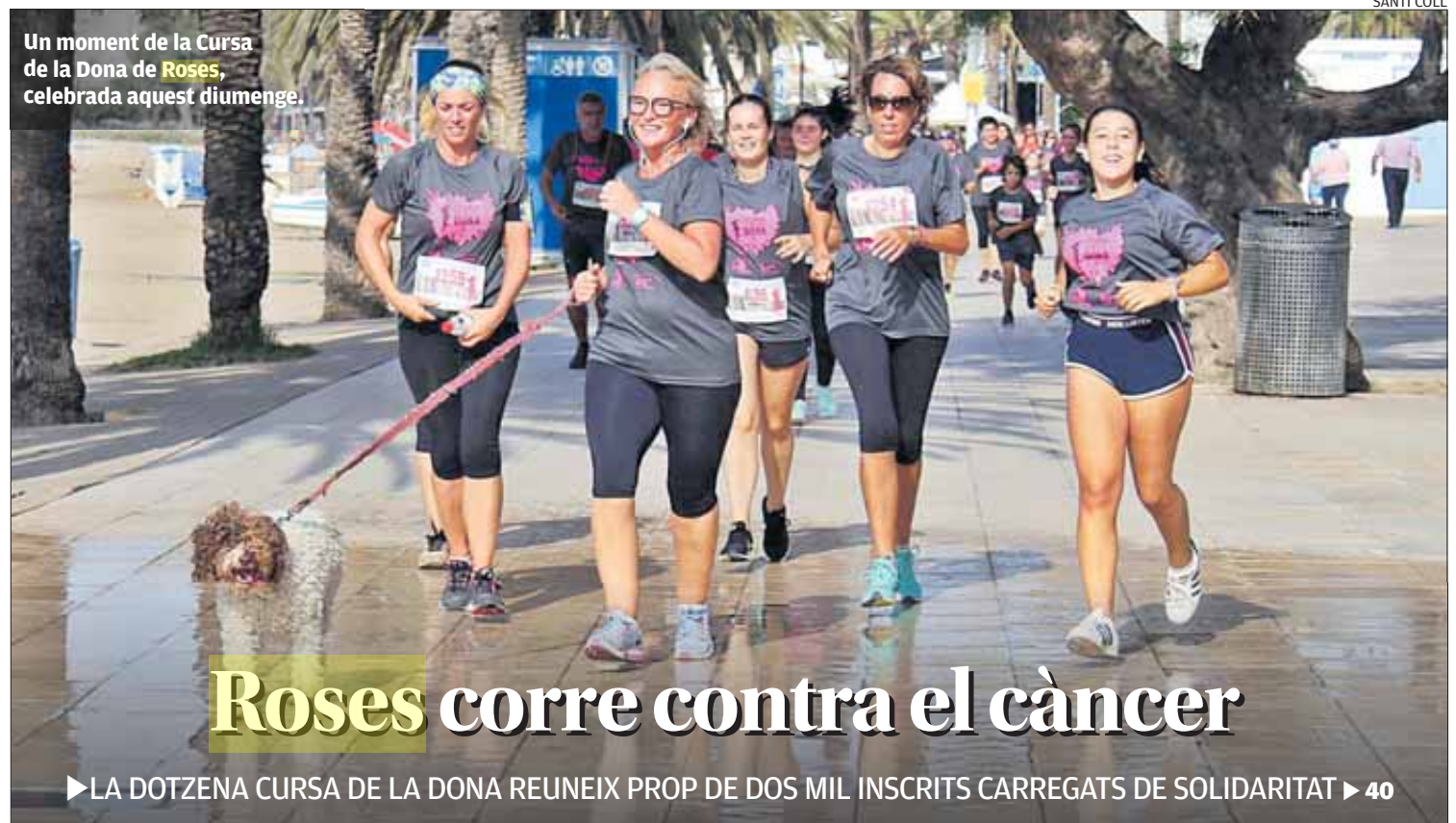
Un moment de la Cursa de la Dona de Roses, celebrada aquest diumenge.