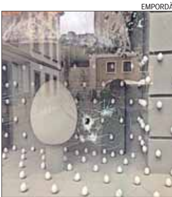
L'aparador va quedar malmès.