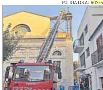
Els bombers hi van treballar.