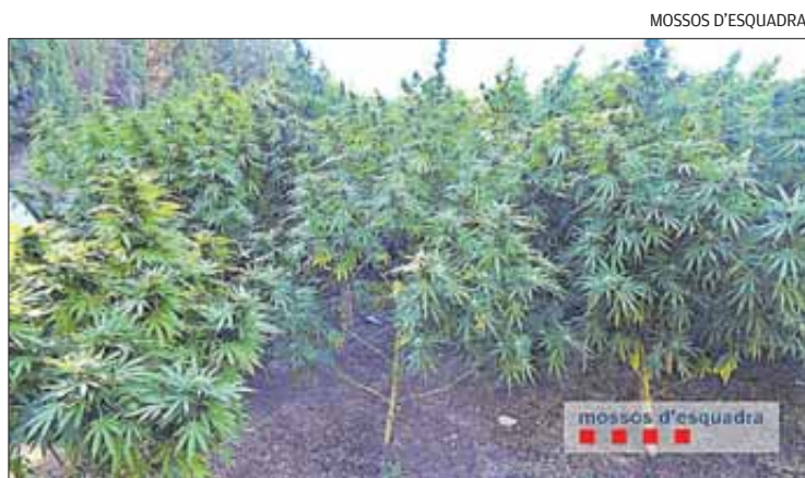
Es troben a la zona del Pla d'Hostalets de Figueres.

agents dels mossos van localitzar una finca a la zona del Pla d'Hostalets de Figueres, on presumptament hi hauria plantacions de marihuana. La unitat d'investigació, encarregada del cas, va dur a terme un escorcoll a la finca el 12 de setembre. Segons estimacions de l'Oficina Central Nacional d'Estupefaents del Ministeri de