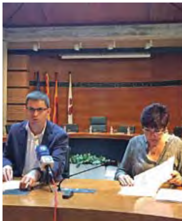
DANÉS I MINDAN. Regidor i alcaldessa

Roses també ha apostat per mantenir les taxes i preus públics