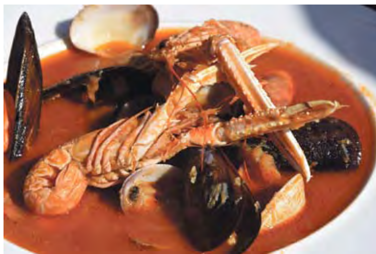
PLAT TÍPIC. Una mostra del suquet que es va cuinar durant la presentació. ÀNGEL REYNAL

amb els requisits determinats, com ara oferir el suquet de peix de forma habitual a la seva carta i cuinar-lo amb peix fresc de Roses, tenir a disposició dels clients vins de la DO Empordà i mantenir l'establiment obert durant un mínim de cinc mesos l'any.