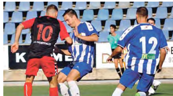
COP D'EFFECTE. El partit es va trencar a partir del primer gol visitant UELA FIGUERES