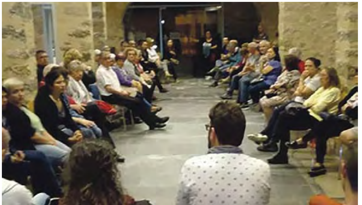
SEGONA REUNIÓ. Es va fer dimarts passat als Porxos de Can Laporta, i hi van assistir una setantena de persones

Per aconseguir-ho, el primer pas ha sigut constituir legalment la Plataforma de Veïns de la Jonquera. Una plataforma que, a partir d'ara, vehicularà diverses actuacions. La primera que han posat en marxa és una recollida de signatures a la qual ja s'han adherit diversos establiments del municipi. Les firmes avalen un manifest en què els veïns de la Jonquera i del Pertús denuncien precisament la inseguretat, referint-se tant a robatoris en cases i locals com a intimidacions personals al carrer, ocupacions d'immobles o tràfic de drogues a plena llum