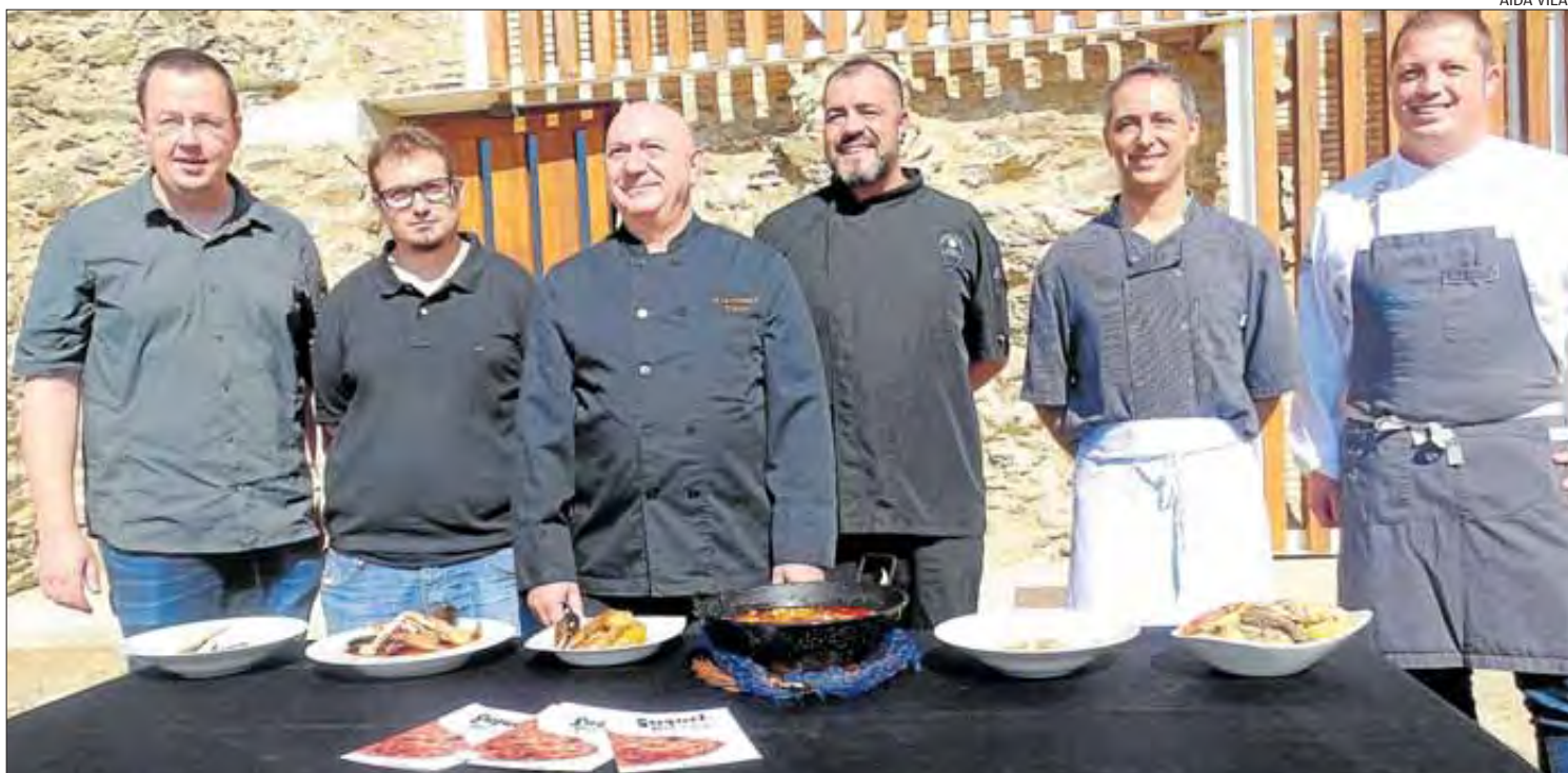
Els cuiners dels restaurants Rom, Bistró de Mar, Ca la Valeria, Pika Pika Beach, Roc-Fort i Falconera, amb els seus plats de suquets de peix.