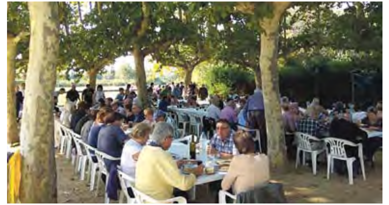
VILABERTRAN. L'Ateneu Republicà de l'Alt Empordà hi va organitzar una botifarrada