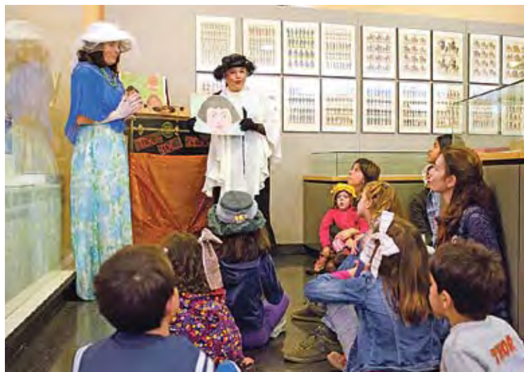
PER A TOTA LA FAMÍLIA. Una activitat al Museu del Joguet de l'any passat HORA NOVA

■ Una trobada d'instagramers, un partit de futbol botons, una ruta de descoberta per conèixer els moments clau de la història de Figueres i entendre la Figueres actual, un passeig per la història del joc, una visita guiada a la Casa-Museu Salvador Dalí de Portlligat per descobrir tots els secrets de l'artista surrealista empordanès, un taller d'arqueologia que endinsa els participants en la vida dels antics habitants d'Empúries, un concert de la formació Giorchestra Quartet o una degustació d'anxoves. Aquestes són algunes de les propostes que es