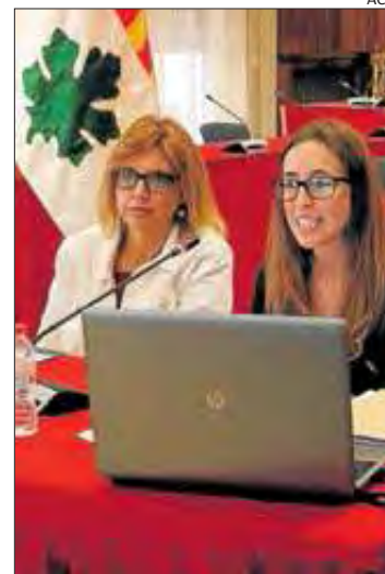
L'alcalde, durant l'acte.

El consistori va contractar fa uns mesos la consultoria Ingeniería Social, que està ultimant una diagnosi que ha de servir per redactar el pla. Entre els àmbits a millorar hi ha per exemple la gestió dels recursos humans o la contractació, mentre que en d'altres com serveis socials i la cultura ja