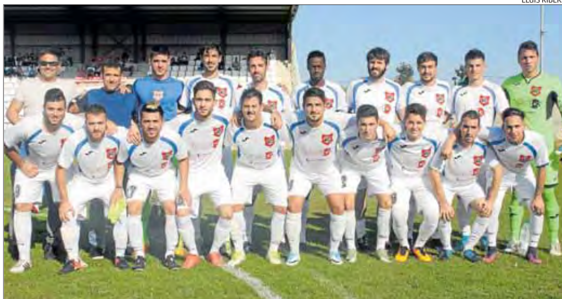
El Marca de l'Ham -abans de perdre el duel contra el Bescanó- està tranquil en l'any de l'ascens a Segona.

Roca impedeix puntuar a la Marca D'altra banda, el Marca de l'Ham és setè de Segona Catalana, en l'any del debut, malgrat perdre davant el Bescanó el diumenge (0-1). El nou segon classificat del grup es va emportar els tres punts de Figueres gràcies a un gran gol de falta del vilafantenc Pep Roca en el minut 12. El conjunt d'Edu