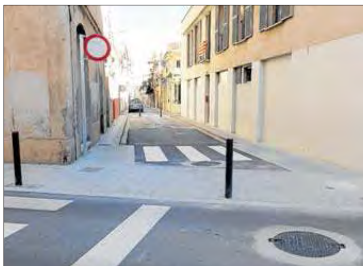
El carrer Pi i Margall, pacificat i sense circulació.

A més, amb la modificació vial, la plaça del Gra ha perdut un dels carrers d'accés: el del carrer Sant Francesc de Paula. Aquest connectava en línia recta el carrer dels Fossos -a la zona de la plaça de