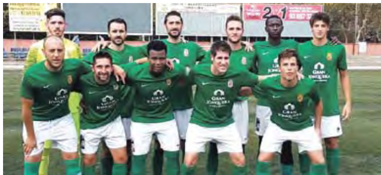
LA JONQUERA. Els fronterers, en una imatge d'aquesta temporada UELA JONQUERA