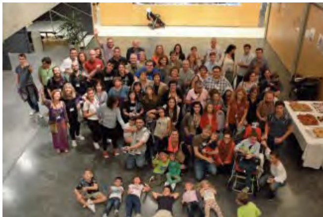
Participants en el congrés EMPORDA.INFO

Roses va acollir dissabte el primer congrés a nivell estatal sobre la Síndrome de Moebius, durant el qual especialistes mèdics van parlar entorn les variants de la síndrome, o Moebius Plus, terme que s'afegeix quan es parla dels múltiples efectes clínics d'aquesta malaltia neurològica extremadament rara. En aquests casos, els nervis cerebrals afectats s'estenen més enllà dels sisè i setè nervis cranials, els quals provoquen paràlisi facial i manca de moviment lateral dels ulls. El Congrés va aconseguir sobradament el seu objectiu, posar en contacte familiars i afectats amb els millors especialistes de l'estat espanyol sobre la Síndrome de Moebius.