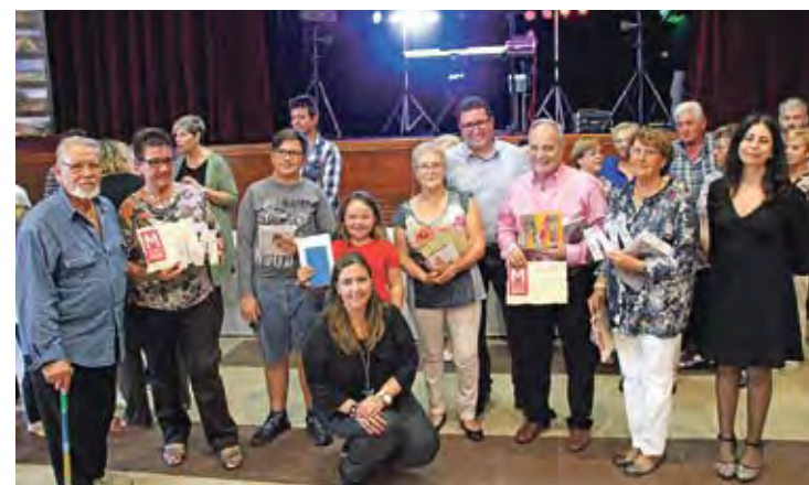
PREMIATS. Els guanyadors de la 26a edició de la mostra gastronòmica