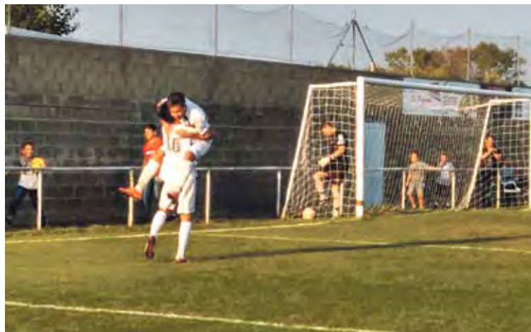
PARTIT AJORNAT. La Marca es va imposar dijous al Palafolls (2-0) HORANOVA

■ L'Escala va perllongar una jornada més la seva capacitat d'equip invicte després de neutralitzar diumenge el Girona B (0-0), equip que fins ara ho havia guanyat tot. Per la seva banda, la Marca del Ham, que dijous va superar el Palafolls en el partit ajornat de la primera jornada (2-0), va cedir diumenge davant del Bescanó (0-1), mentre que dissabte el Roses va perdre un disputat partit contra el Palafolls (2-1) i baixa fins a la catorzena posició. ■