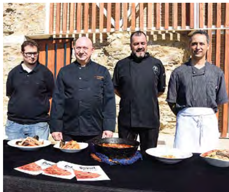
RESTAURADORS. Una mostra dels professionals participants. ÀNGEL REYNAL