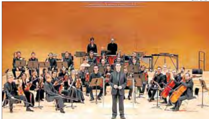
Els caps de corda de la GIOrquestra actuaran a l'Alfolí de la Sal.

Les activitats del Som Cultura s'iniciaran el 4 de novembre amb la trobada d'instagramers #InstaSomCultura, que tindrà lloc a Figueres i que inclourà un circuit fotogràfic guiat per la ciutat, tot descobrint els racons i els espais on persisteix la memòria daliniana, la visita al Museu del Joguet de Catalunya i al Museu Dalí. En total s'hi celebren activitats a set municipis empordanesos: Figueres, l'Escala, Roses, Castelló d'Empúries, la Jonquera, Darnius i el Port de la Selva (Sant Pere de Rodes). Entre altres, hi participen la Fundació Dalí, el Museu del Joguet, el MUME de la Jonquera, MAC Em-