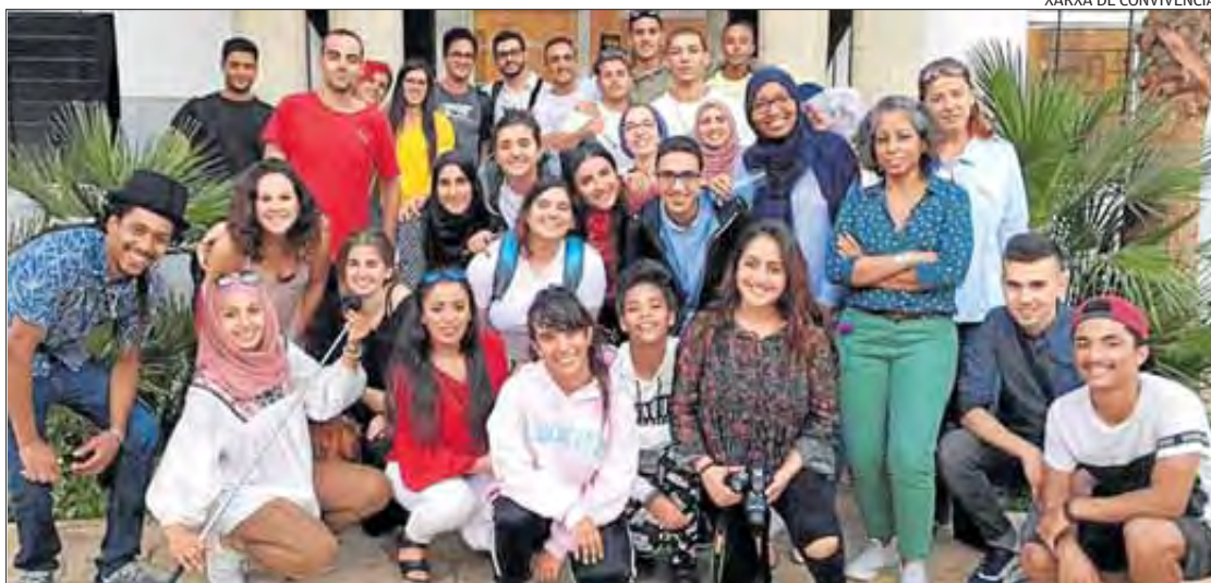
Els joves s'han endinsat en la realitat cultural del Marroc i han compartit experiències amb joves d'allà.

En aquesta 5a edició, Cultures en Xarxa ha tornat a comptar amb el suport de la Fundació Hassan II, que després de comprovar l'èxit dels darrers quatre anys, ha