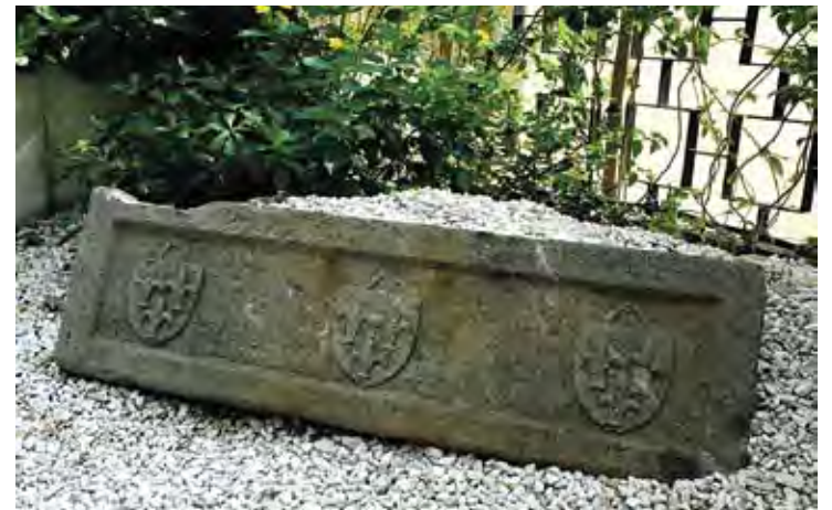
DE GRAN VALOR. La peça arqueològica s'ha cedit en règim de comodat HORA NOVA