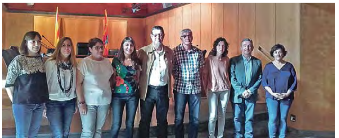
CONVENI DE COL·LABORACIÓ. Es va signar dimarts a la sala Gòtica de l'Ajuntament de Castelló d'Empúries

Aquesta iniciativa va néixer amb la voluntat de donar resposta, d'una manera integrada i comunitària, a les necessitats educatives dels infants i joves, coordinant i dinamitzant l'acció educativa més enllà de l'àmbit escolar. Per aconseguir-ho, s'han