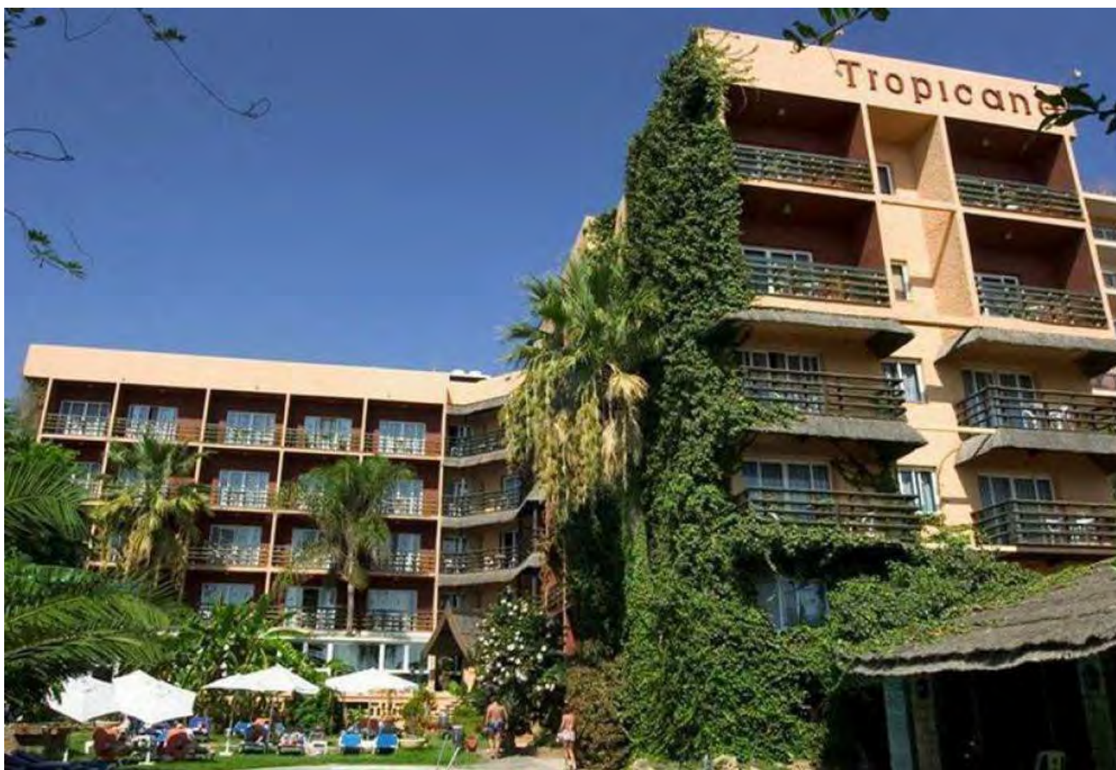
Hotel Tropicana Torremolinos (Málaga), uno de los activos de Elaia