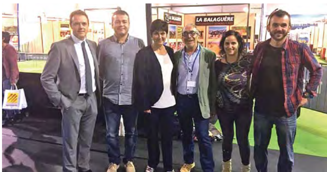
PROMOCIANT EL TERRITORI. Diversos regidors i tècnics, a la fira de la Catalunya Nord

La idea és optimitzar les estructures de promoció del senderisme, el cicloturisme i les activitats aquàtiques que ja estan consolidades i posicionar-les perquè afavoreixin el creixement econòmic i territorial. En aquest sentit, es potenciarà el sender litoral GR-