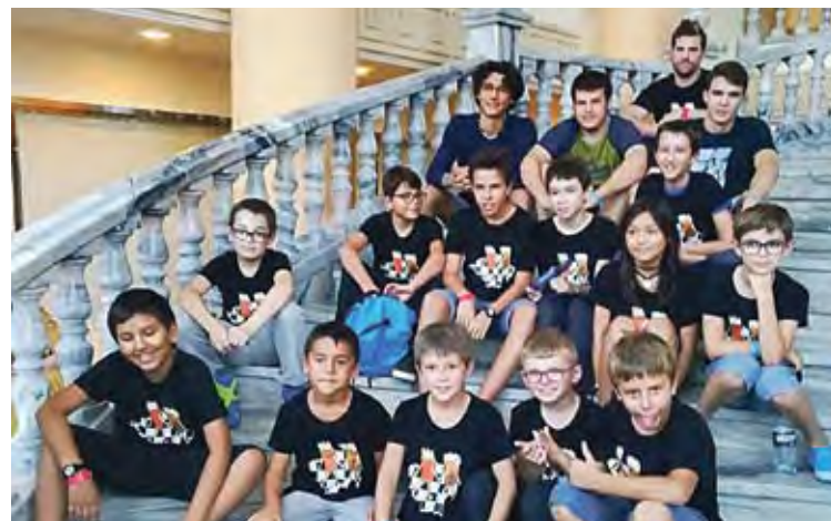
CE ALT EMPORDÀ. Els escaquistes del CE Alt Empordà a La Pineda

Per la seva banda, l'equip sots-12 B va finalitzar en una meritòria 13a posició, mentre que l'equip de categoria sots-8 va acabar 6è, a només un punt del podi. Unes categories per sobre, l'equip de sots-18 va firmar un paper discret a terres tarragonines i va cloure el torneig en la 8a posició. ■