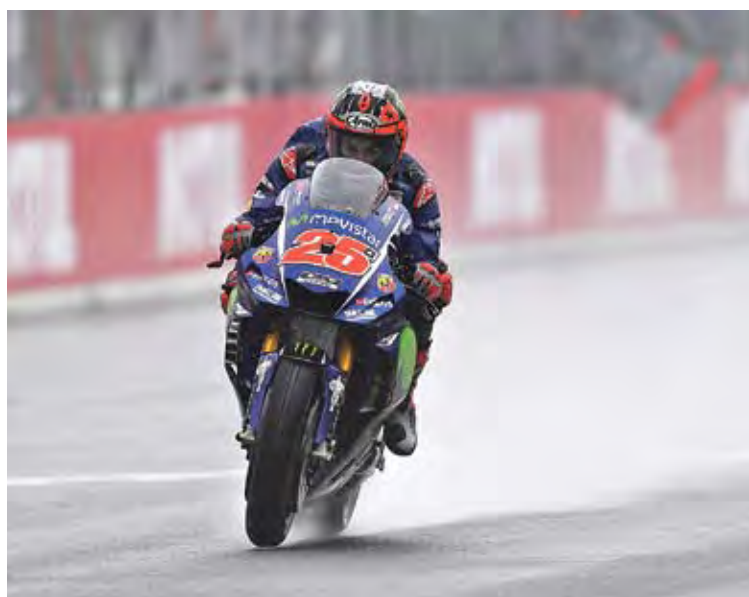
CONTEXT COSTERUT. Només falten 75 punts per disputar-se MOVISTAR YAMAHA

A Motegi, les condicions meteorològiques no van acompanyar al pilot alt-empordanès. Ni el temps, ni tampoc la mecànica, on els problemes de tracció el van frenar durant la qualificació i el van situar en una poca esperançadora catorzena posició de la graella. Un context massa complicat per afrontar