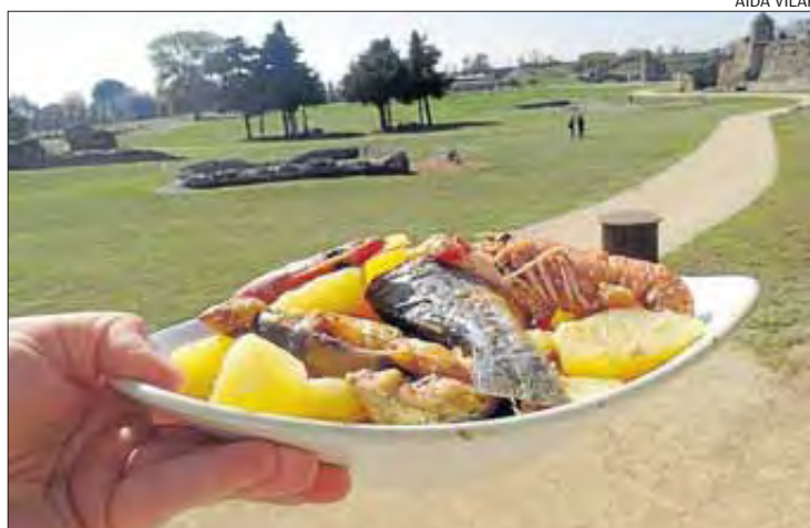
El suquet de peix és el plat que sempre ha acompanyat la vila de Roses .

La campanya de promoció del suquet de peix fa anys que està en funcionament, ja que l'Ajuntament de Roses , l'Oficina de Turisme i els diferents cuiners del municipi treballen conjuntament per promocionar-lo. Amb aquesta campanya en concret, però, on cada establiment participa amb la seva proposta gastronòmica, es vol reconèixer tant la qualitat d'aquest producte autòcton com la categoria dels restauradors locals, amb la seva capacitat d'innovació a l'hora de fer front a aquest