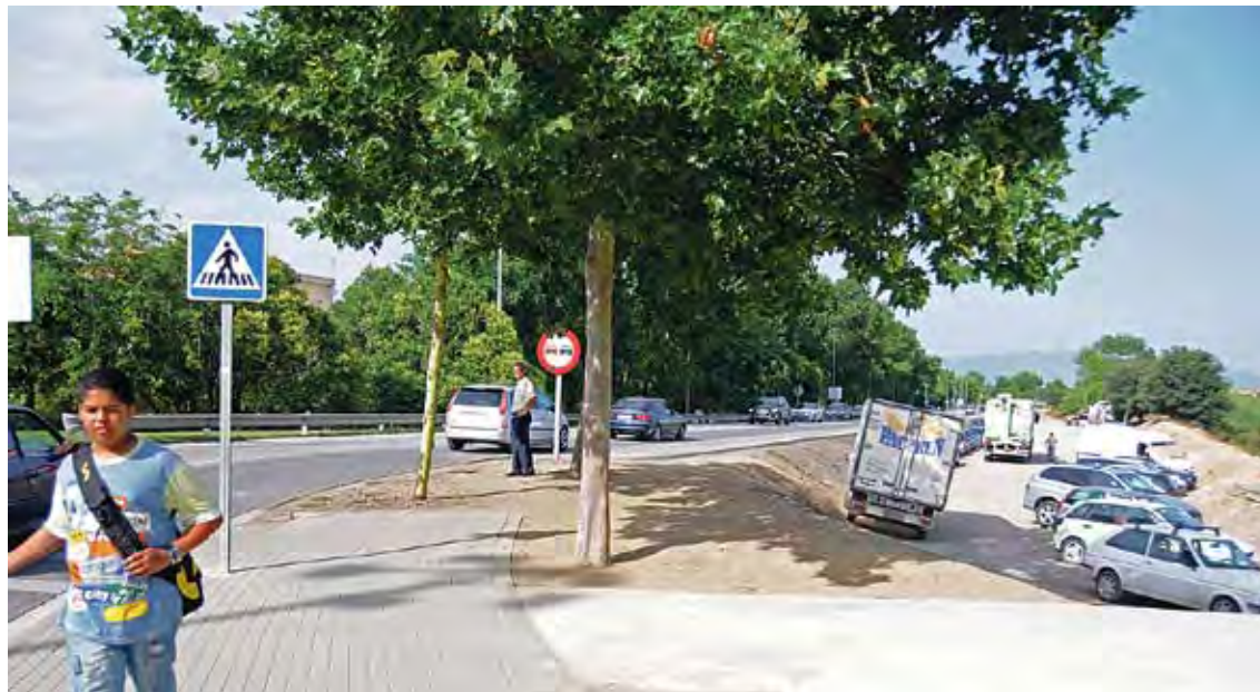
EL SOLAR. És al costat de la plaça El-líptica i a tocar de l'N-260, l'anomenada carretera de Llançà

Els terrenys són a tocar de la carretera de Llançà, l'N-260 i a prop de la plaça El-líptica. La seva ubicació permet als vehicles estacionar fora del rovell de l'ou de la ciutat, però a la vegada molt a prop.