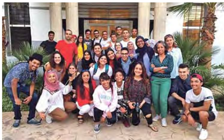
PARTICIPANTS. Una vintena de joves han donat suport al projecte

Els objectius del projecte Cultures en Xarxa són treballar valors humans com el respecte, la solidaritat, la tolerància o la companyonia, i fomentar aquests valors