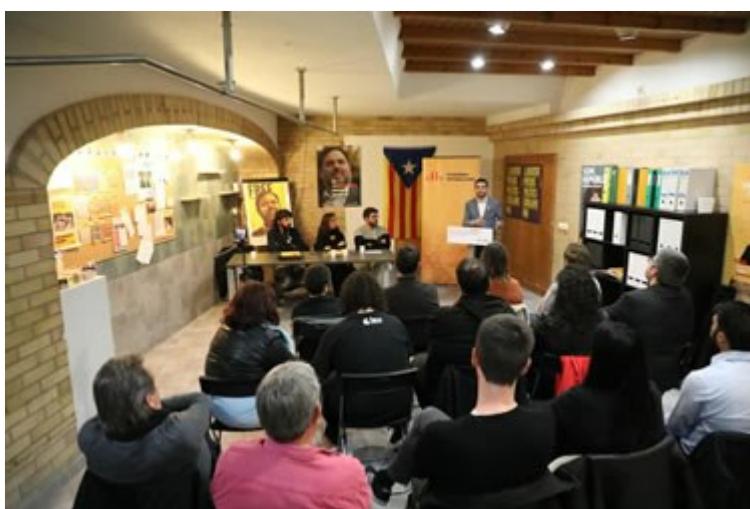
Un moment de la 8ª i última Informativa Pública d'ERC Roses d'aquesta legislatura

Un dels compromisos que la candidatura d'Esquerra Republicana de Roses va contreure amb la ciutadania durant les eleccions municipals de 2015 va ser la de crear espais de trobada per explicar públicament la feina desenvolupada com a principal grup a l'oposició a l'Ajuntament. Un espai de trobada amb la finalitat, també, d'atendre les preguntes, comentaris o reclamacions dels vilatans.