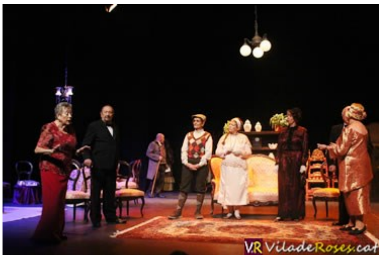
Una escena de 'Gente bien', obra representada per la companyia de Jubiteatre de Roses

Obra que estrena la companyia Jubiteatre de Roses, obra que esdevé tot un èxit d'assistència de públic. I és el que va passar el passat dijous (i amb una segona sessió divendres) al Teatre Municipal amb l'estrena de 'Gente bien'. Una obra, la cinquena funció d'aquesta companyia