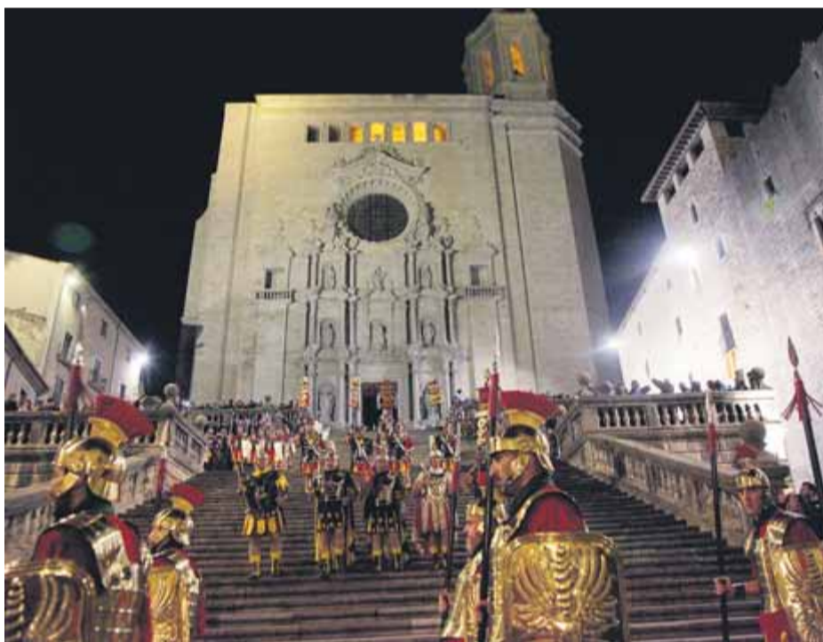
Els descens del maniple de manaies de la catedral, l'any passat

Demà al vespre, diverses poblacions renoven tradicions en un dels dies més solemnes de Setmana Santa