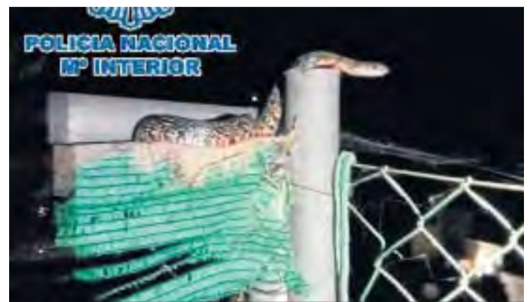
La serpiente atrapada por la Policía.

En los hechos probados, se señala que ambas mujeres cayeron al suelo durante el forcejeo pero la acusada siguió pinchándola, pese a la intervención de un policía fuera de servicio. Como consecuencia, la víctima sufrió lesiones en ambos brazos y la espalda. La procesada ya le ha indemnizado con 4.000 euros.