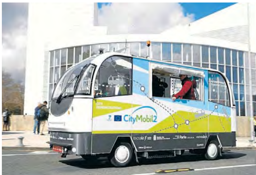
Un bus autònom similar al vehicle que entre el setembre i l'octubre farà la prova pilot.