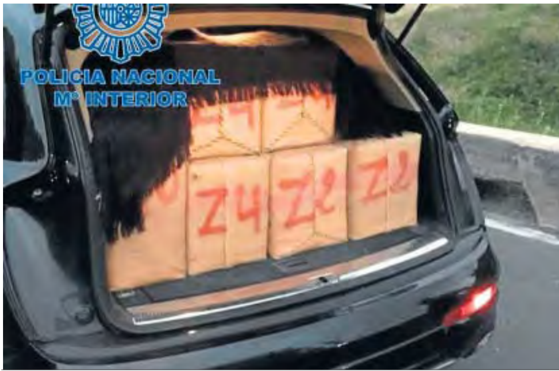
Los investigadores hallaron la droga en 20 fardos tapados con mantas negras.