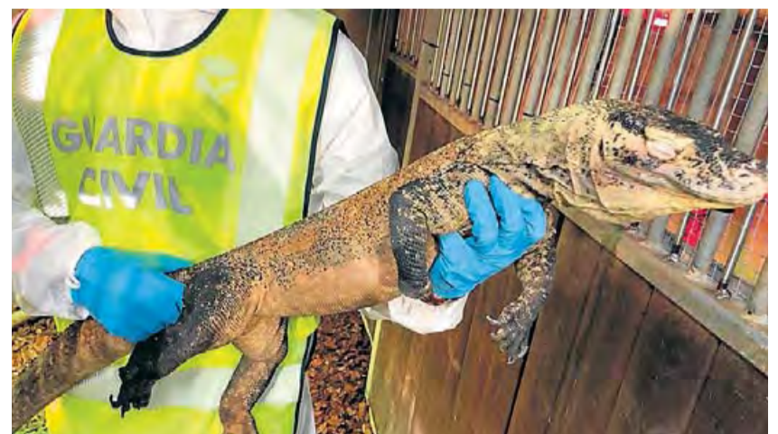
Exemplar comissat per la Guàrdia Civil del dragó de Komodo a Cornellà de Llobregat.

L'home, arrestat el 5 de juliol, també tenia una vintena de serps, llangardaixos i un escorpí. La majoria dels intervinguts són rèptils protegits pel Conveni del Comerç Internacional d'Espècies Amenacades de Fauna i Flora Silvestres. Pel que fa al dragó, l'espècie és natural d'Indonèsia i es troba en quarantena al terrari de rèptils i amfibis del Zoo de Barcelona, segons va explicar a l'ARA el conservador d'aquesta unitat, Manel Aresté, a