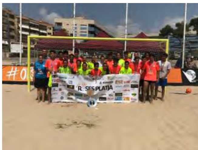
El Roses Platja celebra el títol cadet i el segon lloc juvenil i sènior femení

El Club d'Esports i Lleure Platja de Roses va obtenir, el cap de setmana, un títol de campió i dos sots campionats en els Campionats de Catalunya de futbol platja que es van celebrar a la platja de la Paella de Torredembarra (Tar ragonès). La primera posició va anar en mans del cadet masculí, que va revalidar el títol després de desfer-se del Platja Vilanova B a la final (3-2).