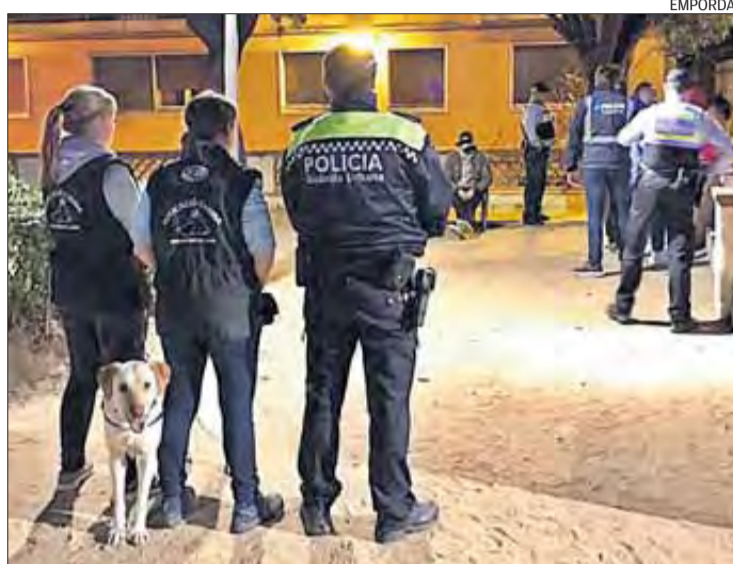
Una de les actuacions policials s'ha centrat als Jardins Enric Morera.

■ Dos gossos ensinistrats per a la detecció d'estupefaents van intervenir per primera vegada en un operatiu de seguretat a Figueres. La Guàrdia Urbana va desplegar un operatiu en tres zones de Figueres, el passat divendres, 15 de març, a la nit, acompanyats dels dos animals i dels seus guies canins. Es van inspeccionar quatre establiments públics, i es van fer identificacions a una trentena de persones a la Marca de l'Ham, a la plaça de l'Estació i als Jardins Enric Morera. La jornada es va tancar amb la detenció d'una persona que estava en crida i cerca, i la denúncia a vuit persones per tinença d'estupefaents, i tres per consum d'alcohol a la via pública.