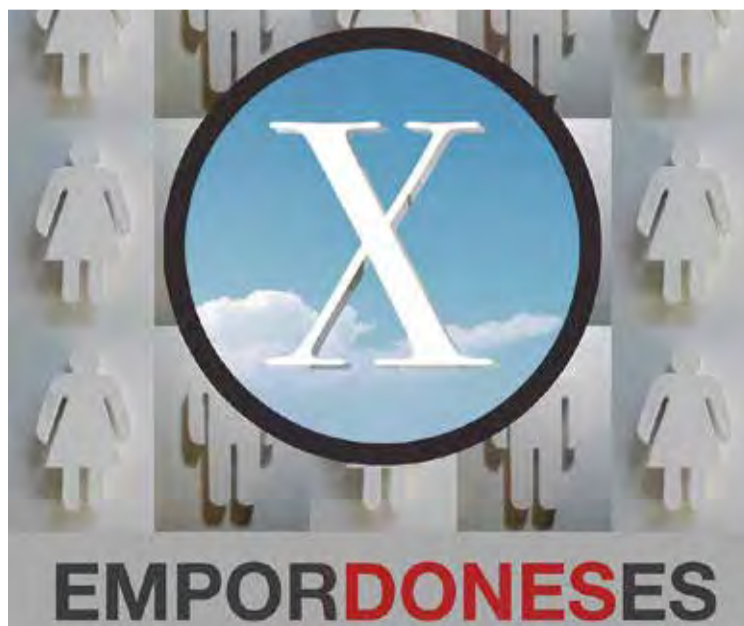
EL CARTELL. És obra d'Esther Julià

PROPOSTES DE PETIT FORMAT. Per complementar el cicle, es duran a terme altres propostes de petit i mitjà format. Per començar, el 5 d'abril, el Museu de l'Empordà organitzarà una activitat amb estudiants de primària de la comarca al voltant de l'obra d'Àngeles Santos. Durant el mes de juny, el