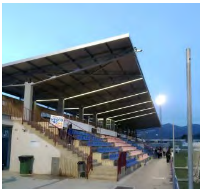
La nova coberta de l'Estadi Municipal.

La coberta que resguardava fins ara el públic de l'Estadi Municipal de Roses de les inclemències del temps, de 720 m2 de superfície, consistia en una placa simple de fibrociment tipus ona sense aïllament interior, que presentava problemes d'entrades d'aigua per falta d'estanqueïtat i pel trencament de diversos materials de la coberta. Alguns elements també patien signes d'oxidació.