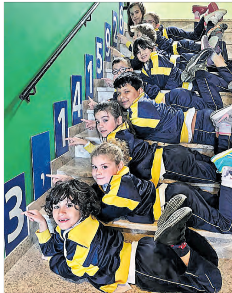
Un grup d'alumnes, indicant les xifres del número pi.

Al centre lloretenc, el Dia Pi va començar identificant els escolars amb el símbol \pi , que se'ls va marcar amb un tampó. A primera hora, es va fer una fotografia amb els integrants de la comunitat educativa del col·legi Immaculada Concepció que van néixer un 14 de març: tres alumnes i una mestra. Una altra proposta va consistir en una caminada de 3,14 quilòmetres per als escolars del cicle inicial i mitjà de primària, que va ser una cursa per als seus companys més grans, del cicle superior i de secundària obligatòria. Els uns i els altres duïen un dorsal dissenyat per dues alumnes de sisè de primària. Després de l'activitat física, l'escola va organitzar un esmorzar « \pi ».