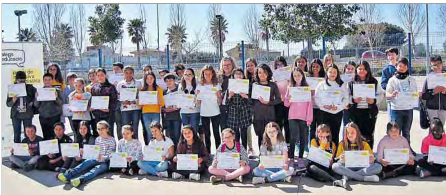
A dalt, els estudiants de 3r d'ESO i, a baix, els alumnes de 6è de Primària, que opten als Premis de Narrativa Periodística Diàlegs d'Educació.