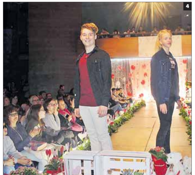
► ACTIVITAT BENÈFICA emmarcada en una assignatura que té com a finalitat fer un servei a la comunitat. 1 El Teatre Municipal de Roses s'ha transformat en una passarel·la. 2 3 4 Els alumnes han fet de models, han triat la roba, han buscat maquilladors i perruquers i han seleccionat les músiques.