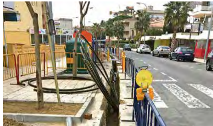
SANTA MARGARIDA. És on van començar els treballs, la setmana passada HORA NOVA