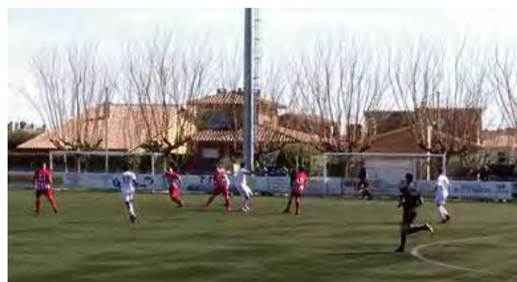
MARCA DE L'HAM. Els figuerencs, en una imatge d'arxiu d'aquest curs UE MARCA DE L'HAM

Amb aquest resultat, els blau-grana recuperen el liderat del grup 1 de Segona Catalana, després que el Guíxols, el fins ara líder, no passés de l'empat al camp d'un bon Base Roses. Els rosincs, no obstant això, continuen en posicions de descens.