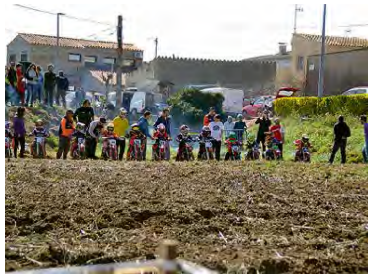
PARTICIPANTS. La prova va acollir motoristes de totes les edats