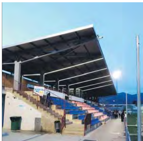
El nou aspecte de la coberta de l'estadi municipal de Roses

La cobertura de fibrociment de 720 metres quadrats era una simple placa de tipus ona sense aïllament interior i que, des de feia temps, presentava problemes d'entrades d'aigua per falta d'estanquitat i pel trencament de diver-