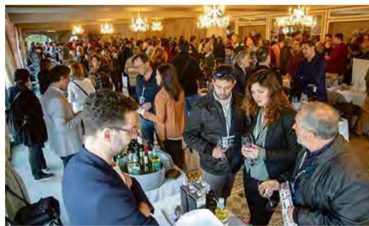
MOSTRA. Es va fer a la Farinera de Sant Lluís