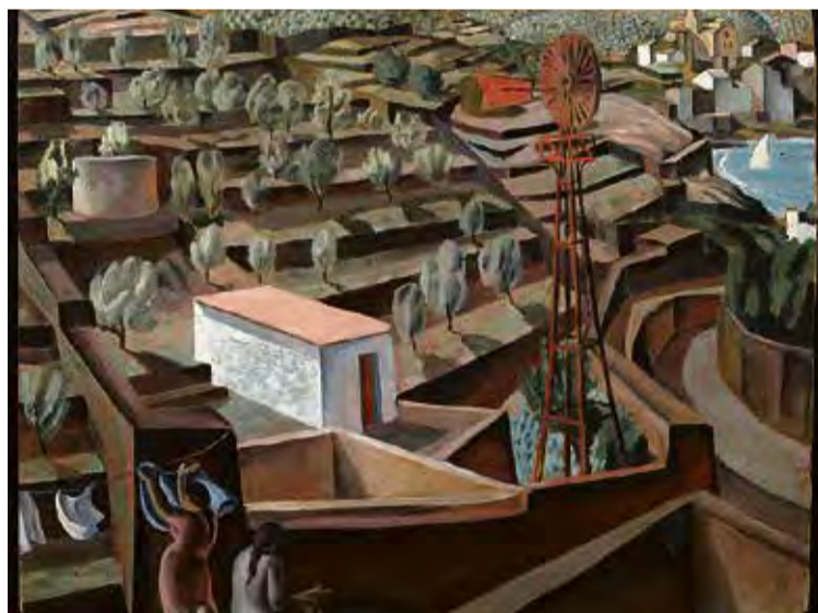
'EL MOLÍ. PAISATGE DE CADAQUÉS'. Tremp i oli sobre cartró (c. 1923) FUNDACIÓ GALA-DALÍ

■ La Fundació Dalí amplia el fons amb la recent compra d' El Molí. Paisatge de Cadaqués , un tremp i oli sobre cartró del 1923. La peça, que prové d'una col·lecció particular i s'havia vist en comptades ocasions, parla d'un Salvador Dalí aprenent de pintor, vora els dinou anys, que experimenta i busca un estil propi. En aquest cas, explora un cubisme primerenc. El quadre restarà al Castell de Púbol fins al 2 de juny, quan s'inaugurarà l'exposició temporal d'enguany. A partir de llavors, El Molí es podrà veure al Teatre-Museu de Figueres. ■