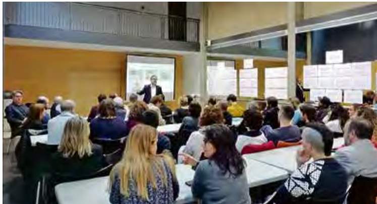
JORNADA. La sessió va tenir lloc al Teatre de Roses

El desenvolupament de la sessió estava estructurat segons el resultat de quatre taules de tre-