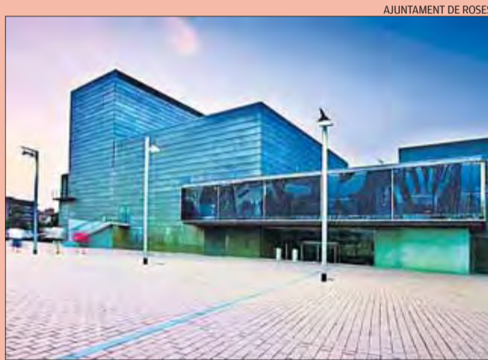
► Teatre Municipal de Roses. Seu de la celebració de la primera edició d'eWoman Empordà, el dijous 4 d'abril. Aquest espectacular edifici va merèixer el Premi FAD 2003 d'arquitectura.

La jornada eWoman Empordà està organitzada pel SETMANARI DE L'ALT EMPORDÀ i Prensà Ibèrica i compta amb el suport del Grup Terraza, l'Ajuntament de Roses, Autopodium Volkswagen, Engel & Völkers, Fricash, la Universitat de Girona, la Diputació de Girona, l'Associació