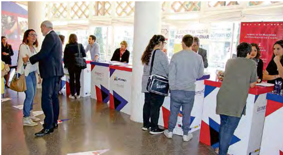
Les ofertes laborals es podran consultar també a www.treballemgi.cat/altemporda HN

La primera edició del certamen es farà el pròxim dijous, 28 de març, al Convent dels Caputxins de Figueres. L'horari serà de 9 a 14 h