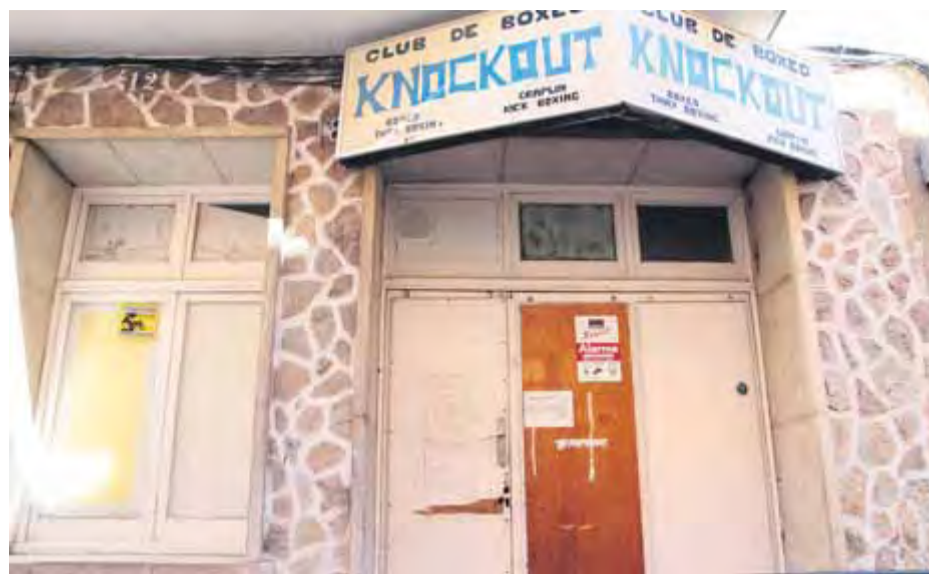
El local del club cannàbic, a la travessia Barceloneta, que el consistori ordena tancar

El consistori, però, va exigir que hi hagués "declaració de responsable d'activitat innòcua", per