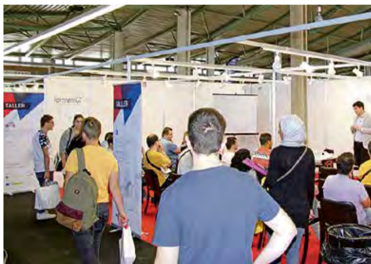
La fira estarà oberta de les 9 a les 14 h HORA NOVA

LES EMPRESSES. Hi participaran empreses de sectors diversos i representatius de les comarques gironines com el sociosanitari, de comerç, construcció, turisme, assegurances... Entre el llistat d'aquestes hi ha: Aldi Supermercats, Artris Serveis Socials, Big Bang Figueres, Boats Mediterrani, Càmping Punta Milà - Càmping Sant Pol, Carrefour Centres Comercials, Clean Deal, Condis Supermercats, Construccions Metàliques Espolla, Decathlon, Fundació Privada Hospital Santa Llúcia, Fundació Salut Empordà, Fundesplai, Gastrònoms, Hotel San Carlos, Hotel Torremirona, Limpio,