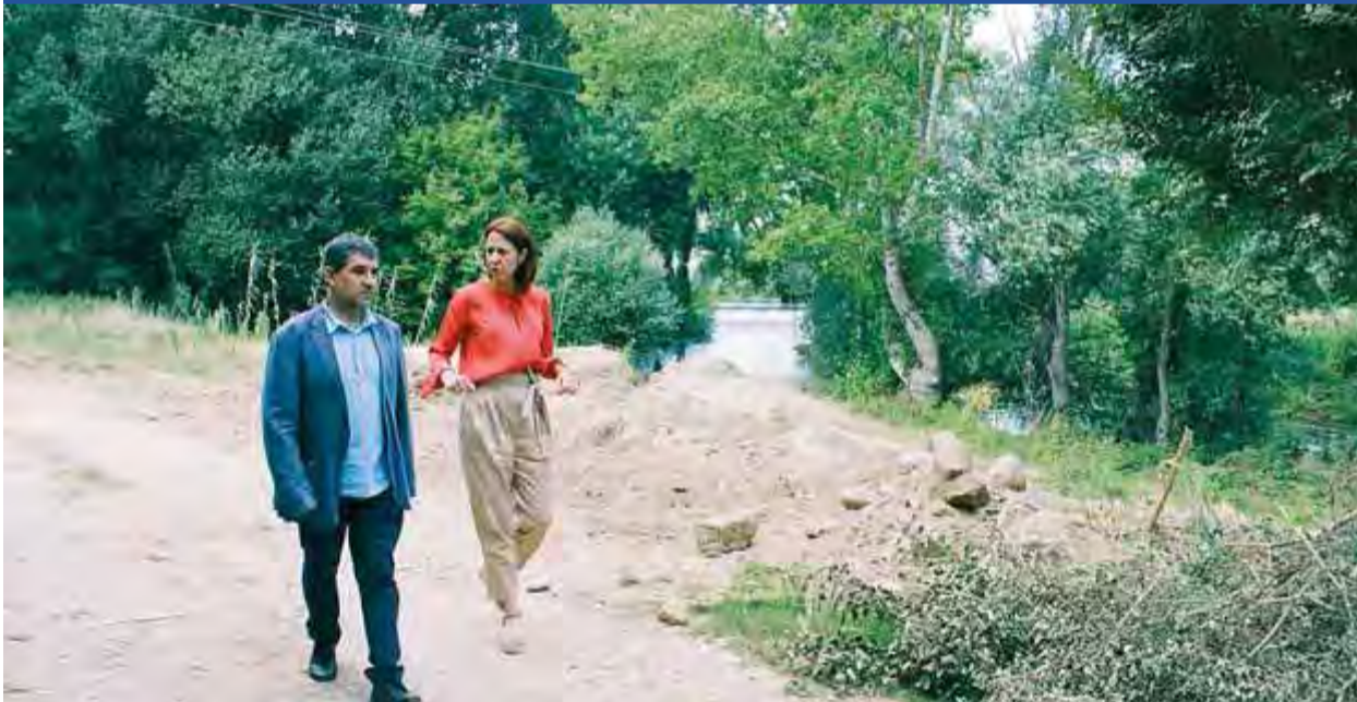
L'alcaldesa i el regidor d'Urbanisme, passejant per la zona riberenca que s'està condicionant per al carril bici

EXPECTACIÓ • Continua el silenci administratiu sobre si calen els permisos d'obra i de Patrimoni per tal d'obrir la cripta