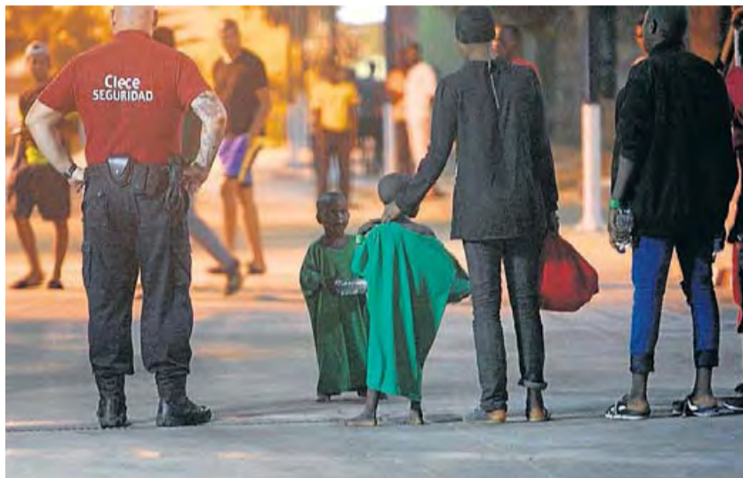
Trasllat de 26 dones i cinc nens de les illes d'Alhucemas, de sobirania espanyola i situades davant del Marroc, a Melilla fa tres dies.

Per a Zoido, el govern espanyol està fent “tot el possible per ajudar”, però té “la responsabilitat que té” en aquest assumpte. Segons les dades d'Interior, en el primer semestre d'aquest 2017 han arribat més del doble d'immigrants irregulars a l'Estat que durant el mateix període de l'any passat. La xifra ascendeix a 10.751 persones indocumentades que van arribar per mar i terra al territori espanyol. Només al juny, un total de 2.189 immigrants van intentar travessar l'Estret amb fins a 84 pasteres.