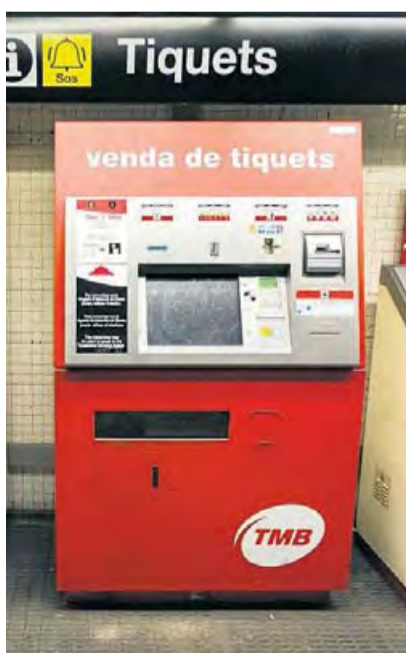
Màquina de venda de bitllets del metro durant l'avaria tècnica, ahir a la parada d'Urgell.

Per reparar l'avaria, els tècnics van actuar en els servidors del siste-