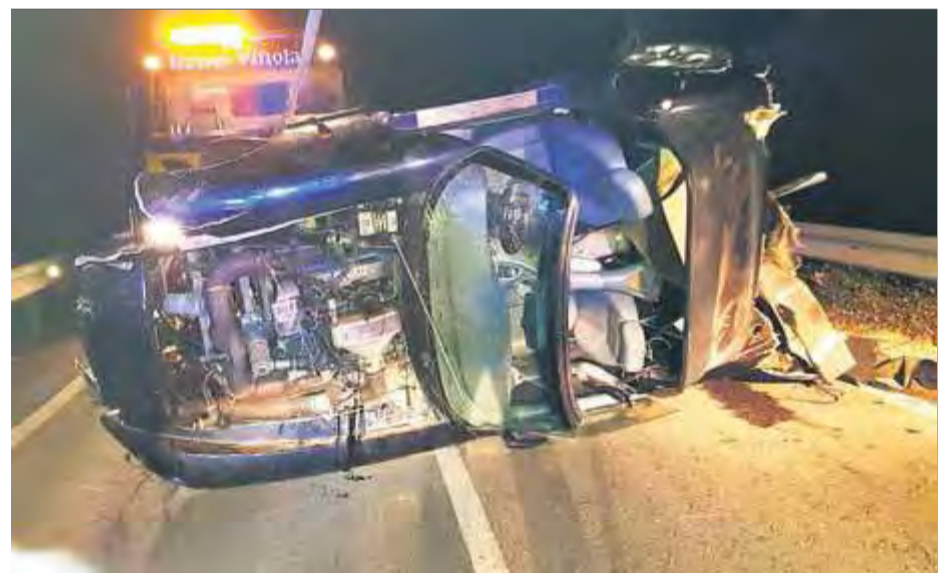
El sinistre que es va produir a l'avinguda Països Catalans de Calonge

Fins a la zona s'hi va adreçar inicialment la policia local de Calonge, que va donar l'avís als Mossos d'Esquadra per tal que s'encarreguessin de l'aterrat. Hi van acudir quatre