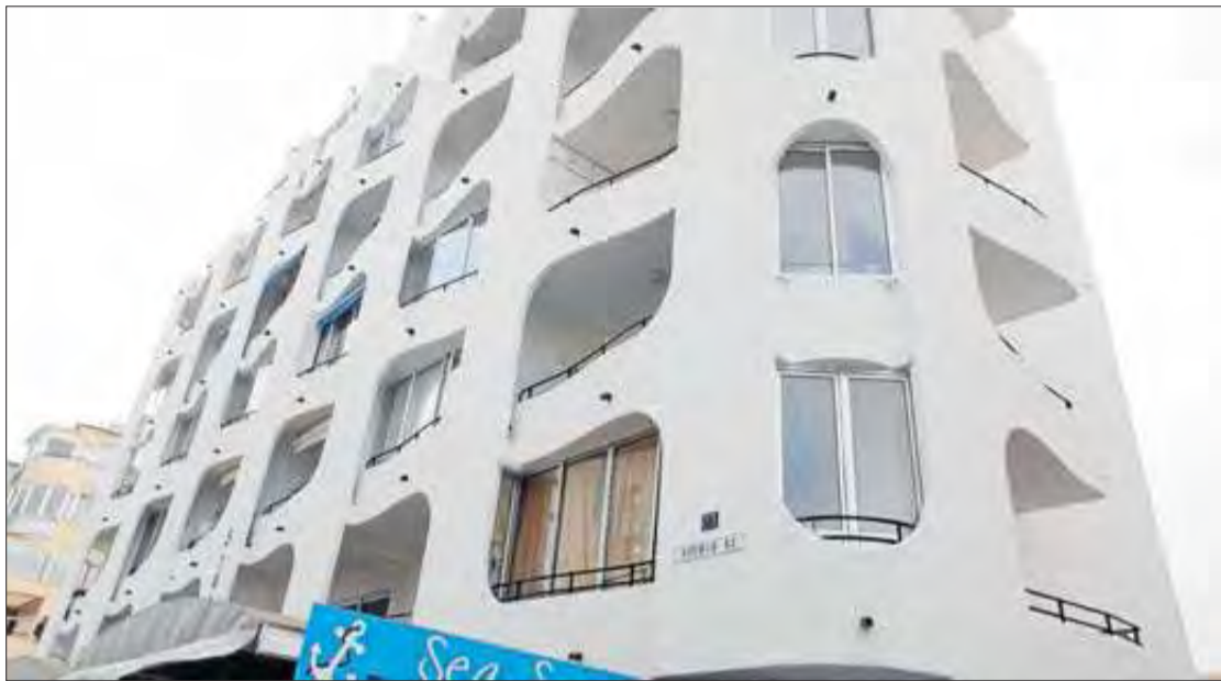
El segon crim de l'any a les comarques gironines va tenir lloc als apartaments Estudio 42, ubicats a la urbanització de Santa Margarita de Roses. ROSANA VIDAL