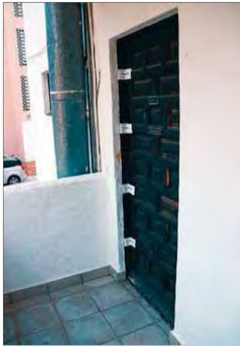
La porta de l'apartament precintat. A la dreta, els tècnics de la funerària s'enduen la víctima

Investigació oberta per la mort d'un veí de Roses a qui van trobar amb signes clars d'haver mort de manera violenta al pis on vivia: una sola ganivetada al cor. Els fets es van descobrir ahir pels volts de les tres de la tarda, quan un veí del carrer Gola de l'Estany va entrar al pis que compartia amb la víctima i va trobar l'home ensangonat i immòbil. Immediatament va alertar als serveis d'emergència. Fins al lloc dels fets es van desplaçar patrulles de la Policia Local de Roses, Mossos d'Esquadra i sanitaris del Sistema d'Emergències Mèdiques (SEM). Quan van entrar a l'immoble van localitzar el cadàver enmig d'un bassal de sang. A partir d'aquí es va iniciar una investigació per trobar el o els responsables de la mort. La tasca va durar ben poc, perquè al cap de poc més d'una hora un home es va presentar a la comissaria de policia de Roses i va confessar el crim.