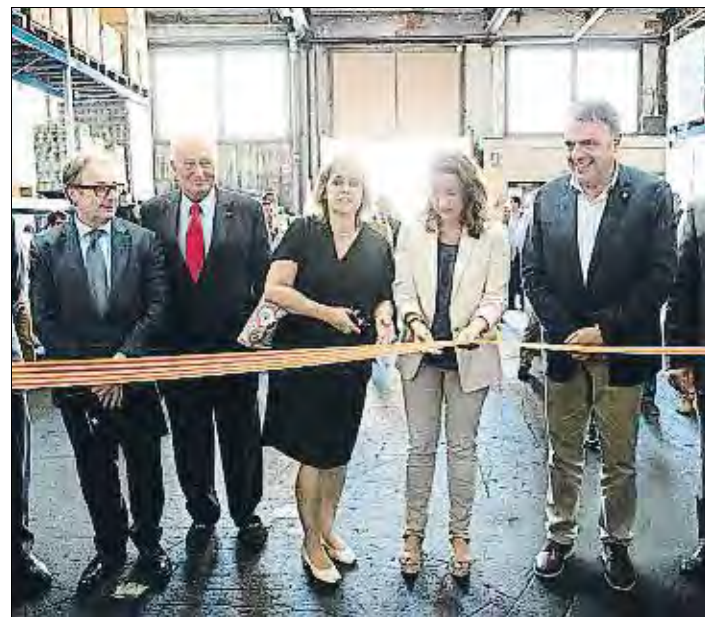
OBRA SOCIAL LA CAIXA

El firaire va explicar ahir que va comprar l'atracció en una nau de Mollerussa fa quatre anys i que la va fer servir en diverses fires, sempre amb els permisos municipals necessaris. L'advocat dels propietaris del restaurant demanarà que se citi a declarar el fabricant de l'inflable per determinar si la documentació que va lliurar al venedor és la reglamentària. El jutge espera rebre els resultats de l'informe encarregat a la unitat d'enginyeria forense de la Policia Nacional per mirar d'establir les causes del fatal accident. / Sílvia Oller