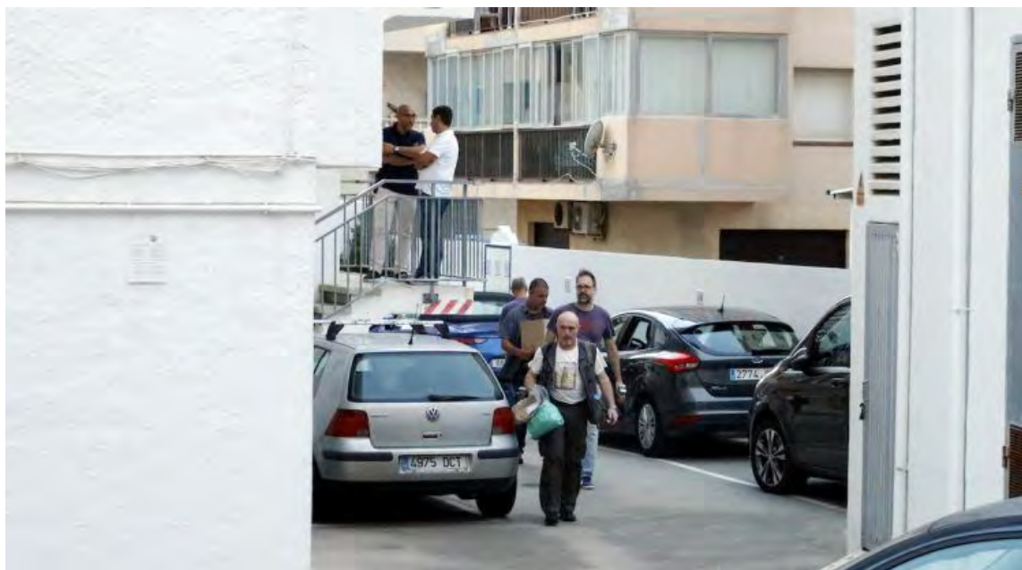
Els Mossos d'Esquadra s'enduen proves del lloc del crim