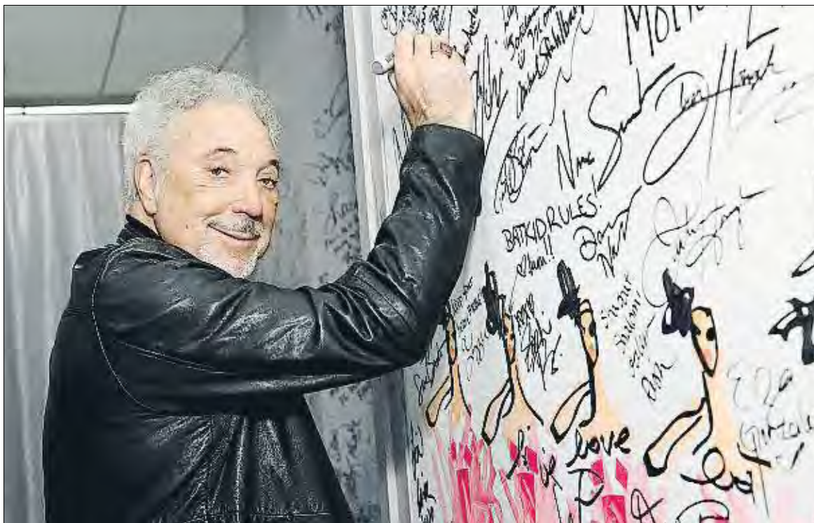
Jones va firmar a la paret dels estudis AOL de Nova York en la presentació del seu últim disc, Long lost suitcase

Tom Jones, músic, actua al festival Sons del Món