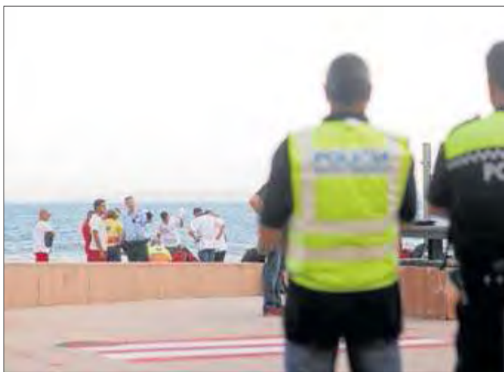
L'home hauria mort mentre intentava recuperar un bot. ROSANA VIDAL

Paral·lelament es va desallotjar la platja, que en aquell moment es trobava en hora punta, amb una gran afluència de persones. Fins al lloc dels fets es van desplaçar la policia local de la localitat, els