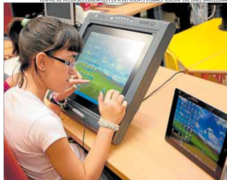
Una alumna cega, utilitzant una tauleta digital adaptada.

El CREDEV (Centre de Recursos Educatius per a Deficients Visuals) / Centre de Recursos Educatius de l'ONCE a Barcelona