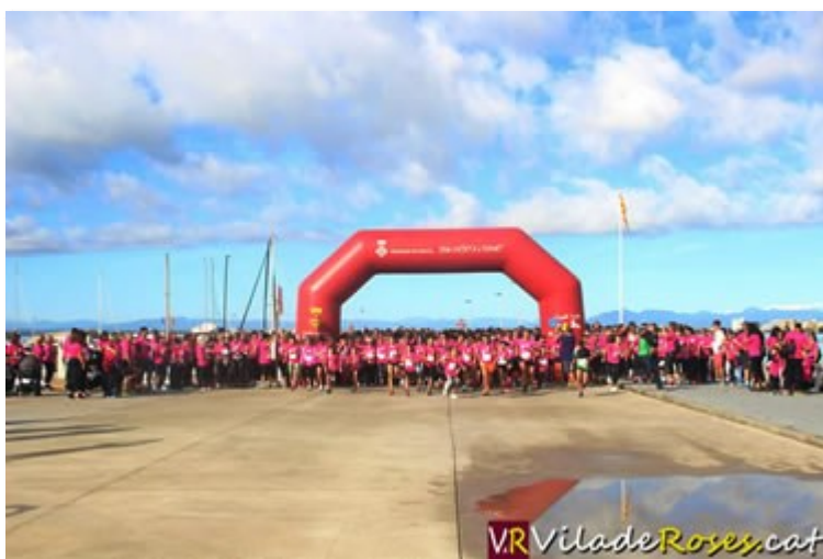
Moment de la sortida dels 1.000 participants de la X Cursa de la Dona de Roses

I mil persones van aportar 9 € per poder participar. Ningú va esperar més tard, quan les inscripcions ja pujaven a 12 euros. Bé, si que alguns sí que ho van fer, d'esperar-se fins al darrer moment, però ja no es van poder inscriure.