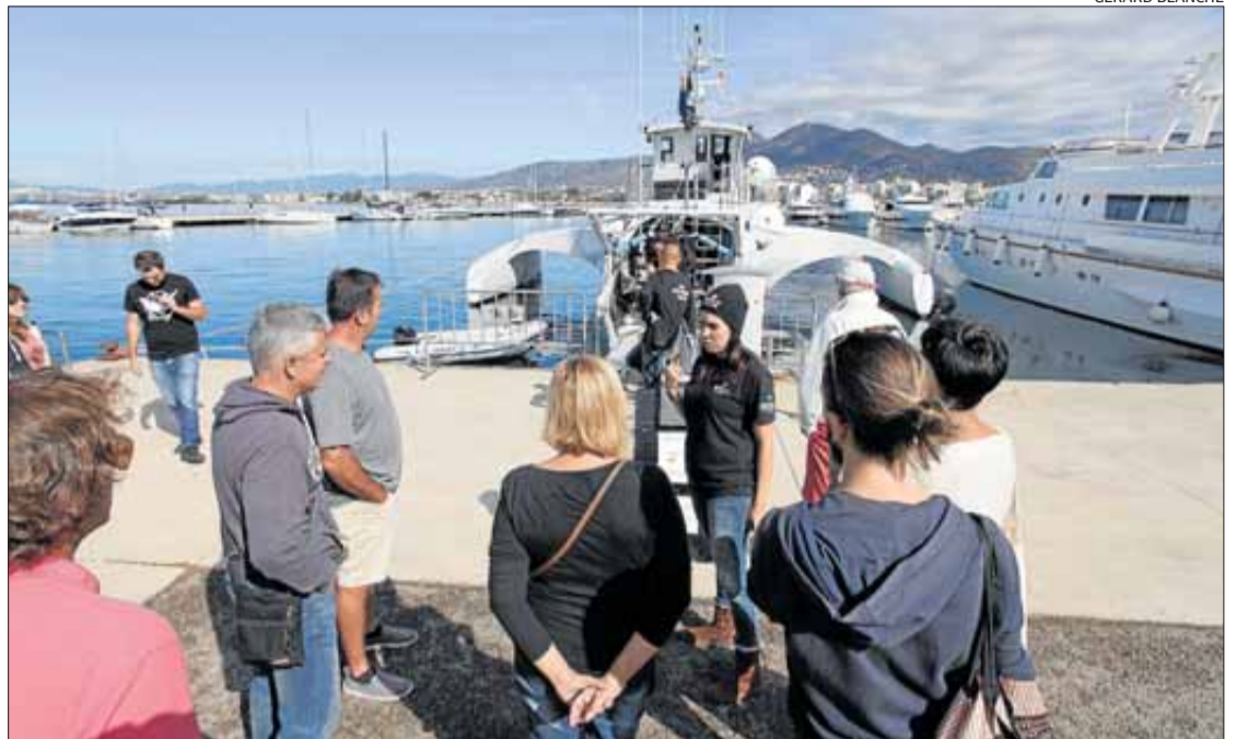
L'equip de Sea Shepherd ha mostrat el vaixell «Brigitte Bardot» en una jornada de portes obertes.

Els treballs s'emmarquen en l'operació Mare Nostrum III, la tercera campanya que realitza l'organització Sea Shepherd, mundialment coneguda per la seva activitat conservacionista de mars i oceans. En aquesta ocasió, a bord del Brigitte Bardot i dotats de dues llanxes ràpides, s'ha llançat aquesta campanya que recorre França, Marroc i l'Estat espanyol, per recollir xarxes fantasma i brossa marina que amenaça la