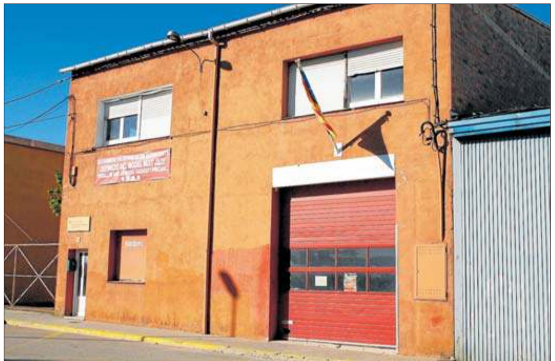
El parc de bombers de Sant Hilari Sacalm, en una imatge d'arxiu.

una campanya per donar a conèixer als ajuntaments i als ciutadans «les mancances» que pateixen. Alerten que no faran marxa enre- fins que el Departament d'Interior iniciï un «procés seriós, responsable i eficient» que resolgui les seves problemàtiques.