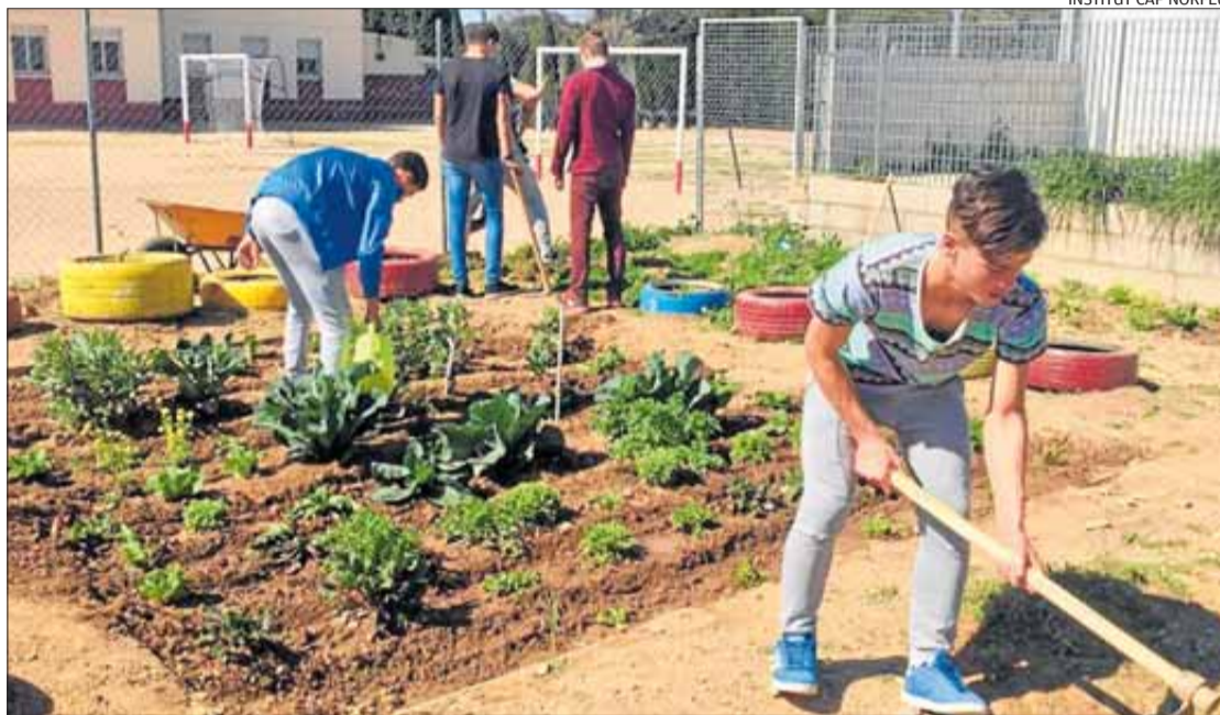
INSTITUT CAP NORFEU

Aquesta i altres iniciatives al voltant de l'hort han rebut el suport del centre i també de la Fundació Jaume Bofill, ja que el projecte Hortalitza't Norfeu! ha estat seleccionat, d'entre més de quaranta propostes, per rebre empara tècnica i econòmica, amb la col·laboració de la Fundació Goteo (Cívica