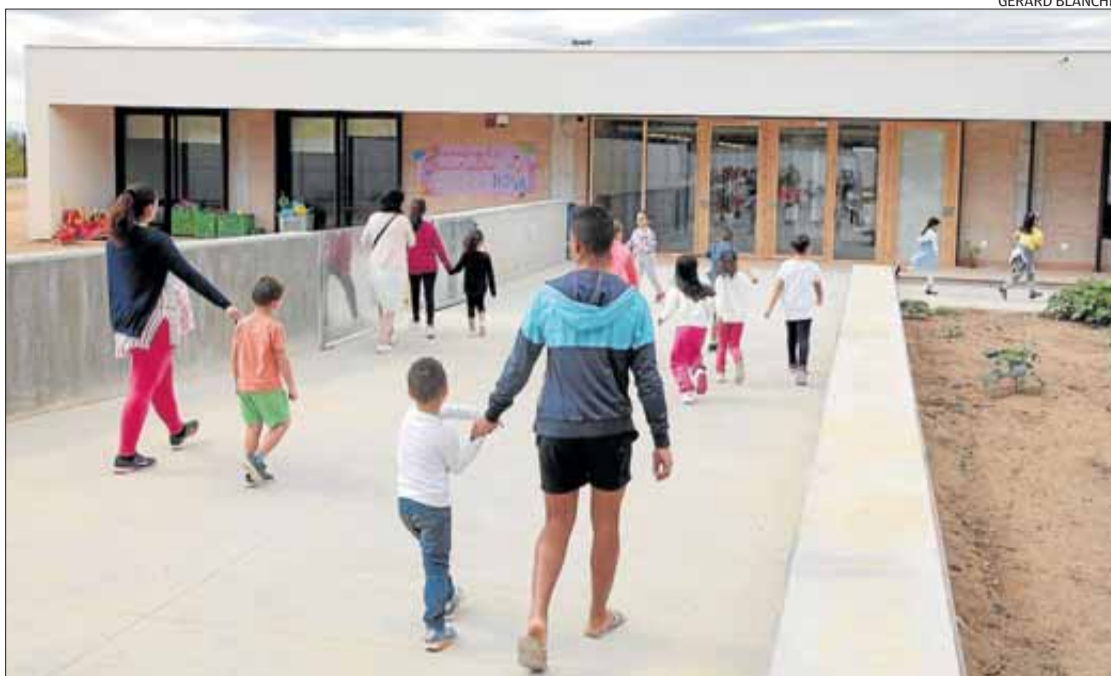
La comunitat educativa de l'Escola Montserrat Vayreda gaudeix del seu nou edifici escolar.

La provisionalitat no va durar dos anys, com s'havia promès al principi. Finalment, van acabar passant dotze anys, i al llarg d'aquest temps han estudiat als mòduls quatre promocions com-