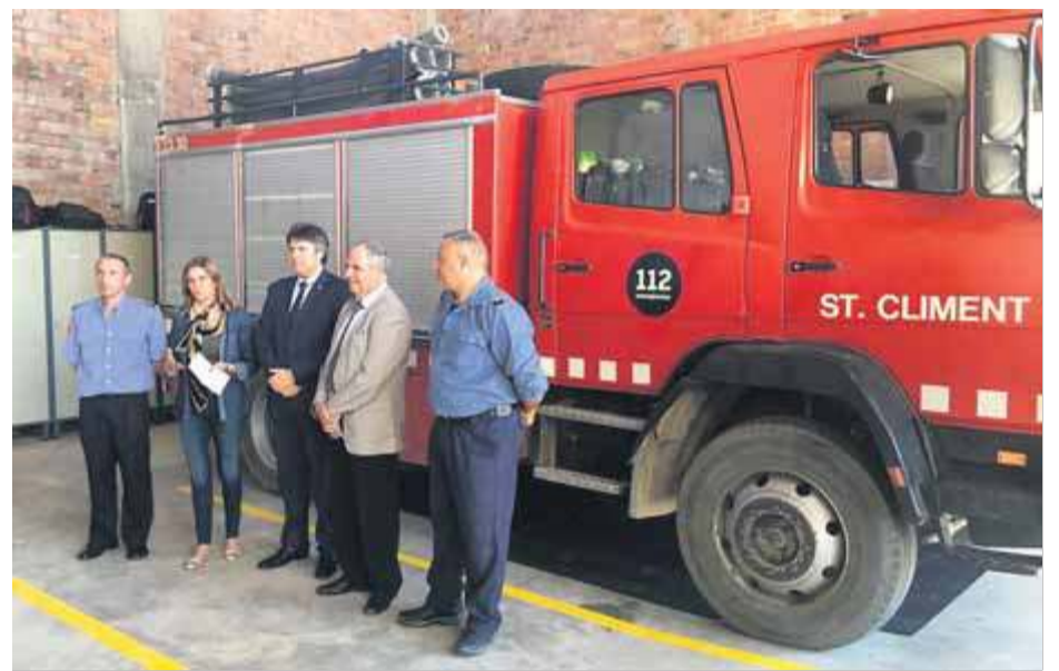
La presentació del parc de bombers voluntaris de Sant Climent Sescebes, el setembre de l'any passat

Per tot plegat, requereixen la dissolució del Consell de Bombers Voluntaris, per la seva “inoperativitat”, i la seva substitució per un nou òrgan on hi hagi una majoria de la DGPEIS. Volen que s'iniciï un “procés real” de desenvolupament i implantació de les condicions fixades en l'actual marc legal i