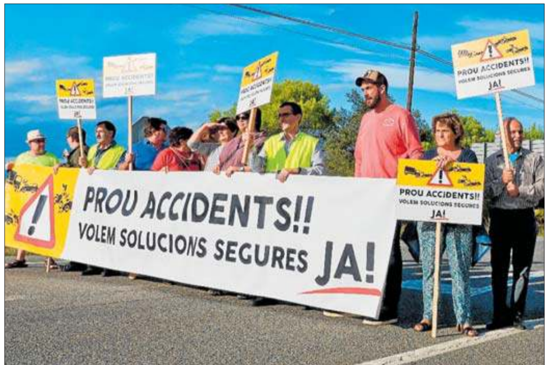
Manifestació, diumenge, a la cruïlla entre l'N-260 i la variant d'Ordis. JAUME HOMS

De fet, ja estan organitzant noves manifestacions. Aquest agost i setembre n'han realitzat quatre, dues per mes, i en preparen quatre més repartides entre l'octubre i el novembre. Encara no s'ha con-