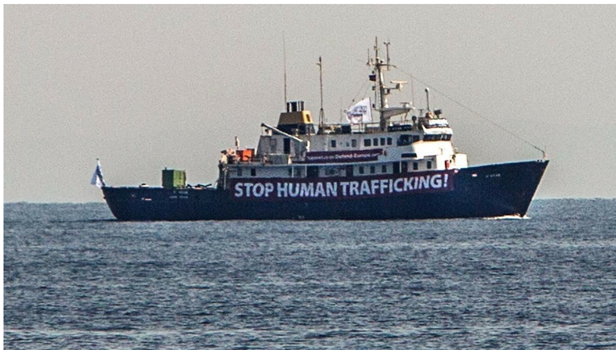
Imagen del C-Star, el pasado agosto, con una pancarta en la que condena el tráfico de inmigrantes.

La presencia del barco neonazi C-Star a pocas millas de la Costa Brava ha encendido todas las alarmas este domingo. La embarcación tiene como objetivo frenar la inmigración a través del Mediterráneo , controlando la actividad de las oenegés y bloqueando los rescates que estas realizan . Ports de la Generalitat ha denegado la entrada del barco, perteneciente al grupo Defend Europe, en el puerto de Palamós. Al parecer, la nave se ha encaminado luego hacia Roses .