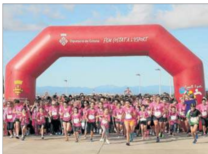
Un gran nombre de dones van participar-hi. GERARD BLANCHÉ

Aquesta iniciativa compta amb la col·laboració de persones voluntàries de la Fundació Clerch i Nicolau i la Fundació Vergés Ginjaume, que actuen com a mitjanceres entre els usuaris de Salut Empordà i la Biblioteca.