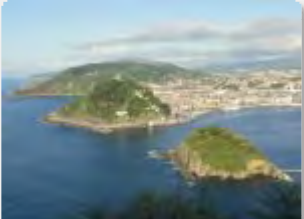
Spainsun : España