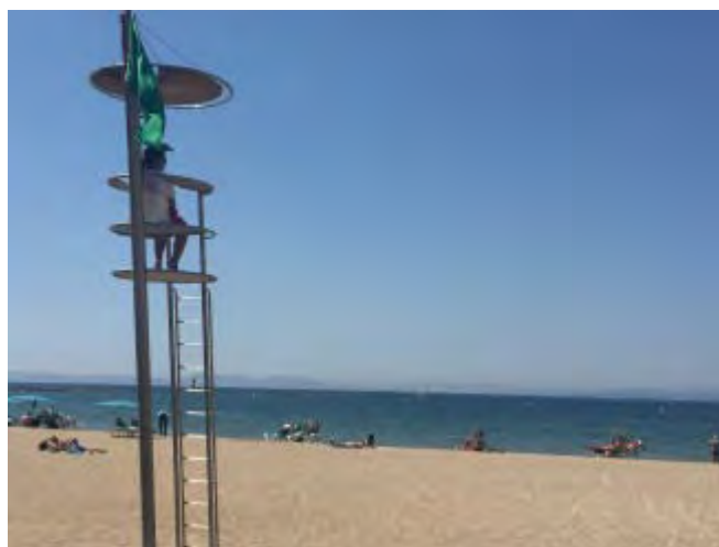
Servei de vigilància a les platges de Roses

L'Ajuntament de Roses posa en marxa aquest 21 de juny, el servei de vigilància, salvament i socorrisme de la temporada d'estiu 2018, el qual tindrà lloc fins a l'11 de setembre, oferint diferents serveis i activitats a totes les platges urbanes del municipi.