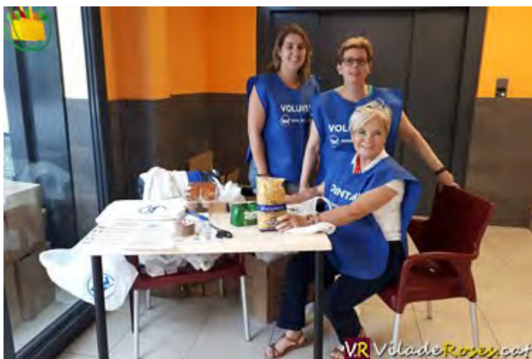
Voluntàries del recapte el passat divendres al Mercadona

Un total de 91 voluntaris van participar en el recapte d'aliments que va portar a terme Càrites Roses a tres supermercats de la Vila el passat divendres, dia 15, i dissabte, 16, en la campanya 'La fam no fa vacances' del Banc dels Aliments.