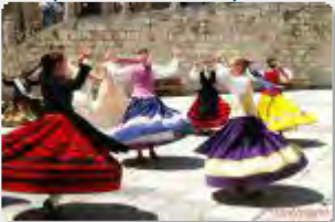
Vvb75 : España