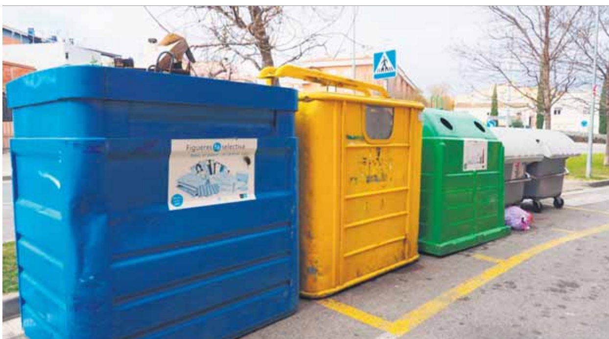
Contenidors de l'empresa mixta Fisersa instal·lats en un carrer de Figueres