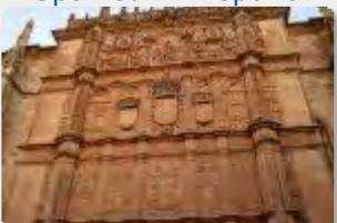
Pretorian : España