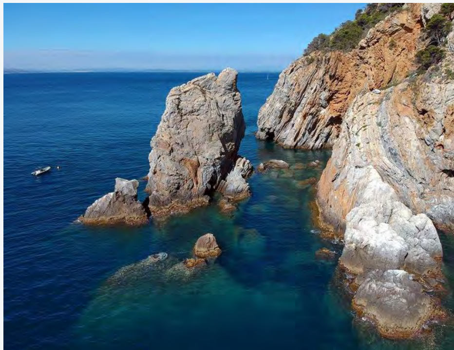
Fotografia de Lluís Masblanch, primer premi Arxiu.