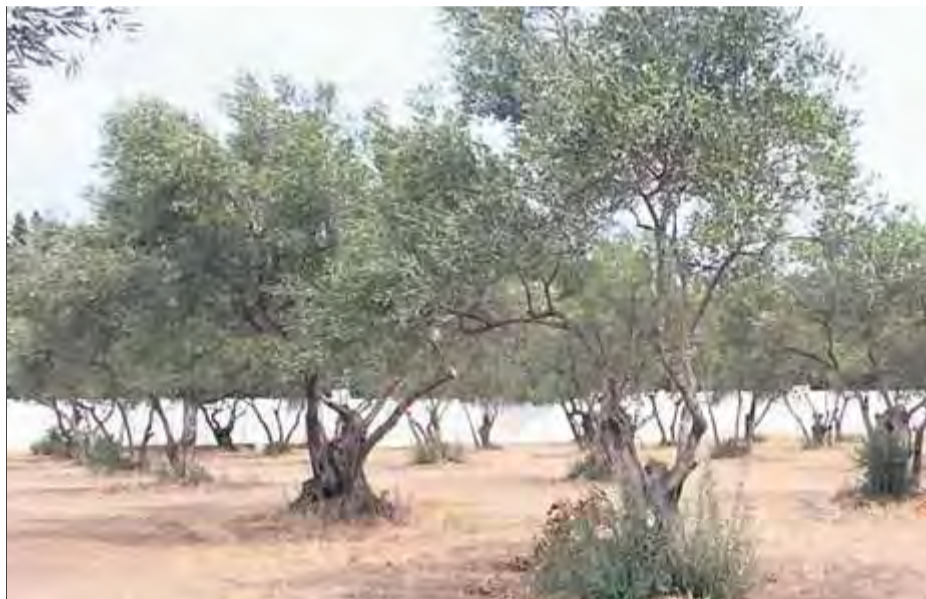
El terreny municipal és a tocar del cementiri rosinc

Entre els criteris que hauran de complir –o millorar– les empreses que