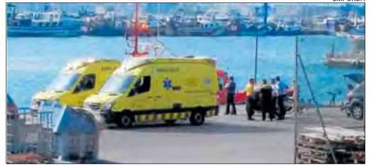
Les ambulàncies, esperant la tripulant d'una llanxa al port de Roses.

pital Josep Trueta. En els treballs d'evacuació també van intervenir efectius del Grup d'Actuacions Especials (GRAE), dues ambulàncies del Sistema d'Emergències Mèdiques (SEM) i l'embarcació de Salvament Marítim Salvamar Castor .