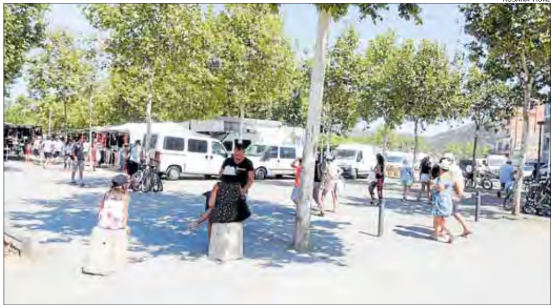
Les pilones protegeixen el perímetre on es munta el mercat dels diumenges.

Divendres passat, el dia després dels atemptats terroristes a Barcelona i Cambrils, els rosincs van sortir en massa a concentrar-se per condemnar l'atac per solidaritzar-se amb les víctimes i els