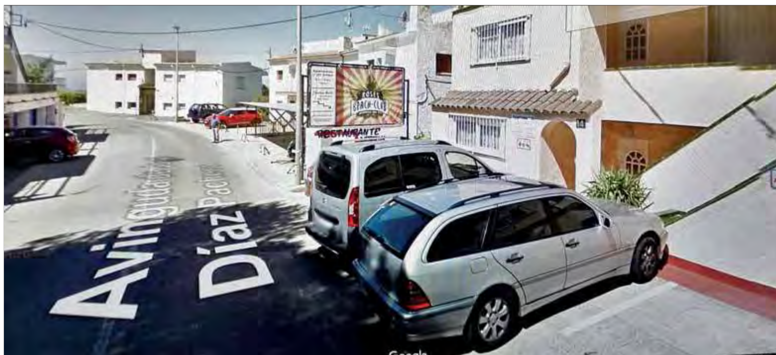
El carrer Díaz Pacheco, on estaven aparcats la matinada de diumenge els cotxes afectats, en una imatge agafada de Google

■ Els Mossos van alertar totes les policies per si l'acció podia estar vinculada als atacs terroristes, però la hipòtesi més fiable és que es tractaria d'un acte de vandalisme nocturn