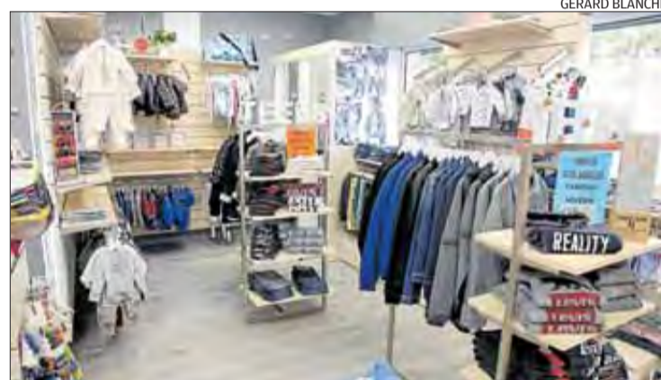
La botiga torna a recuperar els clients de tota la vida.

Una de les principals novetats és que Nou Nens ha fet una aposta ferma per la roba dels joves amb marques molt reconegudes. L'establiment és obert cada dia.