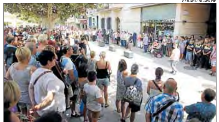
Els rosincs, concentrats en silenci davant l'ajuntament.

Després del minut de silenci, l'alcaldeessa de Roses es va dirigir als assistents agraint la seva presència i manifestant "el més enèrgic rebuig al terrorisme, tot el suport i estima cap a víctimes i familiars, i l'agraïment a tots els cossos d'emergències, institucions, entitats ciutadanes i particulars que han fet tot el possible en aquests difícils moments; així com la voluntat de seguir construint uns pobles i ciutats on imperi la democràcia, el respecte, la llibertat i la pau".