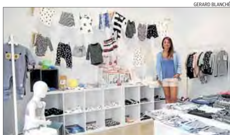
Visitar el local es converteix en tota una experiència.