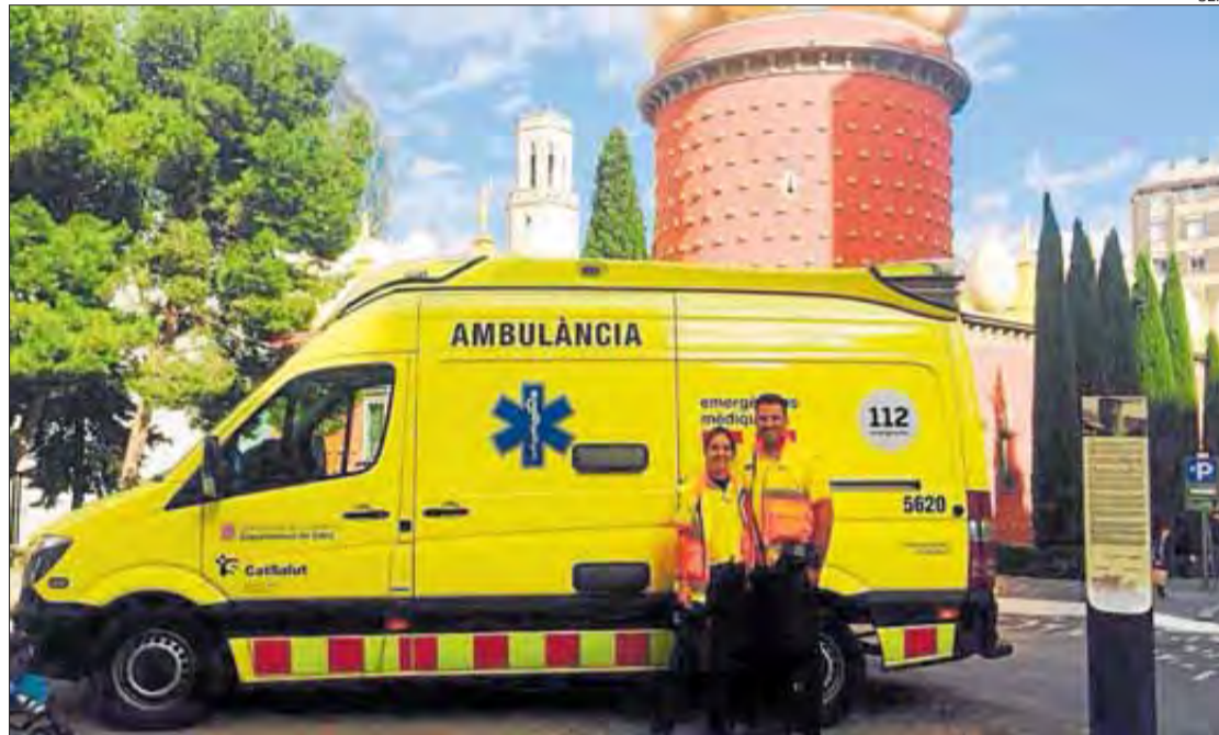
La nova imatge del SEM, a Figueres.

telèfon d'emergències (112) han pujat els avisos a Roses i Castelló: d'una banda, 1.381 avisos s'han rebut des de Roses , un 10,6% del