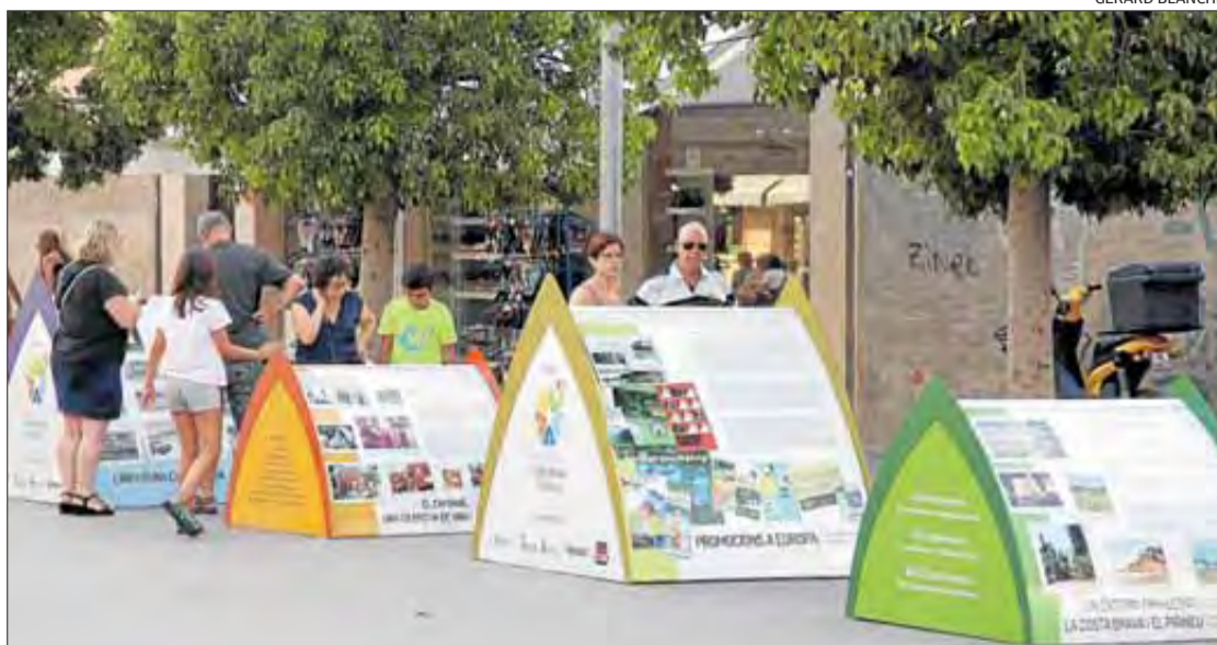
Fins a set mòduls expliquen, amb fotografies, la història dels càmpings gironins.

Per exemple, hi ha un mòdul dedicat a l'entorn privilegiat on es-