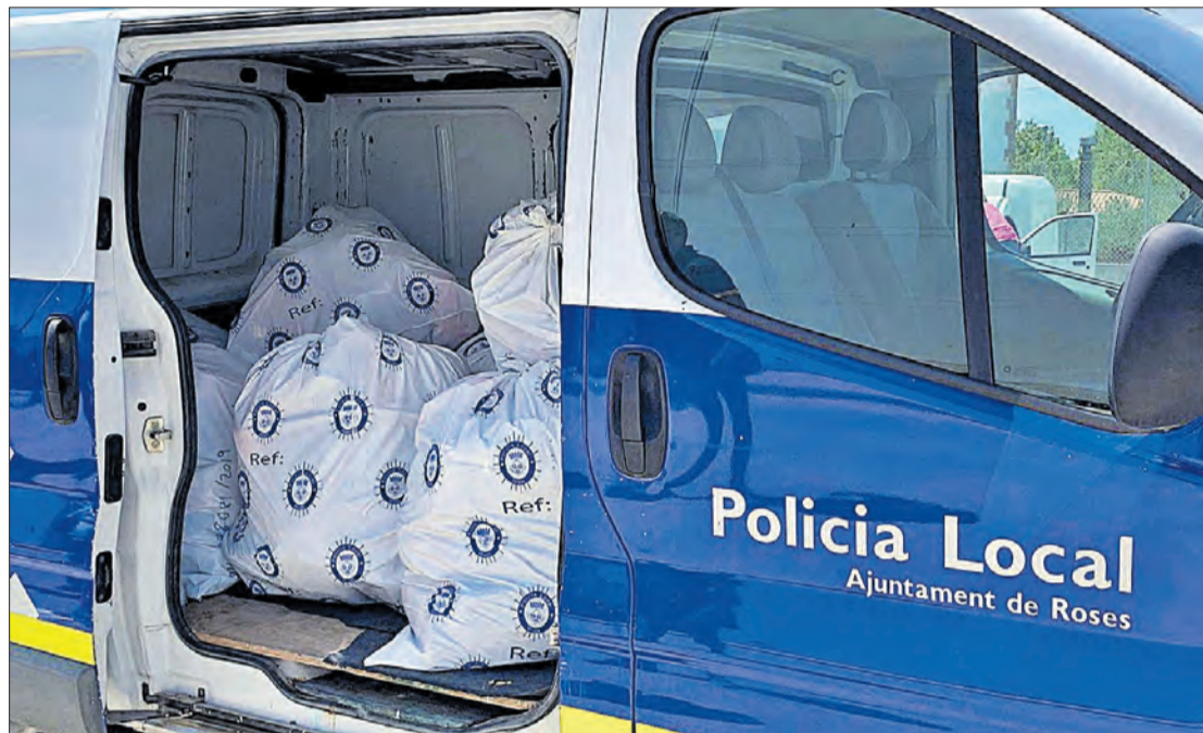
Material comissat ahir per la Policia Local i els Mossos d'Esquadra. DIARI DE GIRONA

El primer operatiu contra la xarxa va servir per retirar del mercat negre articles valorats en 30.000 euros