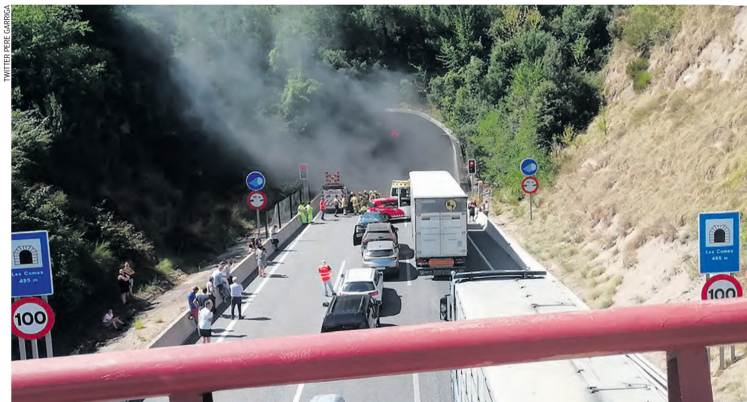
TWITTER PERE GARRIGA

▶ ÉS EL SEGON GRAN OPERATIU DESPRÉS QUE LA SETMANA PASSADA SE N'INCAUTESSIN QUATRE ▶13