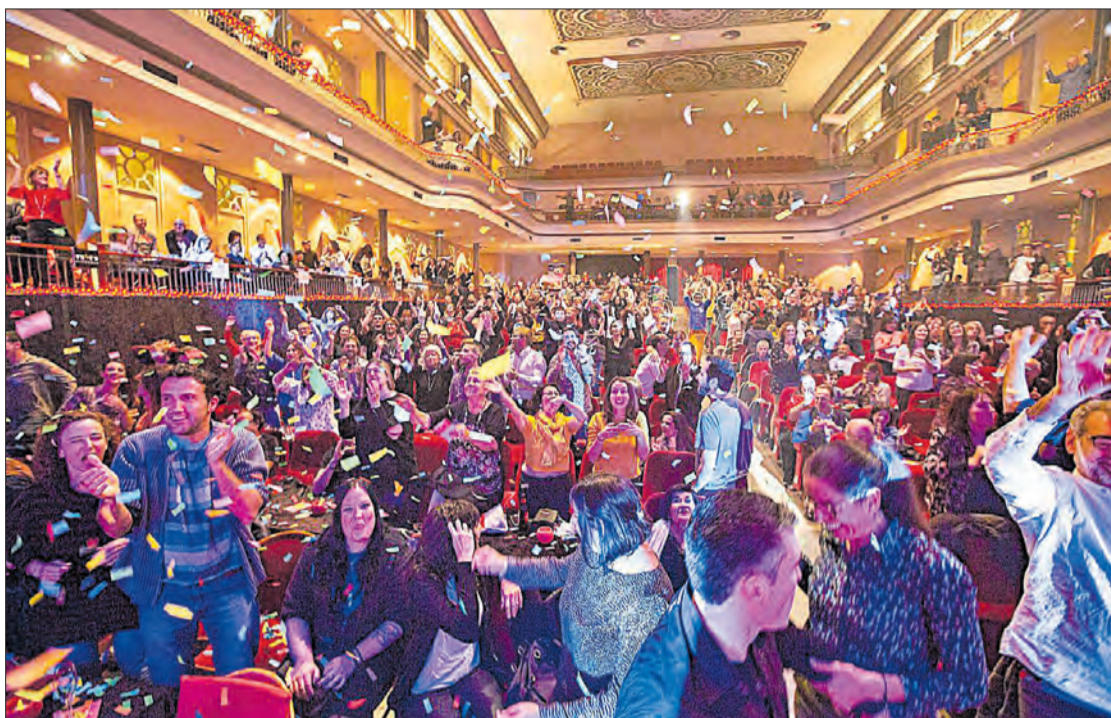
El teatre El Jardí, ple, en un dels espectacles del Festival.

Les càmeres de seguretat són un altre dels elements que s'ha posat en marxa en els darrers anys per frenar el fenomen. S'estudia col·locar una nova càmera al passeig.