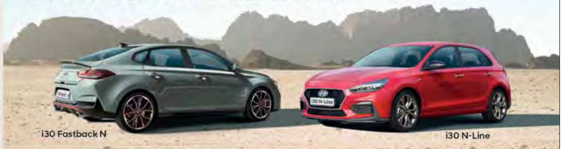
i30 Fastback N