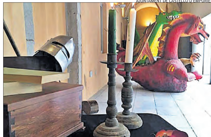
AJUNTAMENT DE CASTELLÓ D'EMPÚRIES

► CASTELLÓ D'EMPÚRIES exposa fins demà la mostra «Moments de Sant Jordi» amb dracs i roses. Es pot visitar al convent de Santa Clara. Mostra els dibuixos dels alumnes de les tres escoles del municipi que han participat en el concurs de dibuix per al cartell de Sant Jordi i també diferents escultures de dracs realitzats amb materials diversos.