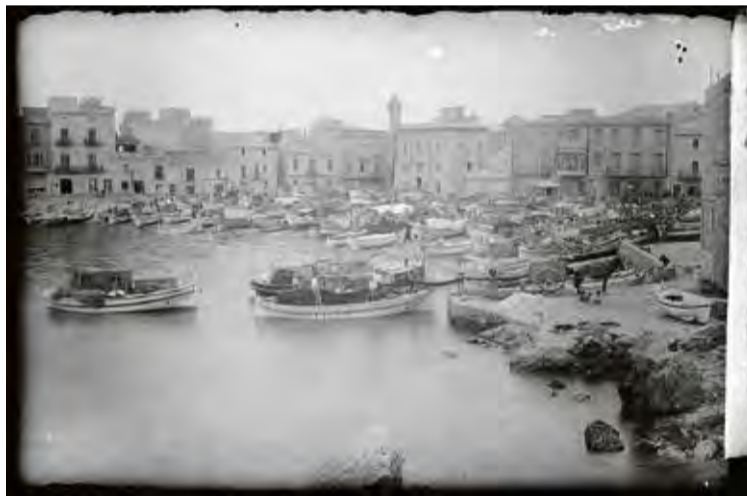
PLATJA DE LES BARQUES DE L'ESCALA I LA FRONTERA DEL PERTÚS, A LA JONQUERA, d'esquerra a dreta

Entre les fotografies de l'exposició, datades majoritàriament entre el 1911 i el 1944, apareixen paisatges alt-empordanesos: des de la platja de les Barques i la casa de la Punxa de l'Escala fins al pas de la duana a la frontera de França, al Pertús. Fargnoli va retratar, també, el carrer d'accés a Roses envoltat de plataners; barques de vela llatina sortint a pescar des de la platja dels Pescadors, actual platja de la Punta del mateix municipi mariner. «Valentí Fargnoli. El paisatge revelat» ofereix un passeig, a través de la mirada del