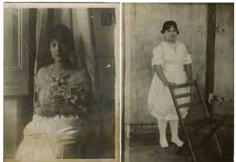
IMATGES CEDIDES. El fons procedeix de la família Gratacós-Farraró

Com explica la directora de l'Arxiu, la historiadora Erika Serna, «durant el segle XIX i fins a la primera meitat del segle XX, la migració d'europaus cap al continent americà va ser molt important. [...] A finals del segle XIX, membres de la branca Farraró van emigrar cap a l'Amèrica del Sud, en concret a Puerto Rico, establint-se de manera permanent al municipi d'Arroyo». ■