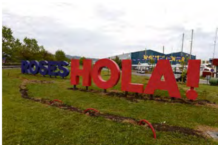
'HOLA! ROSES'. És el missatge que s'ha instal·lat a la rotonda de la C-260 ÀNGEL REYNAL

Donen la benvinguda amb un gran rètol que ara s'il·luminarà