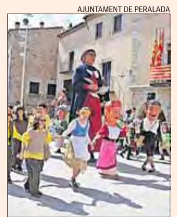
AJUNTAMENT DE PERALADA