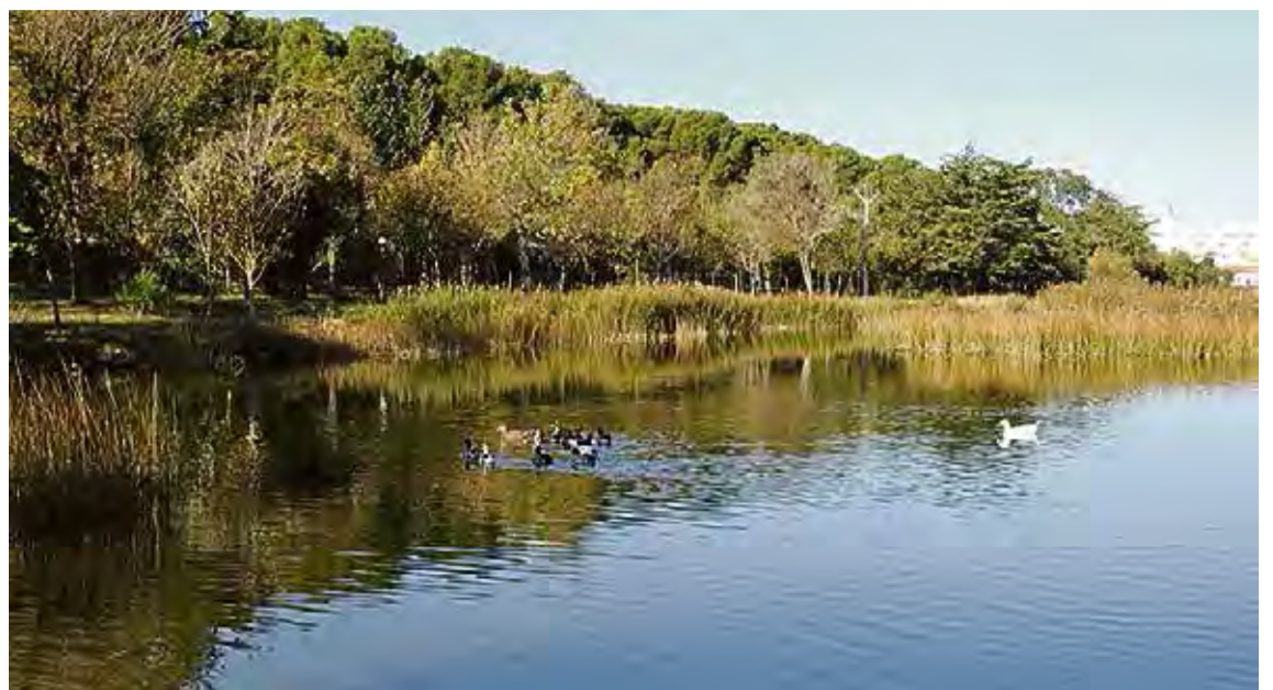
L'ESTANY DE POMA. Els ecologistes reivindiquen aquest espai com a zona d'alt valor mediambiental i arqueològic

L'ESPAI. Situat a la zona on hi havia l'antic càmping Maite, l'entorn ara protegit ocupa un espai de prop de 9 hectàrees de terreny. Es tracta d'una zona amb un elevat valor paisatgístic i social i on també hi hauria restes arqueològiques importants, segons han advertit experts i membres de l'associació l'Escalà Cívica. Amb el planejament del 1993, l'entorn de l'estany de Poma està conside-