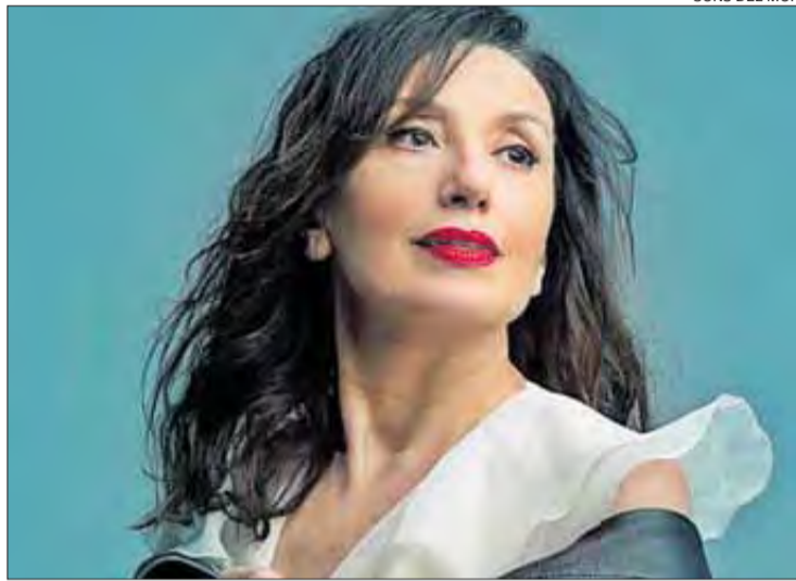
SONS DEL MÓN

El 2 d'agost serà el moment de reviu quaranta anys dels Boney M., liderats per la seva cantant original, Maizie Williams. La formació, creadora de hits com Rasputin , Sunny , Brown girl in the ringo i Rivers of Babylon , actuarà a la Ciutadella de Roses. Maizie Williams estarà acompanyada de tres cantants i una banda de músics inter-