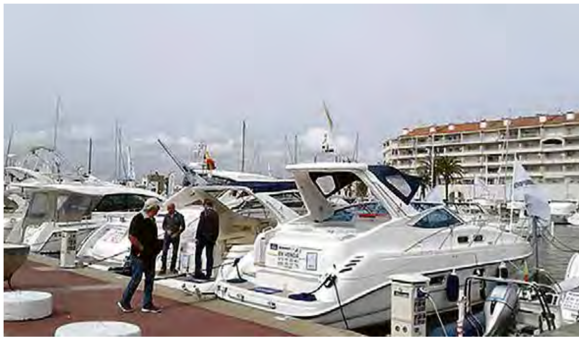
37 EXPOSITORS NÀUTICS. Entre el 13 i el 21 d'abril, en un recinte firal de 25.000 metres quadrats

■ Els organitzadors i expositors de la XXXI Fira del Vaixell d'Ocasí d'Empuriabrava han tancat el certamen aquest diumenge amb bon regust de boca. Calculen que en una setmana s'hauran venut un 25% de les embarcacions. El percentatge s'obté del 21% d'operacions fetes al mateix recinte firal més els contactes que es converteixen en venda dies després.