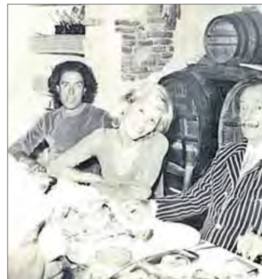
Pitxot i Dalí al celler de Ca la Teta, al Duran.

La fotografia mostra dos cuiners del restaurant Duran, al Pertús, amb les seves eines de treball, ben esmolades, a la mà. La imatge, molt representativa, data del 1955 i pertany a l'arxiu Meli. Va ser captada pel mític fotògraf figuerenc, Melitó Casals, Meli.