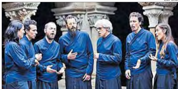
El concert de Muom serà un dels actes d'aquest dissabte.