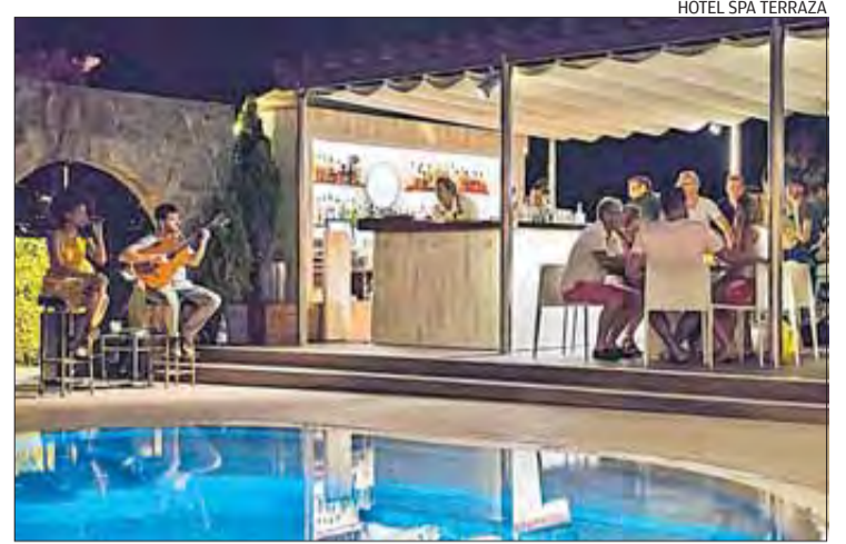
HOTEL SPA TERRAZA

ney M. va ser, juntament amb els Beatles, l'únic grup que aconseguí tenir dues cançons a les llistes dels singles més venuts del Regne Unit.