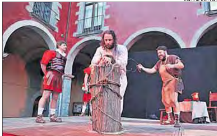
L'Escala, a dalt, i Castelló d'Empúries han celebrat el Viacrucis.