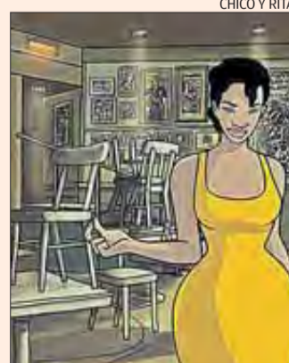
CHICO Y RITA

▶ Diumenge, a les 18 hores. L'artista Xavier Mariscal i el cineasta Fernando Trueba participaran en la nova sessió del cicle «Literatura i Cinema» que es fa diumenge al restaurant-cocteleria Ultramar de l'Escala. La seva presència no és vanal, ja que aquest dia es projectarà Chico y Rita , un deliciós film que signen ambdós creadors i amb el qual foren reconeguts amb un Goya el 2010 i el Gaudí a la millor pel·lícula d'animació, el 2012. La iniciativa, promoguda conjuntament entre Ultramar i la llibreria Vitel·la, és oberta a tothom.