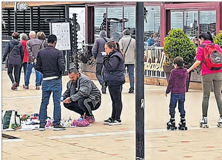
Venedors, al passeig, aquesta Setmana Santa.