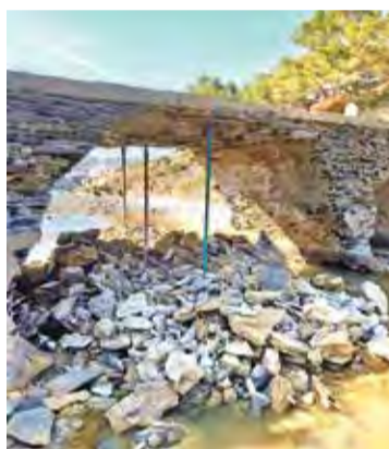
DURANT LA REPARACIÓ. Tasques

L'ESCALA. A la costa gironina, per delegació de la Secretaria d'Estat de Medi Ambient, es van declarar obres d'emergència a la demarcació de Girona per reparar els desperfectes produïts pel temporal del gener. Concretament als municipis de l'Escala, Cadaqués i Castell-Platja d'Aro. Les del passeig de Platja d'Aro estan en execució i tenen data de finalització pel mes de setembre, mentre que les de l'Escala es completaran a mitjan juliol. ■