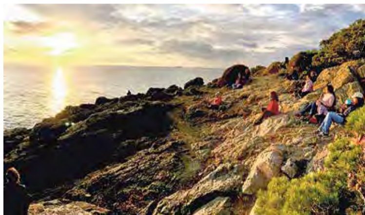
BENESTAR. Experiència de natura i sol