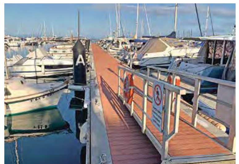
A PUNT PER LA TEMPORADA D'ESTIU. Pantalans nous i altres millores al port

Aprofitant la renovació dels pantalans A, B i C també s'han fet altres tasques de millora al port. Aquestes han anat a càrrec del personal de marineria.