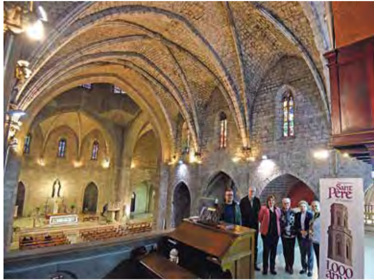
LA PARRÒQUIA. Presentació dels actes del mil·lenari (imatge d'arxiu)

DIUMENGE 28. A la plaça Josep Pla a les 18.30h hi haurà una actuació