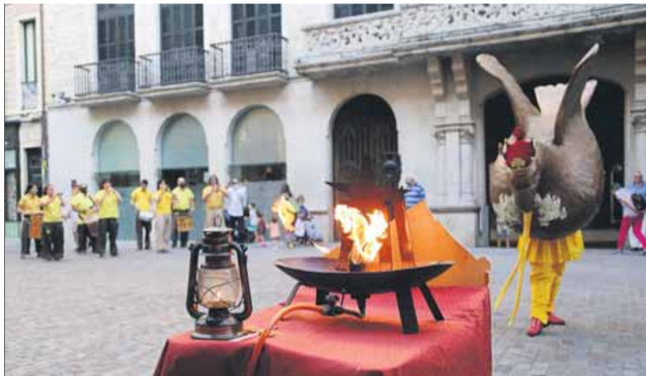
L'àliga de Girona balla al costat del peveter, ahir en l'acte de rebuda de la flama

A la ciutat de Girona, es va fer un acte reduït a la plaça del Vi, espaïant la recollida de flames per part d'entitats i particulars durant dues hores –de 6 a 8 de la tarda– i sempre amb cita prèvia. Es van repartir una vintena de flames, gairebé totes a particulars quan habitualment la majoria eren a entitats. Cal tenir en compte que Òmnium havia fet una crida aquest any perquè s'encengués a les 10 de la nit una espelma als balcons com a homenatge als afectats per la Covid-19 i als serveis essencials, a més d'als presos i exiliats.