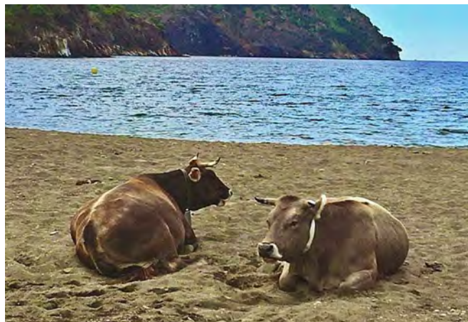
Les vaques prenen el sol a cala Montjoi