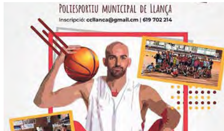
CAMPUS. Està adreçat a joves d'entre 8 i 15 anys

En concret, el campus celebrarà aquest 2020 la seva quarta edició, i ho farà del 27 al 31 de juliol al poliesportiu municipal de Llançà en horaris de matins i tardes. En aquest cas, les inscripcions, ja obertes i dirigides a joves d'entre 8 i 15 anys, tindran en els jugadors