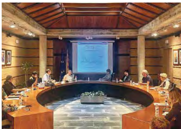
DIMECRES PASSAT. Reunió de la junta de seguretat de Roses

A l'Escala, l'Ajuntament ha emès un ban amb els consells de seguretat per la nit de la revetlla i per l'ús de les platges del municipi. Aquestes zones no acostumen a tenir aglomeracions per Sant Joan, i aquest any tampoc se'n preveuen. El municipi disposa de 7 km de platges. ■