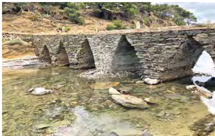
OBRA FINALITZADA. Els treballs van acabar el 15 de juny

TASQUES. Les obres, que han aprofitat bona part dels elements que formaven el tram afectat, van començar el 14 de maig i han consistit en la demolició d'un pilar de maçoneria afectat pel temporal i la seva reconstrucció. La reparació s'ha reforçat amb fonaments de formigó.