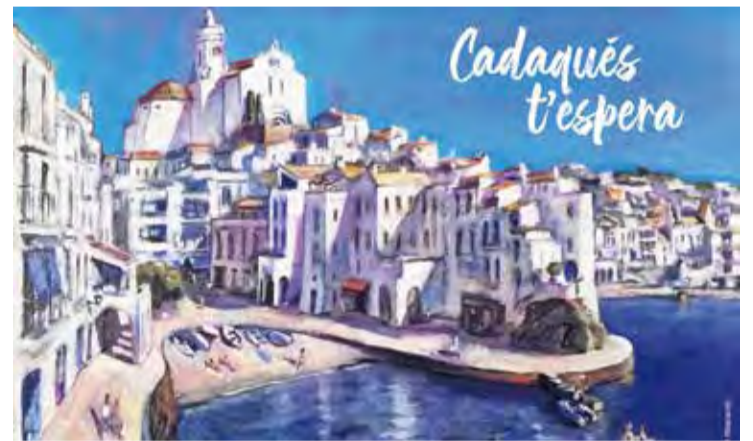
'PORTDOGUER'. El quadre cedit per Ramon Moscardó