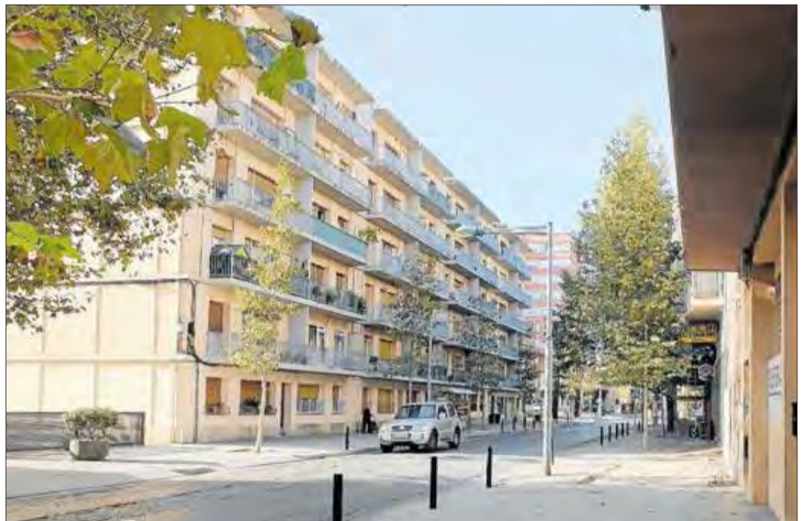
El barri Horta d'en Capallera de Figueres. CONXI MOLONS

de Barris serà el resultat del consens polític, l'avaluació dels tècnics i el debat ciutadà, amb la intenció que tingui un llarg recorregut.