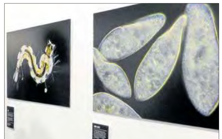
La Casa Empordà acull l'exposició de microfotografia. CONXI MOLONS

repararan els danys causats per elements com les arrels dels arbres. En altres es repararan els danys i es restituirà la capa d'asfalt. En un tercer grup de carrers amb un estat de deteriorament superior es farà una estesa d'una nova capa d'asfalt.