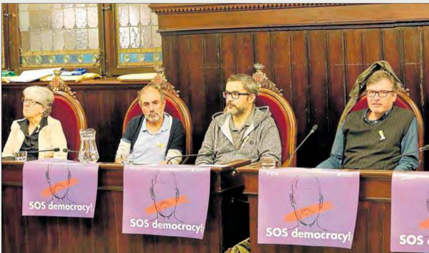
Alguns regidors van protestar durant el ple contra les accions del Govern espanyol amb petits cartells. ANIOL RESCLOSA