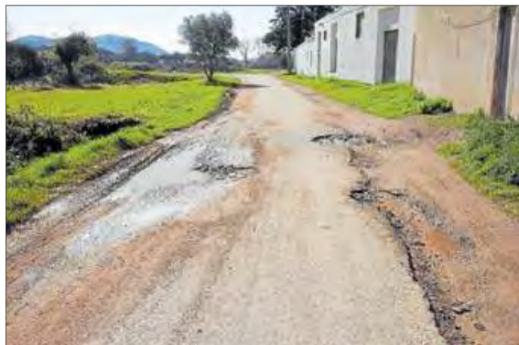
Un dels carrers pendents d'asfaltar.

El pla consisteix en la realització periòdica de treballs d'asfaltatge i pavimentació en aquells