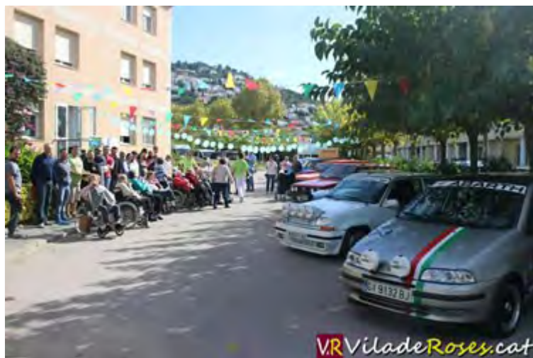
La Residència Pi i Sunyer de Roses va acollir una concentració de cotxes clàssics dins els actes de celebració del seu 25è aniversari

Aquest any 2017 la Residència Pi i Sunyer de Roses compleix 25 anys de vida al servei de la gent gran. Una efemèride que el centre geriàtric està celebrant com cal al llarg de l'any. Al més de març es va encetar la commemoració amb la inauguració d'una exposició de fotografies sobre la seva història i un dinar que van poder gaudir els usuaris. Dos mesos més tard, al maig, van tenir lloc al llarg i ample del complex residencial els primers Jocs Olímpics de l'Alt Empordà per a la gent gran , amb la participació de diferents centres provinents d'arreu la comarca.