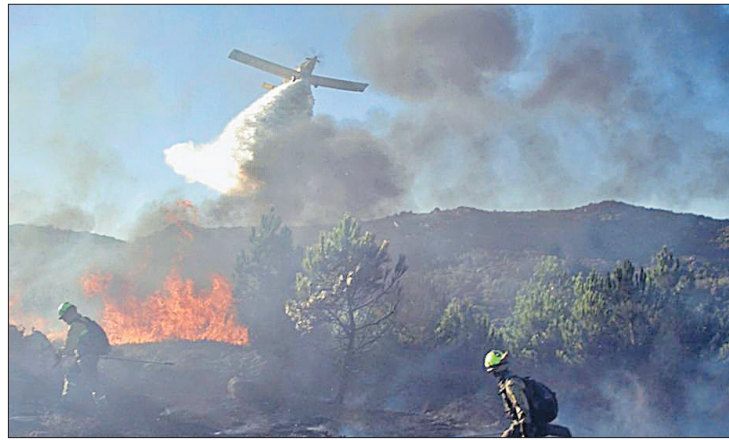
Un dels avions, durant les tasques d'incendi.