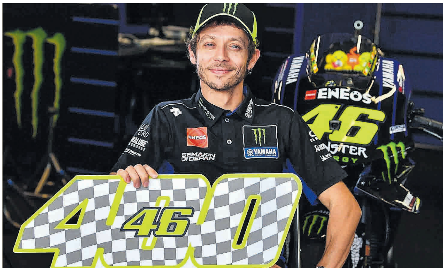
Valentino Rossi, una leyenda que sigue en la brecha a sus 40 años //MOTOGP