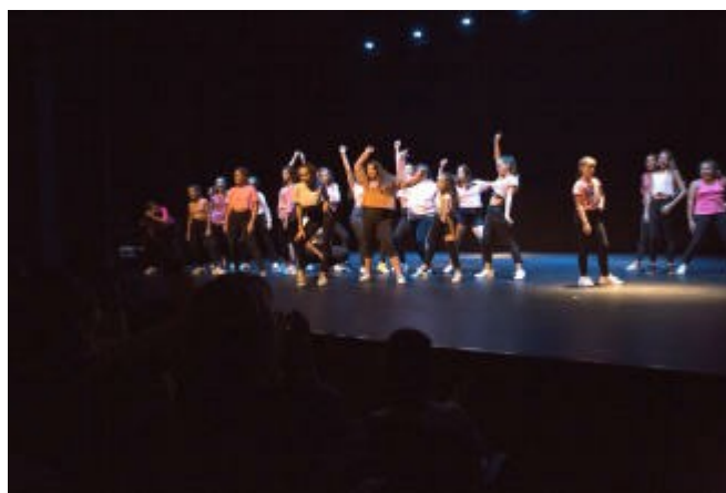
L'espectacle benèfic que es va fer dissabte passat