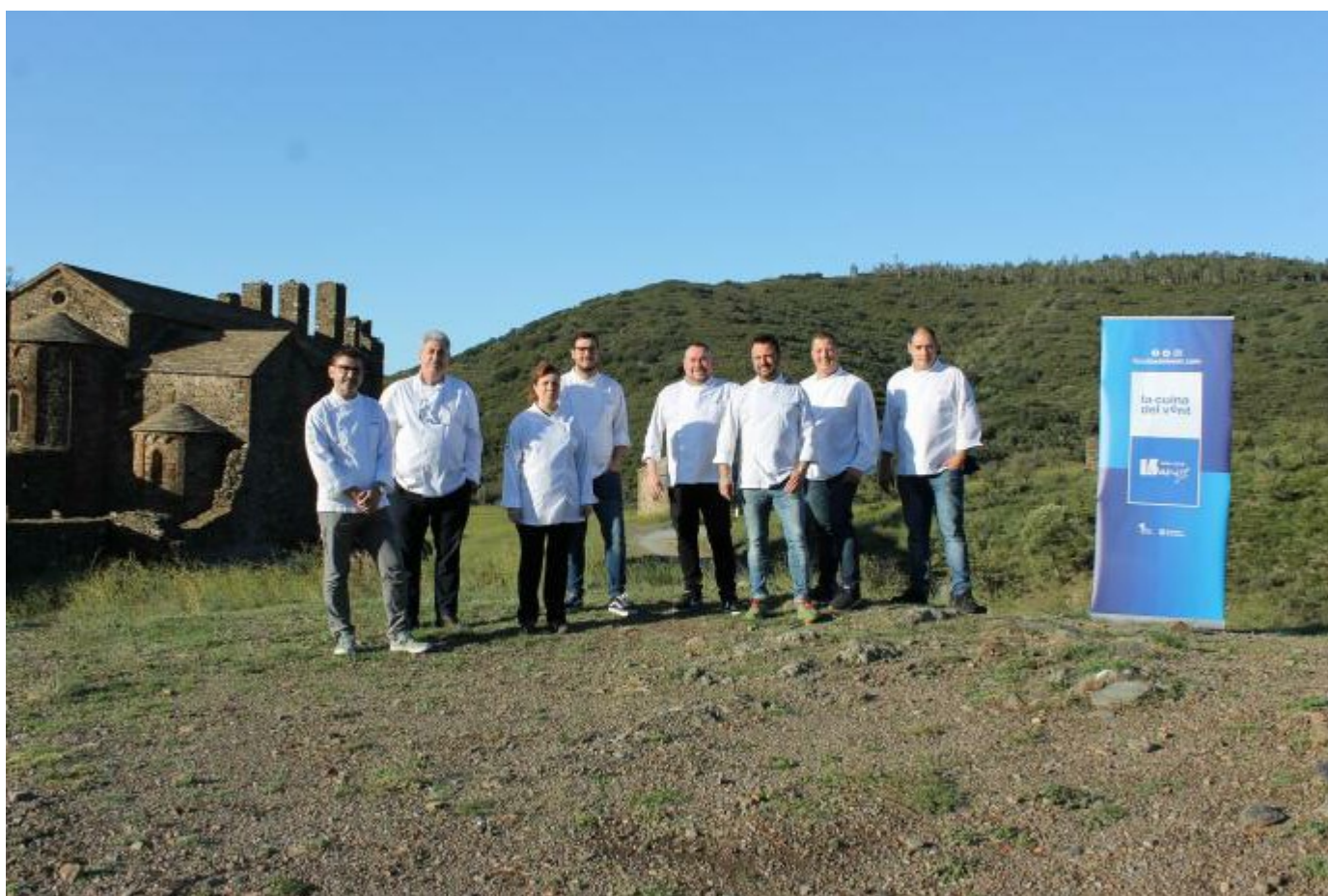
Cuineres, cuiners i representants de la Cuina del Vent. 6COMUNICACIÓ