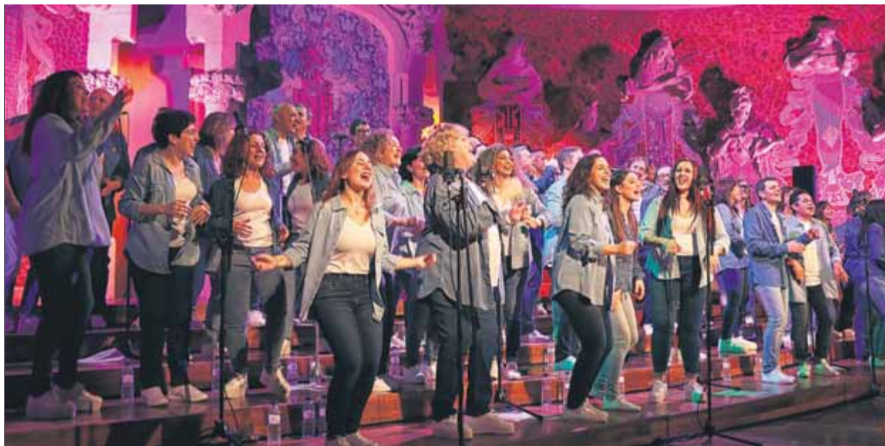
The Gospel Viu Choir, en el concert que van oferir al febrer al Palau de la Música