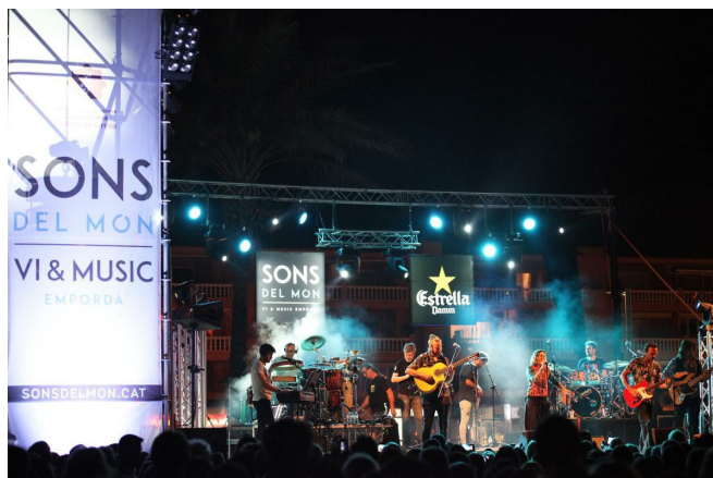
La Ciutadella de Roses acollirà tots els concerts.

La tretzena edició de Sons del Món finalment es podrà celebrar, tot i la pandèmia, amb una programació de luxe a la Ciutadella de Roses . Sílvia Pérez Cruz i Marco Mezquida, Diego El Cigala, Lola Índigo i Miki Núñez se sumen als concerts que s'han presentat de Sopa de Cabra, Pablo López, Stay Homas, Manel i Els Amics de les Arts. Les entrades ja estan a la venda a la web del festival.