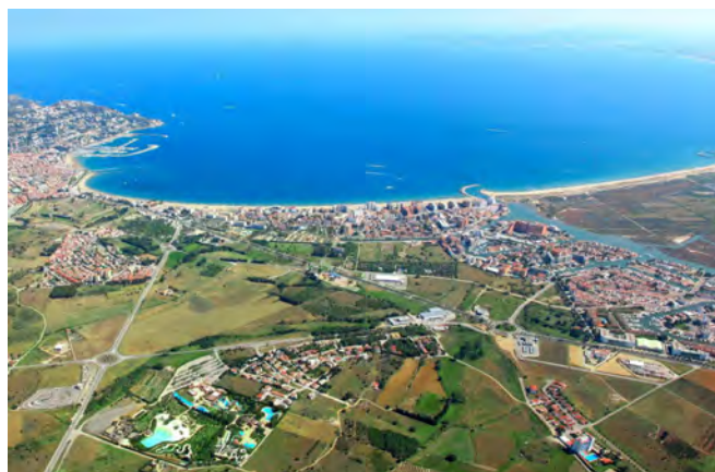
La presentació de sol·licituds de les subvencions de Roses posa't guapa, fins al 31 de juliol EMPORDA.INFO

Les persones interessades a concórrer en la convocatòria de subvencions de la campanya de millora del paisatge urbà " Roses posa't guapa" corresponent a l'any 2020, poden presentar les seves sol·licituds fins al proper 31 de juliol. Enguany, la quantitat total destinada a aquests ajuts pel consistori rosinc és de 110.000 €.