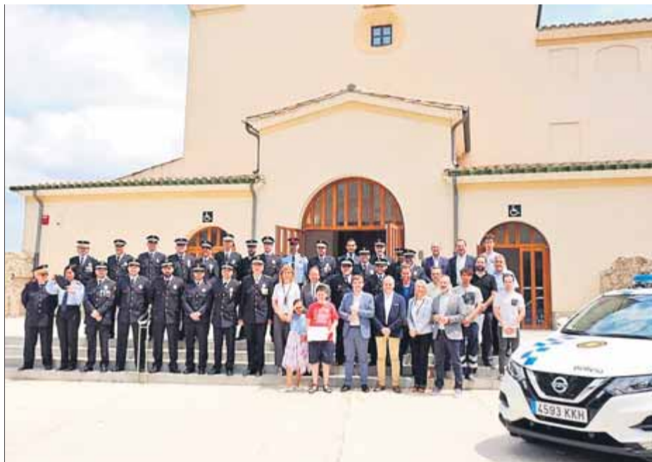
La fotografia feta al final de l'acte amb protagonistes i polítics

En funcions de policia administrativa, les denúncies van ser 200 per l'ordenança de civisme i convivència; 79 van ser referides a l'ordenança de tinença d'animals, 26 per l'ordenança de residus i 164 denúncies referides a la llei de seguretat ciutadana. Així mateix, la Guàrdia Urbana també fa en deter-