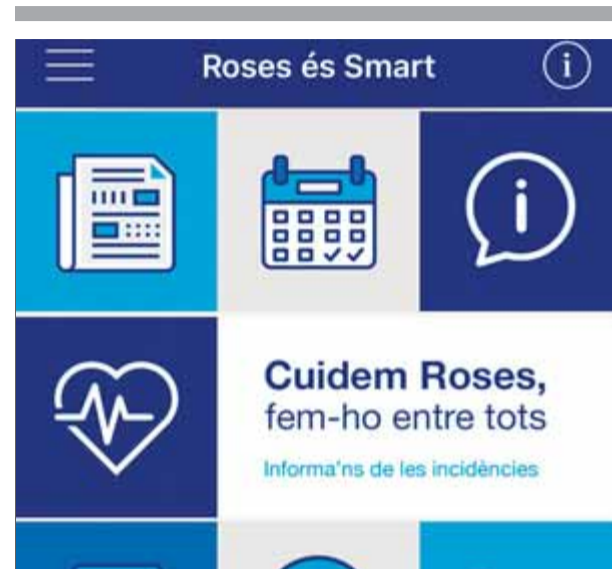
Aspecte de la nova aplicació mòbil de Roses

en unes proves selectives a les quals van optar 58 aspirants, dels quals 28 van fer dilluns passat les proves físiques. Hi havia dues places d'oposició lliure convocades. Els seleccionats en les dues convocatòries (la primera va ser al maig del 2017) començaran aquest setembre la seva formació a l'Institut de Seguretat Pública de Catalunya i el juliol del 2019 s'incorporaran al cos de la Guàrdia Urbana. Els primers agents seleccionats finalitzen ara la seva formació i durant el juliol entraran a formar part del cos policial. ■